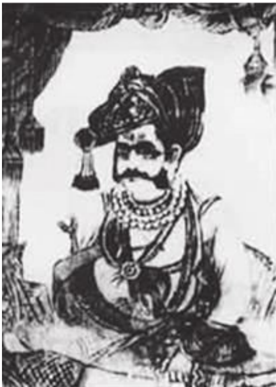
Рагхуджи I Бхосле

под контролем Бенгалии 25 , но все налоговые сборы, а не только чаутх , выплачивала в маратхскую казну. На престоле Бенгалии оставался ставленник Рагхуджи Мир Хабиб, поддерживавший его в борьбе с навабом . Кроме того, за эти годы на территории Берара Рагхуджи вывел из-под контроля низама и подчинил себе три важных форпоста с прилегающими к ним землями – крепости Гавилгарх, Нарнала и Маникдруг.