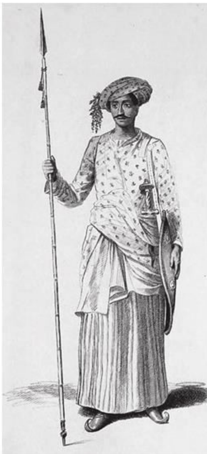
Маратхский воин. Путевая зарисовка из книги [Форбс 1835]

Мотта также интересовал потенциал пахотных угодий в Ориссе, условия сельскохозяйственного труда, налоговые отношения между землевладельцами и арендаторами, состояние ремесел. Он напрямую связывал запустение и бедность, царившие в посещенных им краях, с правлением маратхов, чей отрицательный образ он с особой старательностью выписывал на протяжении всего повествования. Он будто прикидывал, что можно получить с этих земель, и подспудно проводил мысль о том, что британцы были бы более рачительными хозяевами. По всему тексту рассыпаны замечания такого рода: