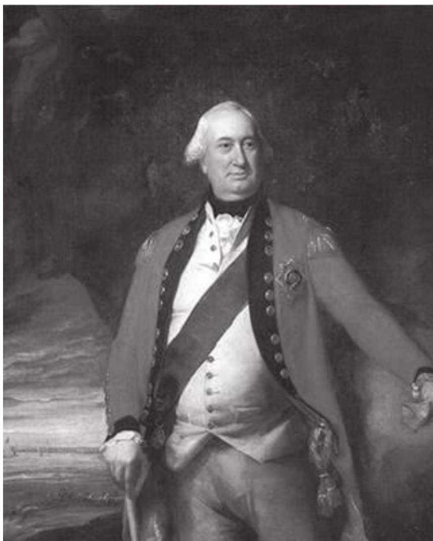
Джон Копли. Чарлз Корнуоллис, генерал-губернатор Бенгалии

Ежегодный доход княжеской казны Форстер оценил в 52 лакха рупий и дал разбивку по вкладу отдельных регионов княжества в общую копилку. Хотя К. Уиллс, сравнивая цифры Форстера с теми, что приводил Джеймс Рэннел в «Мемуаре» [Рэннел 1788], считал, что первый их несколько занижил. Также Форстер показал некоторые статьи и суммы расходов. Далее шла информация по численности, составу и состоянию войск. Он насчитал 10 500 человек/лошадей в составе кавалерии, разбросанных в разных частях княжества, и 300 сипаев, «ужасно одетых и плохо вымуштрованных» (цит. по [Уиллс 1926: 98]). «Нерегулярная пехота, численность которой невозможно определить, в основном рассредоточена по фортам и не заслуживает упоминания. Плохая артиллерия Мудходжи столь же плохо и содержится. Она исчисляется пятнадцатью единицами разного калибра. Пушки были произведены на нагпурском оружейном дворе местными оружейниками и находятся сейчас на обслуживании небольшой группы европейцев, прибывших сюда из разных краев 56 » [Там же]. Оценка материальных ресурсов Бхосле была очень важна, так как просветила британцев относительно «мощи» этой династии. Как записал Форстер в своем отчете: «На основе сведений касательно доходов и вооруженных сил Мудходжи Бхосле, он, как представляется, занимает второстепенную позицию среди правителей Индии» [Там же]. Кроме того, Форстер описал и сам город, обратив внимание на дорогие