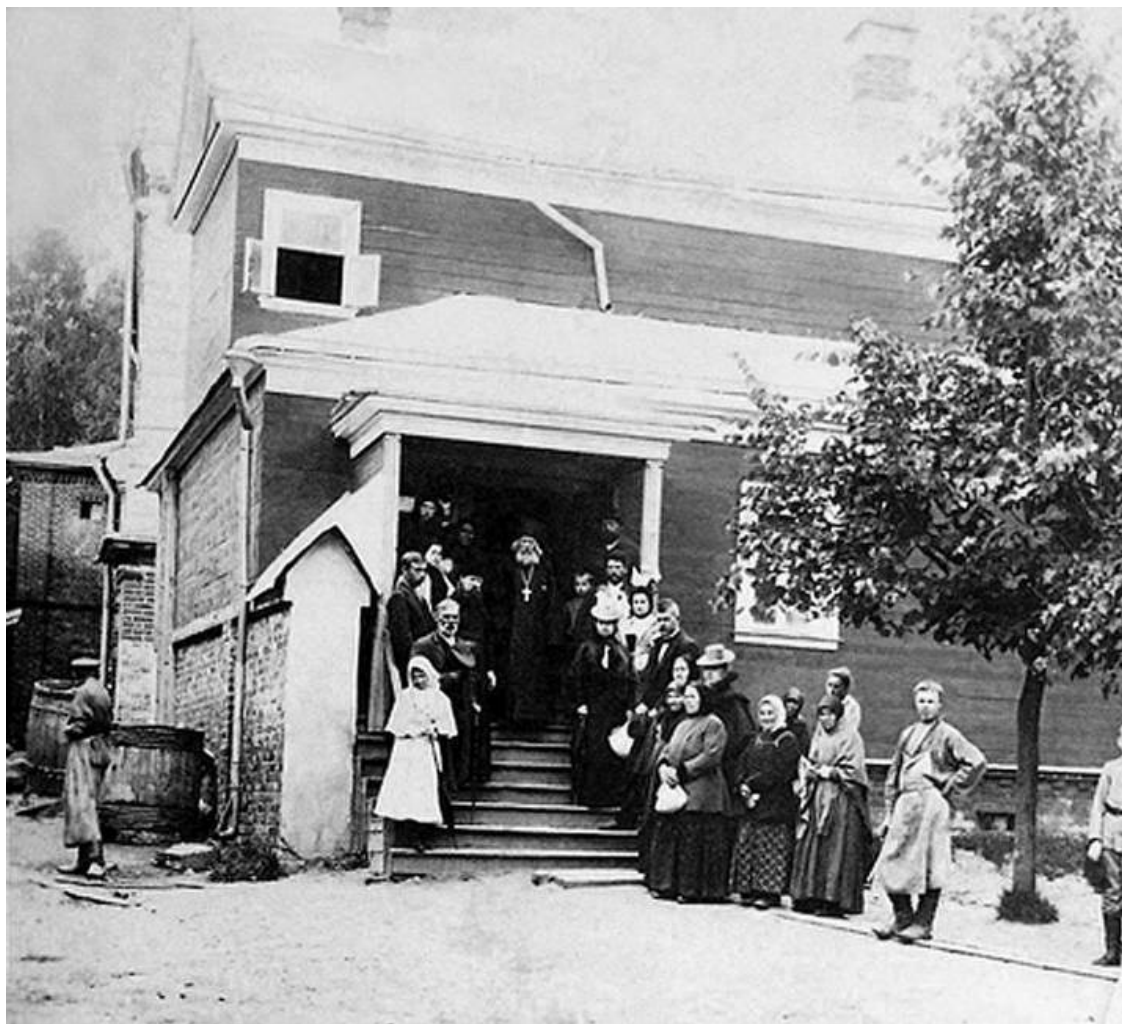
Паломники у отца Варнавы.

Для тех, кто воистину возлюбил Бога и возжаждал горнего уже на земле, великий гефсиманский старец составил правила, которые помогают подвижникам устоять в добродетели и, по возможности, избегать греха. В этих правилах он обобщил способы и средства, рекомендуемые опытными в христианской жизни и достигшими величайшей степени христианского совершенства мужами: