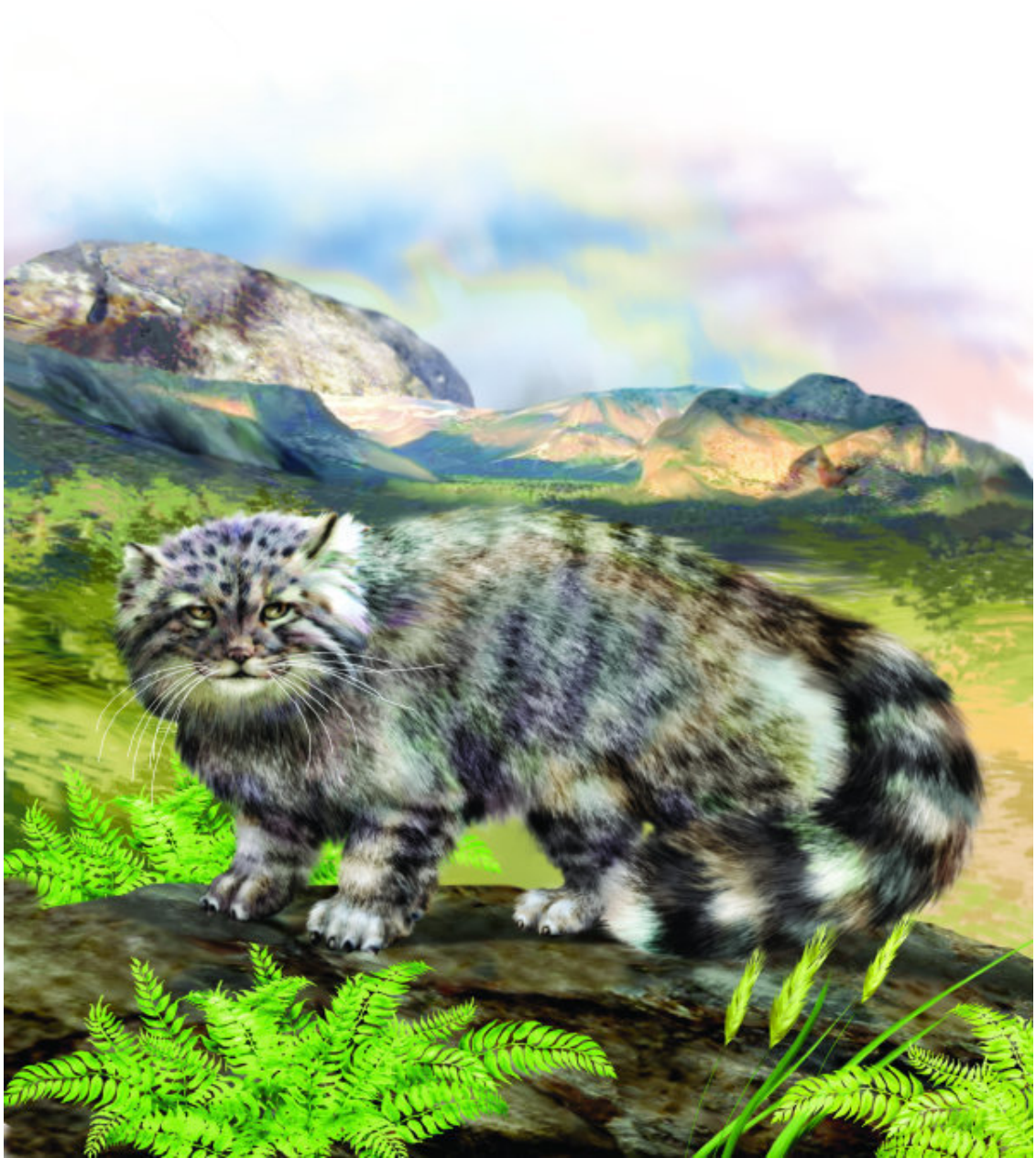
Манул – самый пушистый дикий кот

Оцелот, напротив, – очень крупная кошка. В длину вместе с коротким хвостом достигает полутора метров. Живет в северо-восточной части Южной Америки. Оцелоты ведут ночной образ жизни, охотясь и на земле, и на деревьях; они хорошо плавают.