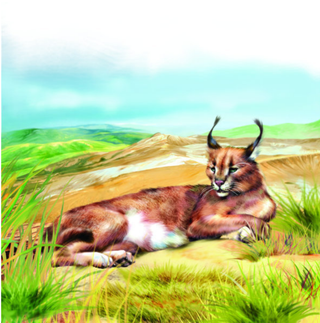
У каракала уши с кисточками, как у рыси

В Америке свои кошки. Например, пампасовая. Встречается не только на покрытых травой равнинах, но также в лесах и высокогорьях. На территории Боливии, Аргентины, Бразилии и Парагвая встречается кошка Жофруа. Так ее назвали в честь французского натуралиста Жофруа Сент-Илера, путешествовавшего по Южной Америке в XIX в. Эта кошка не только прекрасно лазает по деревьям, но и плавает; умеет ловить рыбу.