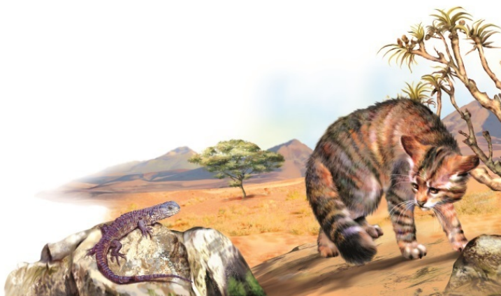
Степная африканская кошка

В Африке встречается другой вид диких кошек – золотистая африканская. Обитают они в джунглях Экваториальной Африки. Пигмеи Камеруна делают из хвостов этих кошек амулеты, которые якобы способны принести удачу во время охоты. В Африке можно встретить также сервала. Длина его тела вместе с хвостом достигает полутора метров. Эти дикие кошки могут охотиться даже на мелких антилоп.