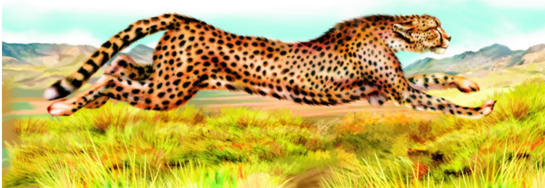
Гепард – самая быстрая кошка на свете

В Африке встречается другой вид диких кошек – золотистая африканская. Обитают они в джунглях Экваториальной Африки. Пигмеи Камеруна делают из хвостов этих кошек амулеты, которые якобы способны принести удачу во время охоты. В Африке можно встретить также сервала. Длина его тела вместе с хвостом достигает полутора метров. Эти дикие кошки могут охотиться даже на мелких антилоп.