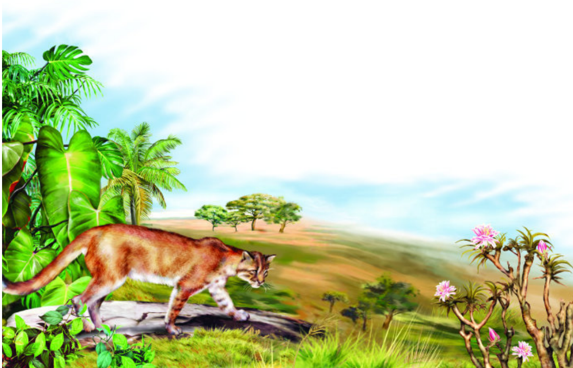
Африканская золотистая кошка

Домашние кошки относятся к роду Felis . Эта группа включает целый ряд видов. Одни из них больше похожи на наших мурлык, другие – меньше. Пожалуй, более всего напоминают домашних любимцев лесные европейские кошки. Они несколько крупнее домашних, их голова шире, а буровато-серый мех более густой и пушистый. Встречаются они в широколиственных лесах Западной Европы, в Молдавии, на Карпатах, на юге Украины, на Кавказе и в Малой Азии. Ранее лесные европейские кошки встречались на территории всей Британии, теперь остались только в северной Шотландии (к северу от Эдинбурга и Глазго). Взяты под охрану. Дикие европейские кошки могут скрещиваться с домашними кошками. Поэтому это не отдельный вид, а разновидность, или подвид.