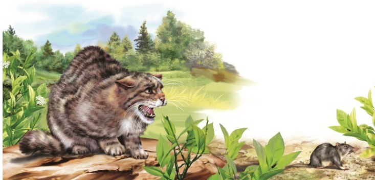
Лесная шотландская кошка

С их великородными собратьями кошек роднит способ охоты. Как пишут в серьезных справочниках, «кошачьи – наиболее специализированные из всех хищных, всецело приспособленные к добычанию животной пищи преимущественно путем скрадывания, подкарауливания и реже – преследования своих жертв». Когда в домашней кошке просыпаются древние инстинкты и она начинает подбираться к ничего не подозревающим голубям – это и есть скрадывание. Мысленно увеличьте кошку в несколько раз – и получите точную картину охотящейся львицы или леопарда. Различие лишь в размерах.