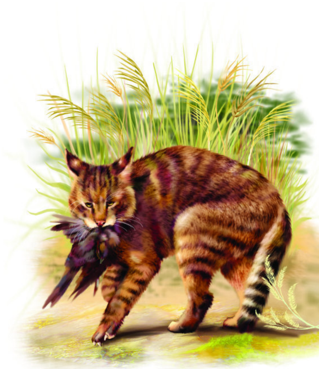
Хаус – камышовый кот

В Монголии обитает кот манул. В XVIII в. он был описан путешественником Питером Палассом, поэтому манула называют иначе палассовым котом. Он не приспособлен к быстрому бегу, поэтому в открытых степях практически истреблен, сохранился лишь в предгорьях. мех у манула густой, наиболее пушистый среди всех представителей рода Felis . На 1 квадратном сантиметре спины расположено до 9000 волос. В такой шубе никакие холода не страшны!