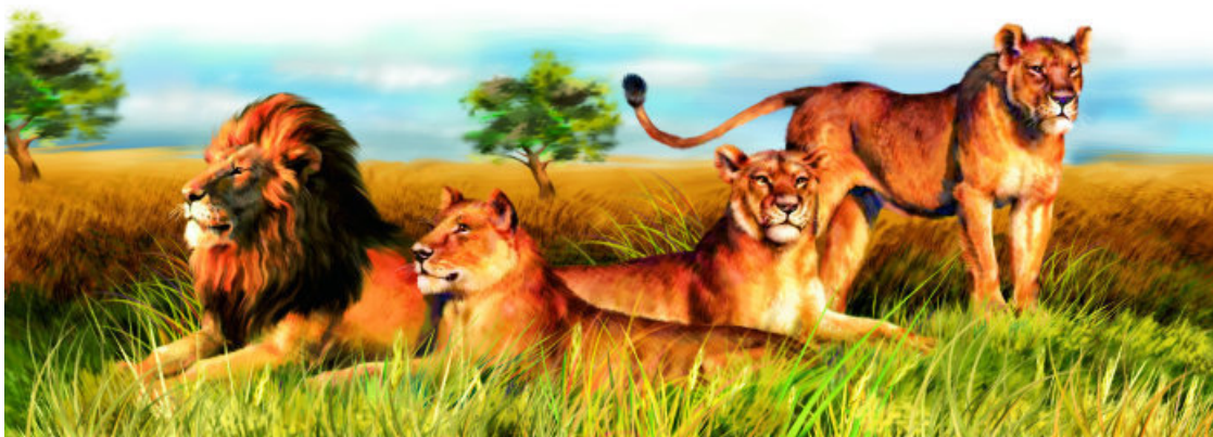
Семья львов называется прайдом

Современные хищники довольствуются менее защищенной добычей, и клыки у них не такие гигантские. В современном мире сходные экологические ниши занимают львы, тигры, леопарды, гепарды и снежные барсы. Теперь внимание! Все эти крупные хищники относятся к семейству Кошачьих. Название говорит само за себя. Сразу становится понятным, что наши мурки и барсики являются дальними родственниками настоящих серьезных хищников, которых побаивается даже человек.