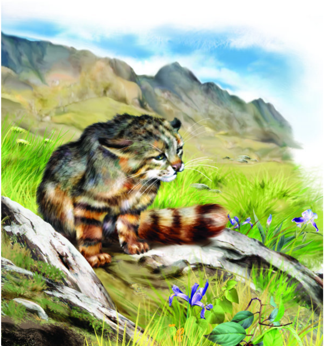
Пампасовая кошка обитает на просторах Америки

Кстати, столь же хорошие пловцы азиатские рыбные кошки. Они обитают вблизи рек и ручьев на территории Юго-Восточной Азии (Индия, Китай, Вьетнам, Таиланд, Суматра, Ява). Рыбные кошки умеют не только плавать, но и нырять за добычей. Любопытно, что между пальцами передних лап у них перепонки, которые помогают плавать и ловить рыбу.