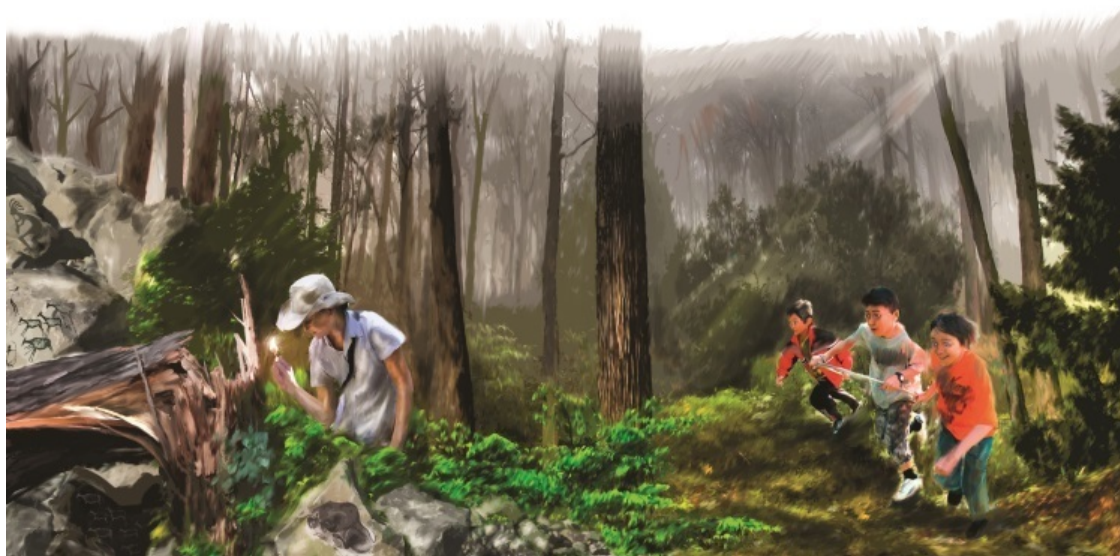
Может быть, эта лесная пещера хранит в себе какие-то тайны...

От первобытных охотников нас отделяют многие тысячелетия, поэтому все рассуждения об их нехитрой «магии» – не более чем предположения. Однако сохранились «документы», говорящие в пользу этих предположений.