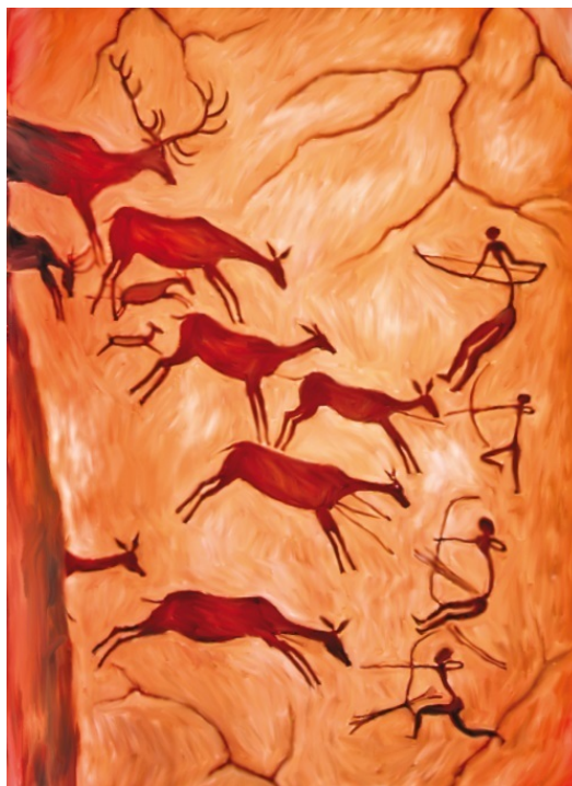
Наскальные рисунки древнего художника

Смелость, как известно, города берет. От психологического настроения успех любого дела сильно зависит. Кто храбрее, тот и зверя добудет, да и вообще любого врага скорее победит, чем нерешительный трусишка. Ритуалы помогали древним охотникам настроиться должным образом на нелегкое дело, изменяли их душевное состояние, вдохновляли на подвиги.