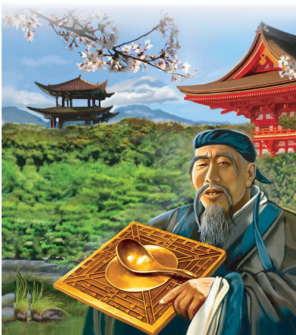
Так, согласно реконструкции, выглядит компас синан