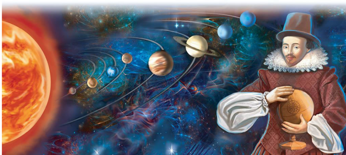
Уильям Гильберт – автор сочинения о магнетизме

До недавнего времени была популярна гипотеза о том, что магнитные свойства нашей планеты обусловлены ее жидким железо-никелевым ядром. Однако почему оно порождает магнетизм, оставалось неясным. Ядро нашей планеты от поверхности отделяет около 2900 километров, и что там в деталях творится – ученые вряд ли скоро узнают. В XX веке ученые обнаружили, что остывающая лава способна запечатлевать направление и силу магнитного поля Земли. Исследовав тысячи образцов лавы и определив их возраст, исследователи пришли к любопытному выводу. Оказывается, в истории нашей планеты бывали периоды, когда интенсивность ее магнитного поля резко падала. Неужели в ядре планеты в это время происходили какие-то существенные сдвиги?