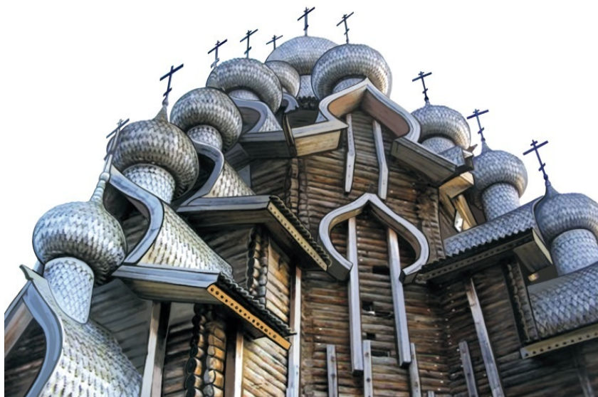
Чудо русского деревянного зодчества – храм в Кижях

Россия – удивительная страна. До Уральских гор – Европа, дальше, за их приземистыми кряжами – необъятная Азия. Над бескрайними просторами Сибири можно лететь часами и видеть внизу лишь зеленый ковер тайги, прорезаемый блестящими на солнце ниточками рек. Из западной части страны за то же время попадаешь в любую столицу Европы. От Дальнего Востока России совсем недалеко до Китая, Японии, Таиланда и даже до Америки – вон она, Аляска, за Беринговым проливом.