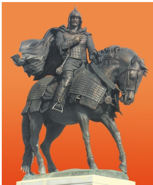
Памятник Дмитрию Донскому в Коломне

Построенный им мощный шестистолпный пятиглавый Архангельский собор был возведен по всем правилам традиционного русского каменного зодчества. Однако если приглядеться, в нем видны и итальянские черты. Фасады храма разделены карнизом на две горизонтальные части, заметны плоские колонны – пилястры, на Руси таких раньше не делали.