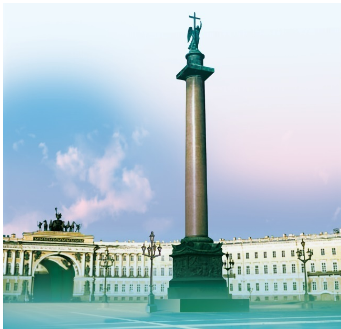
Александровская колонна в Петербурге

Давайте совершим воображаемое путешествие по России. Начнем, конечно, со столицы страны – Москвы. Потом посетим Северную столицу – Петербург. Затем побываем в старинном русском городе Пскове. Оттуда недалеко до Новгорода. Далее поедem на север, полюбуемся деревянными церквями Кижей и каменными башнями Соловков. С берегов Белого моря через Ярославль и Сергиев Посад доберемcя до Владимира и Суздаля и далее, вниз по Волге, поплывем к стенам древнего Казанского кремля.