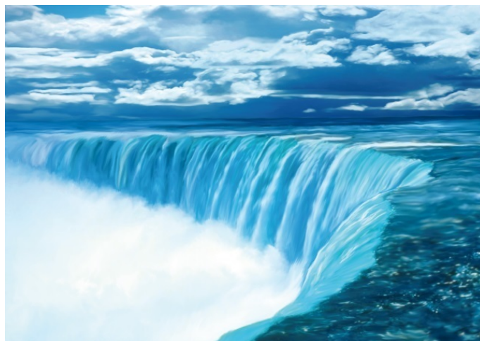
Ниагарский водопад – одно из чудес природы

Как известно, вода камень точит. Падающая вода как гигантским рашпилем грызет откос, в результате чего граница падения воды ежегодно немного сдвигается вверх по течению. За тысячи лет водопад «добрался» почти до середины Ниагары. Местные власти решили, что такое «уползание» водопада следует остановить, и с помощью инженеров-гидротехников отвели часть потока в подземные трубы. Теперь Ниагара стала регулируемой, сезонный избыток воды можно без вреда для скал сбрасывать вниз. Энергия потока не пропадает даром. Она вращает турбины местной электростанции.