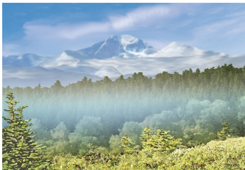
Канадские власти сумели сохранить почти в неприкосновенности природу страны

Самый мощный в Северной Америке водопад находится в Канаде на реке Ниагара, отделяющей американский штат Нью-Йорк от канадской провинции Онтарио, поэтому на стихию ревущей воды можно смотреть как из Канады, так и из США. Ежесекундно с огромного уступа, так называемого Ниагарского откоса, вниз низвергается около 6 тысяч кубических метров воды. Рев стоит невероятный, а воздух насыщен мириадами крошечных водяных капель.