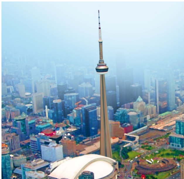
Телебашня в Торонто

ния у пассажиров как во время взлета самолета – уши то и дело закладывает. Одна стенка лифта стеклянная, так что можно любоваться видом города со все увеличивающейся высоты, если, конечно, смелости хватит. Самые решительные могут подняться еще выше, на верхнюю обзорную площадку Спейс Дэк. От земли ее основание поднято на 447 м.