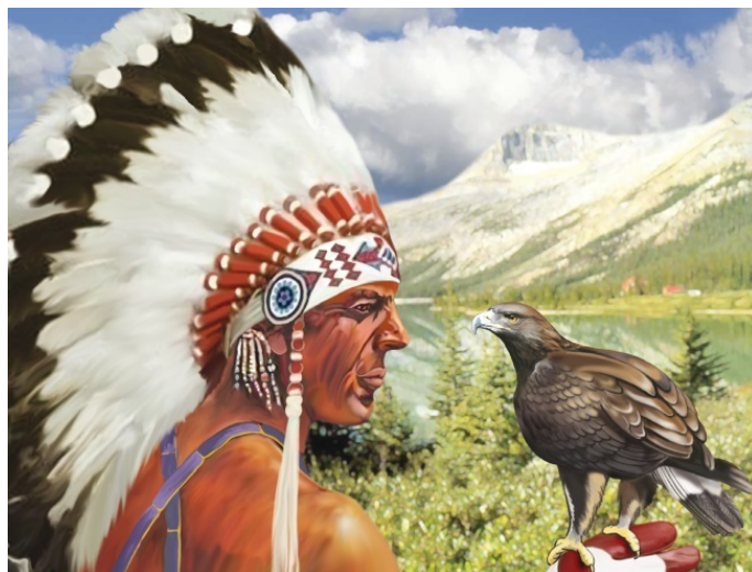
Коренной житель Скалистых гор в Канаде

Великое творение природы – Ниагарский водопад, привлекающий множество туристов. Река Ниагара соединяет между собой два из Великих озер: течет из озера Эри в озеро Онтарио. А в ее среднем течении на порогах, где перепад высот достигает нескольких десятков метров, и находится это чудо природы, Ниагарский водопад, с которого мы и начнем наше путешествие по Канаде.