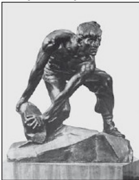
Булжник – оружие пролетариата. Скульптор И. Шадр. 1927 г.

Наибольшего подъема забастовочная волна достигает в 1903 г. Тогда произошло 2099 забастовок (примерно треть от их общего числа за 1895-1903 гг.), в которых участвовало около 330 000 человек. В 1903 г. число стачек в России возросло по сравнению с 1902 г. в 3,6 раза, а стачечников – в 2,5. Ведущую роль в забастовочной борьбе играли квалифицированные рабочие: металлисты, рабочие железнодорожных мастерских, отличавшиеся большей восприимчивостью к лозунгам революционных партий, большей организованностью, а также текстильщики, горняки. Активно бастовали рабочие-нефтяники Бакинской губернии.