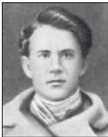
В. С. Волков

Несмотря на это, Моисеенко и Волков, по распоряжению министра внутренних дел, были сосланы в Архангельскую губернию.