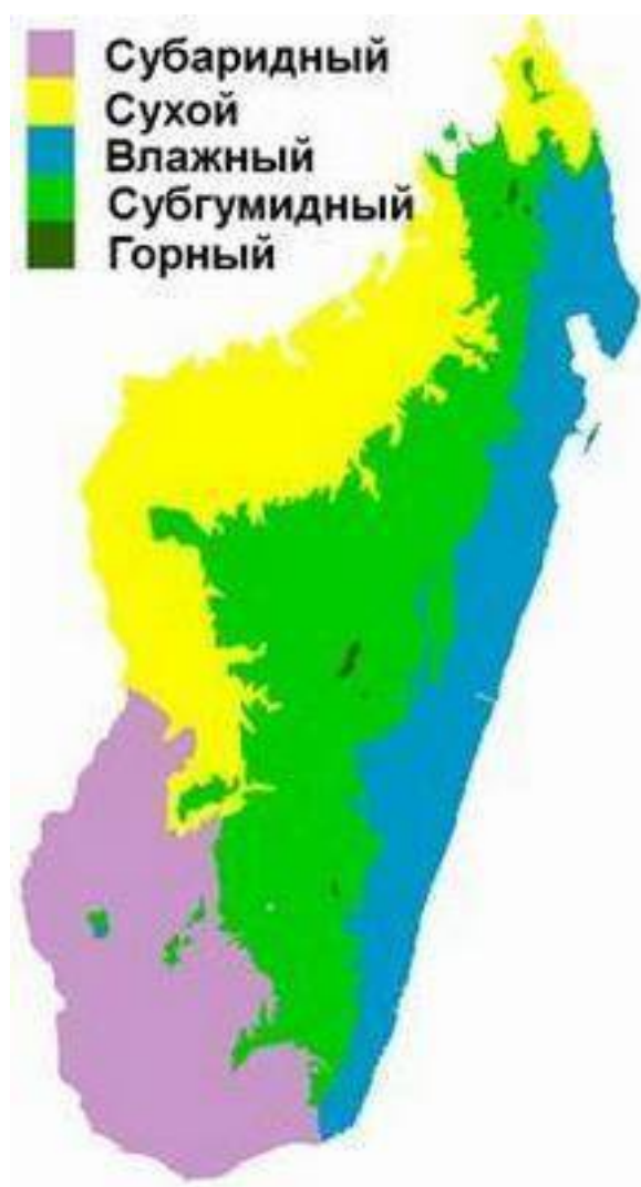
Рис. 4. Климаты на о. Мадагаскар

Широтная протяжённость Мадагаскара и асимметрия рельефа определяют изменение температур в течение года и по сезонам. Существует жаркий сезон, совпадающий с максимумом дождей, и холодный сезон. Среднегодовые температуры варьируют между от 27 °С на уровне моря на севере и 24 °С – на юге; 16,5 °С – на высоте 1500 м над у.м. на центральном нагорье.