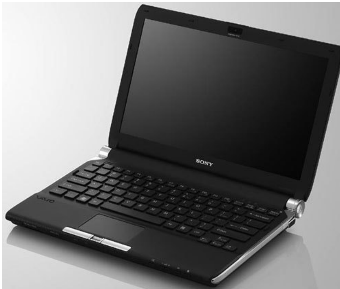
Рис. 1.1. Внешний вид нетбука

От экрана, или матрицы, больше всего зависит комфортность работы с нетбуком. Размер экрана принято измерять по диагонали в дюймах. В легких и маленьких нетбуках диагональ экрана составляет 9-12 дюймов. Собственно, размер экрана определяет габариты всего нетбука.