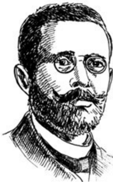
Рис. 6. Г. Носке

Восстание началось стихийно, под воздействием чрезмерной усталости народа от войны. Мятеж моряков, отказавшихся идти в бой и поднявших руку на своих офицеров, подхватили народные массы, и с Киль волнения перекинулись на другие крупнейшие города страны. Разумеется, в своих действиях мятежники ориентировались на октябрьские события в России, поэтому сразу после вооруженного захвата власти повстанцами были созданы первые рабочие и солдатские Советы.