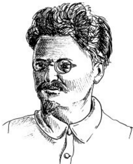
Рис. 3. Л. Д. Троцкий

сроком до 14 января будущего года. В отведенное до середины января время стороны должны были определиться с условиями заключения мирного договора, которые следовало выработать и согласовать впоследствии на мирной конференции. Она начала свою работу в Брест-Литовска, и уже 3 марта был подписан мирный договор, который стал именоваться Брестским. Пользуясь слабостью молодой Советской Республики, в чьих жизненных интересах было скорейшее заключение мира, австро-германская сторона в лице председателя делегации Рихард фон Кюльмана выдвинула свои условия прекращения войны, крайне жесткие для советской стороны. Согласно заявленным требованиям, Россия утрачивала значительные территории Эстляндии и Лифляндии, передавала Германии Литву и Курляндию, а также находившиеся в составе Российской империи польские территории. Позднее, 18 января 1915 г., Германия добавила к своим требованиям присоединение значительной части белорусских земель. С учетом новых требований Россия лишалась более 150 000 км 2 своих территорий, что не могло не вызвать протеста у советской делегации. Острые дебаты относительно мирного договора возникли и в новом правительстве. В. И. Ленин продолжал настаивать на подписании мирного договора, аргументируя это тем, что разложившаяся в результате большевистской пропаганды российская армия была не в состоянии завершить войну, а сам договор после грядущей германской революции утратит свой смысл.