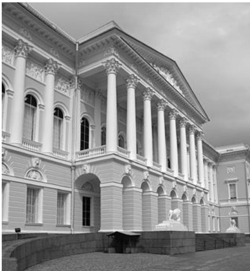
Государственный русский музей, Санкт-Петербург

В российских «творческих» вузах, к которым относятся, например, консерватория или академия художеств, историю русского искусства проходят отдельным курсом. Зарубежное, главным образом европейское, искусство – это один крупный блок знаний. Русское искусство – другой. Патриотизм? Не только. И даже не столько. Разумеется, студенты, которые собираются стать искусствоведами, должны сначала иметь представление о художественной культуре своей родины, а уже потом, так сказать, расширять угол обзора. Но на одном патриотизме целый учебный курс не построишь, верно? Русское искусство – это, в первую очередь, огромный массив информации.