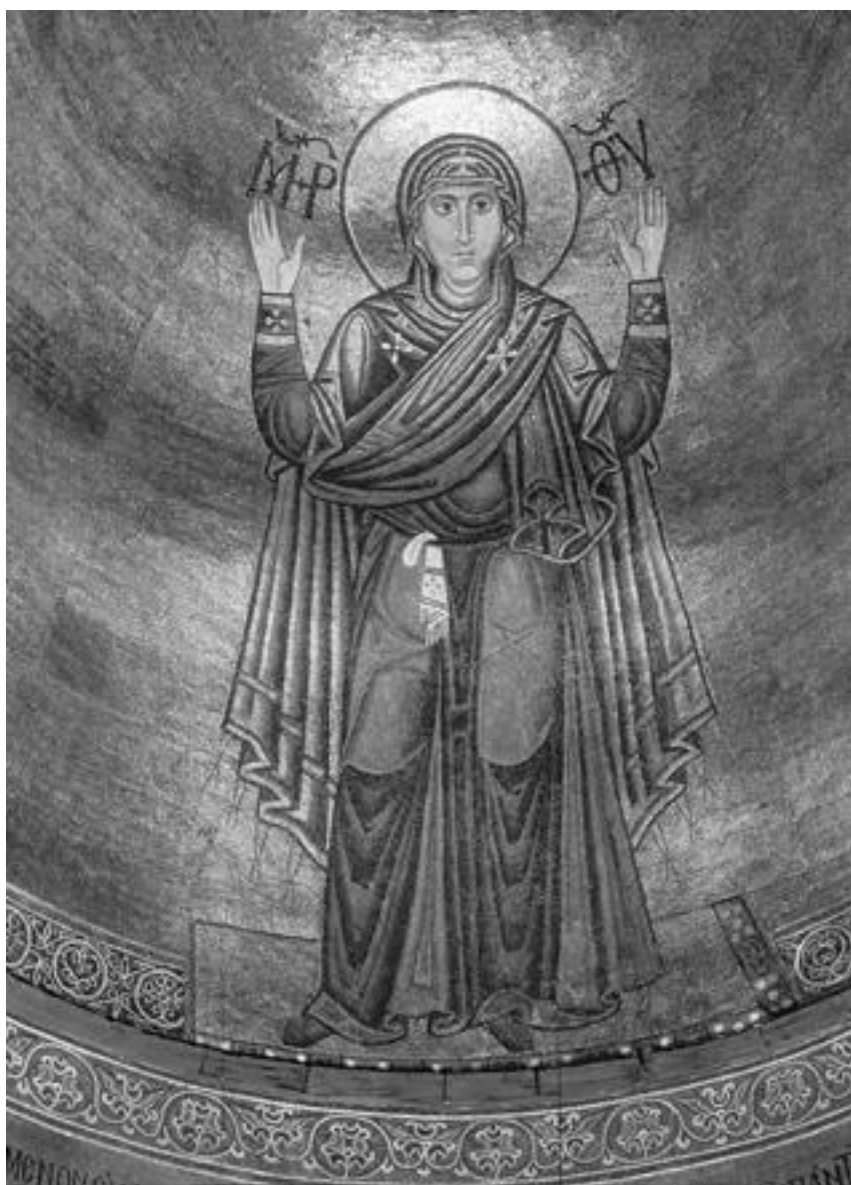
Богоматерь Оранта (Нерушимая Стена). Мозаика в алтаре Софийского собора в Киеве, XI век

Мозаики в соборах были для верующих книгой, по которой они изучали жизнь святых и основные притчи христианского вероучения. Это была целая система наглядного провозглашения идеи, своего рода «Евангелие для неграмотных».