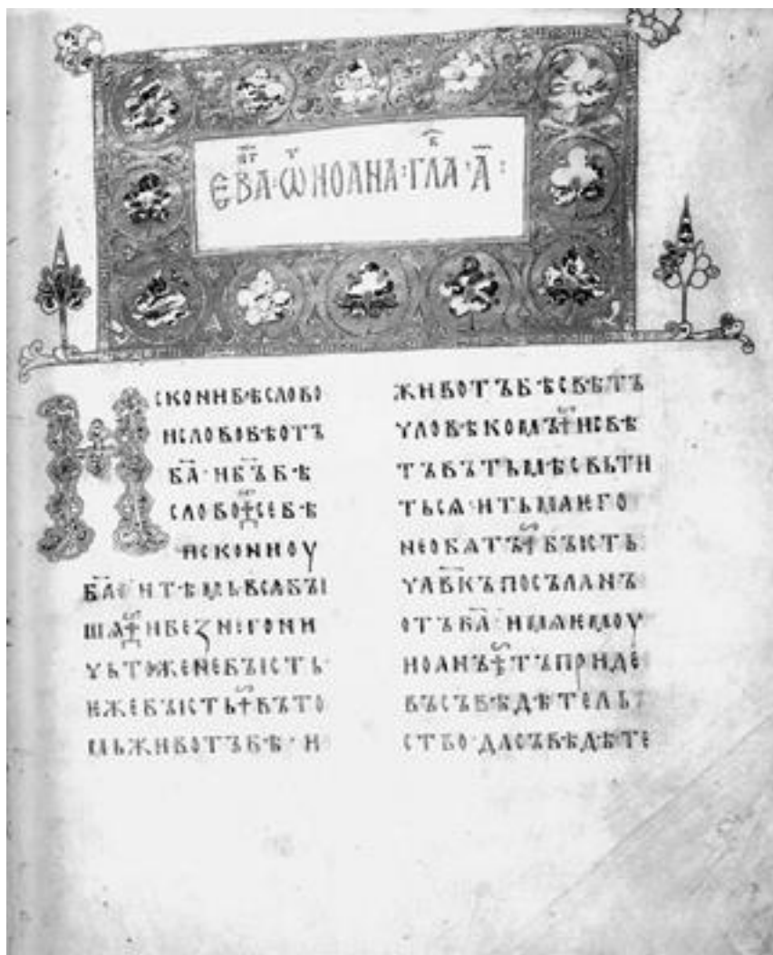
Страница Остромирова Евангелия

Что же такое византийское влияние? Говоря просто и понятно, это христианизация. Кульминацией и финалом которой станет крещение Руси в 988 году. Византией называлась вторая половина Римской империи, ее Восточная часть со столицей в Царь-граде. Разделение огромного государства на западную и восточную территории в будущем даст основания для Великой Схизмы (1054 год), после которой появились Римско-католическая и Православная церкви, – но это нескоро. А пока, еще в X веке, заключаются торговые договоры между молодым государством Русь и государством Византийским. Государство Русь было образовано вокруг Киева. Это было объединение славянских племен, таких как поляне и древляне, например, возглавляемых князьями, которые подчинялись «князю князей» – киевскому. В результате этого единства была создана единая народность – древнерусская. Примерно к началу эпохи Средневековья прилагательное «русский» уже вошло в обиход.