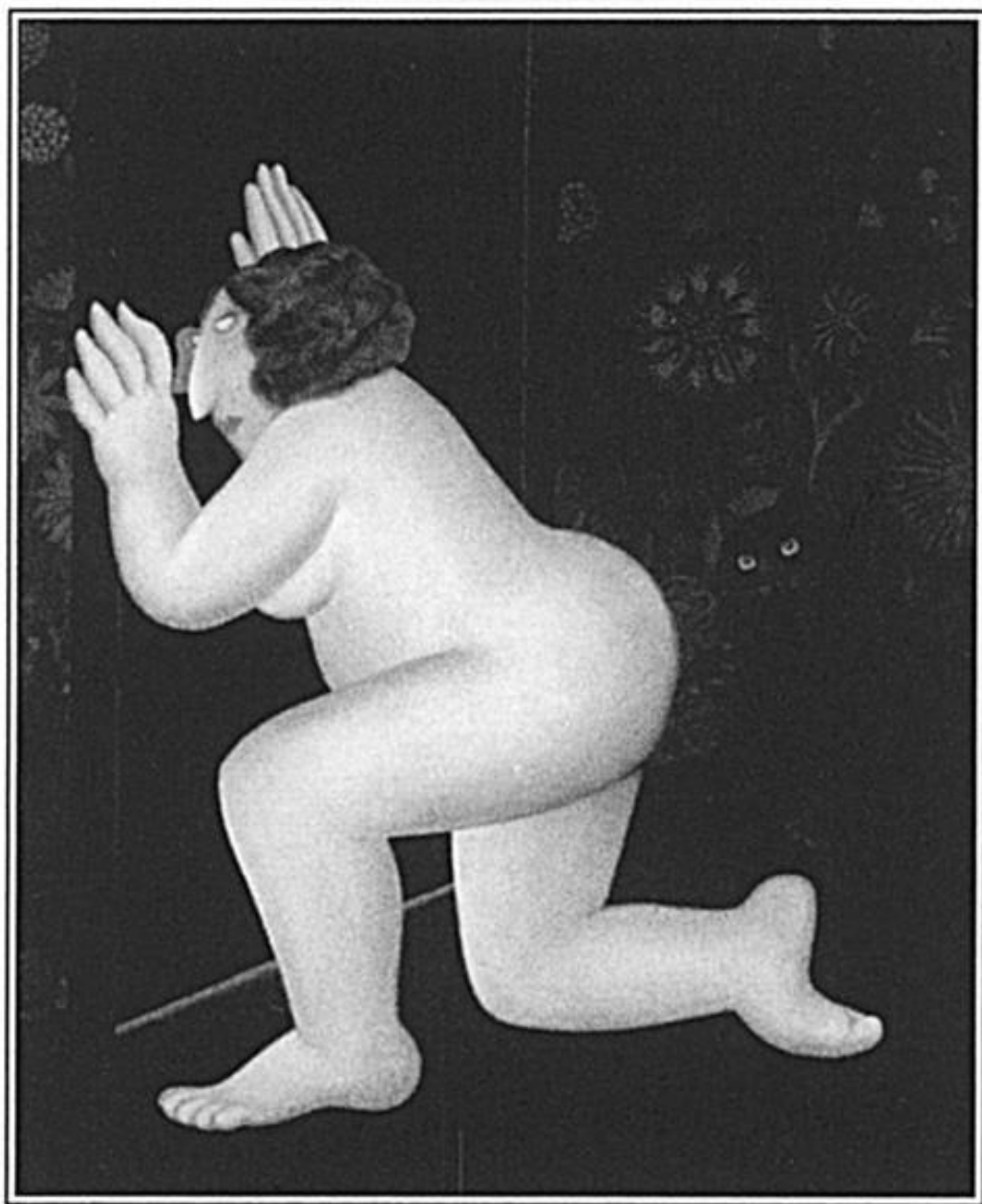
Берил Кук, «Замочная скважина», 1981

Я пытаюсь различить детали, но все сливается. Это Кейто Кейлин был тайным любовником Тони Хардинг? Я правильно помню, что Хайди Флейс наняла братьев Менендес, чтобы разделаться с Джоном Уэйном Боббитом? Вуди Аллен был за рулем белого форда, на котором Майкл Джексон сбежал из квартиры, которую снимали Джон Кеннеди – младший и Дэрил Ханна?