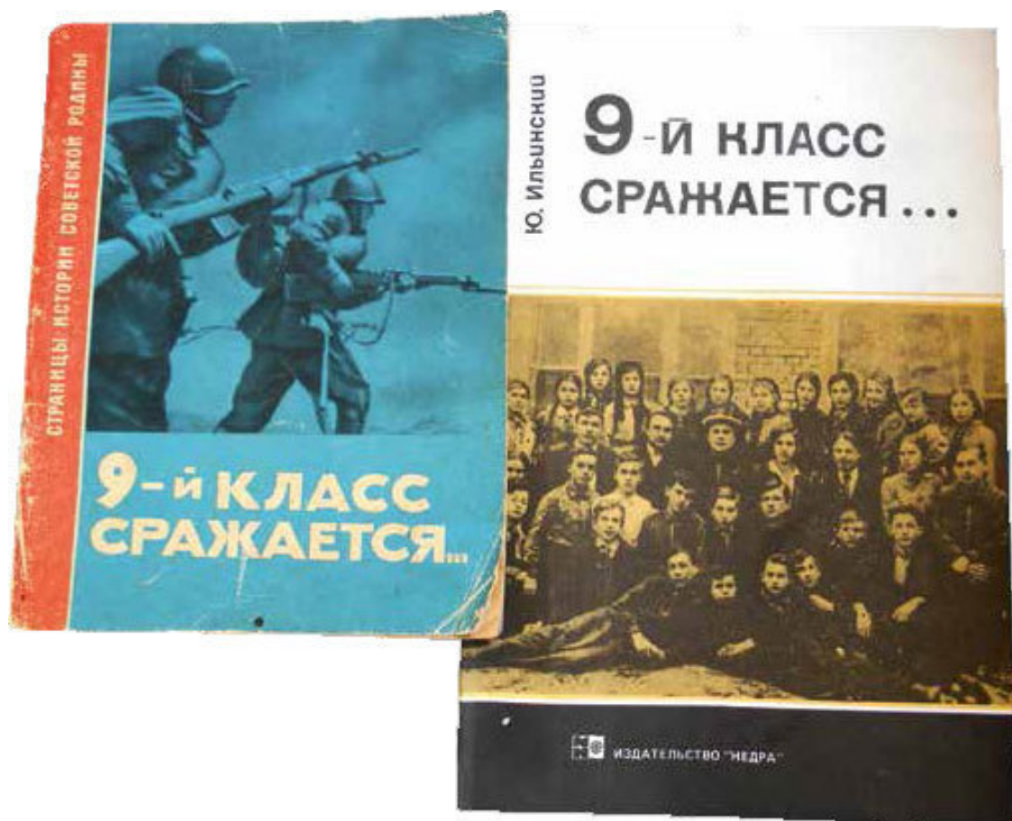
Первое (1963 г.) и последнее (1995 г.) издания книги о 9 «Б»