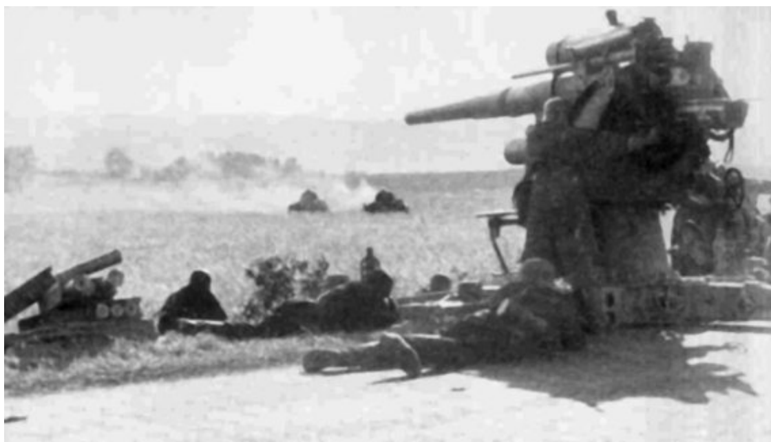
Немецкое 88-мм зенитное орудие ведет огонь по советским танком в районе Расейняй – Василишкис

Как бы там ни было, стреляли немцы с достаточно близкого расстояния и весьма точно. Огонь был метким, удалось добиться восьми попаданий. И когда уже казалось, что все кончено, орудие танка медленно повернулось, тщательно прицелилось и методичным огнем уничтожило обе новенькие пушки. При взрыве боеприпасов, сложенных у одного из орудий, погибло два артиллериста, один был ранен.