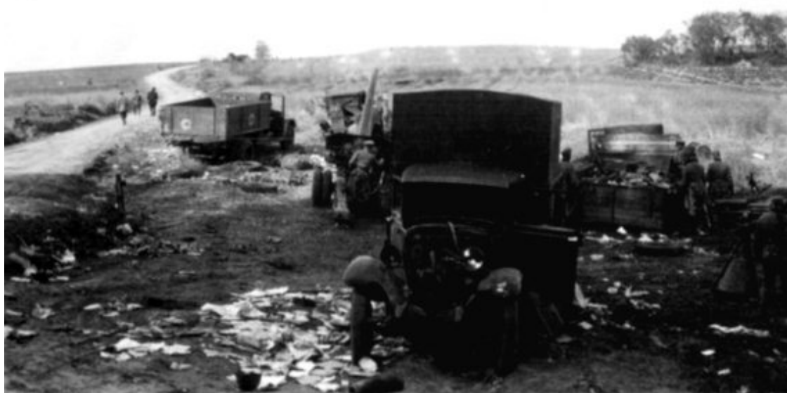
Разбитые советские грузовики в районе Расейня