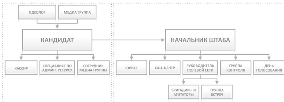
СХЕМА ШТАБА РЕАЛЬНАЯ