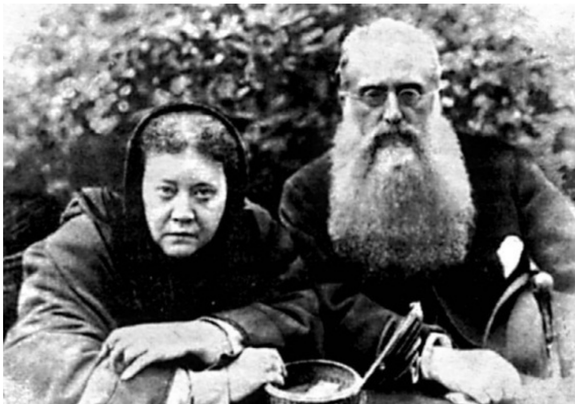
Елена Блаватская и Генри Олькотт – основатели Теософского общества

Палеофантастикой была и книга нового «западного гуру» Елены Блаватской, из которой я и почерпнул реконструкцию мира под правлением Атлантиды.