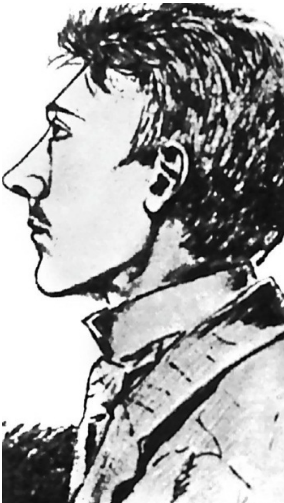
Адольф Гитлер (портрет, выполненный его школьным товарищем в 1905 году)

Как видите, еще в юности Гитлер пришел к тому, к чему пришли Гвидо фон Лист и Адольф Ланц в зрелом возрасте. Поэтому нет ничего удивительного, что позднее он впитывал труды австрийских расистов-эзотериков, как губка, и в его речах можно найти цитаты из них.