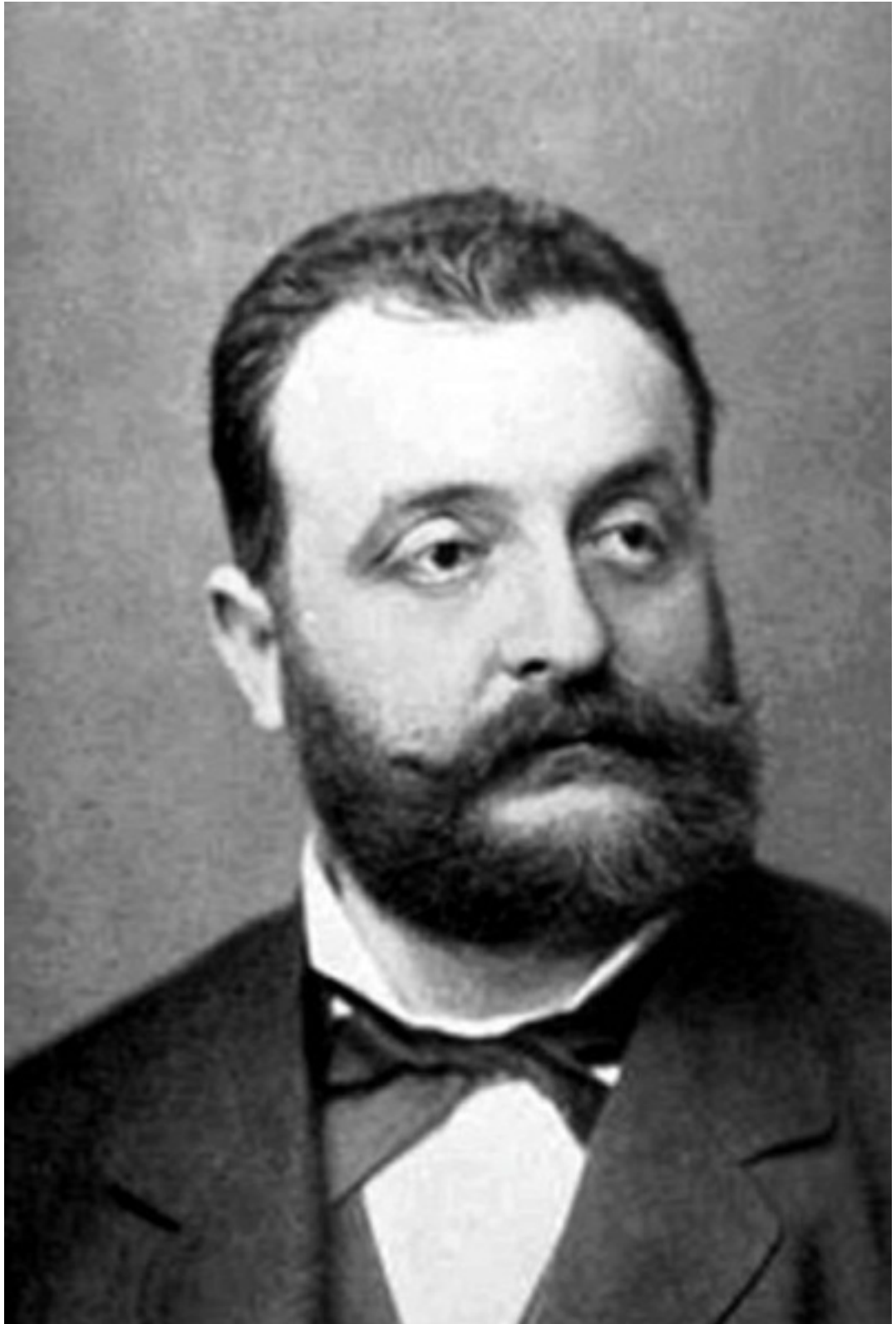
Основатель ариософии Гвидо фон Лист

Получивший поддержку общественности, фон Лист написал серию «Арио-германских исследовательских отчетов» («Guido-List-Buecherei»), которые в основном содержали оккультные интерпретации национального прошлого. Его идеология, основанная на противопоставлении немецких и славянских интересов, буквально заворожала народнические кружки Гер-