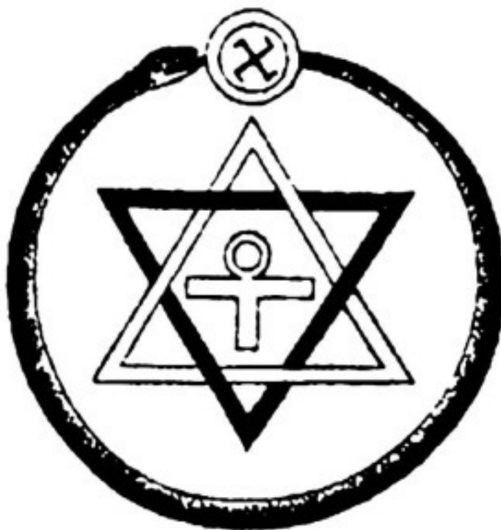
Один из вариантов эмблемы Теософского общества

Помимо расовых акцентов, теософия также подчеркивала принцип элитаризма. Елена Блаватская претендовала на безусловный авторитет, определяемый ее местом в оккультной иерархии. В своих рассказах о предыстории человечества она также часто ссылается на выдающуюся роль элитарных священников коренных рас прошлого. Так, когда лемурианцы погрязли во зле и пороке, только «избранные» остались чисты духом. Впоследствии они составили лемуру-атлантическую династию королей-жрецов, обитающую в легендарной стране Шамбала в пустыне Гоби (раньше, по мнению Блаватской, там был роскошный остров).