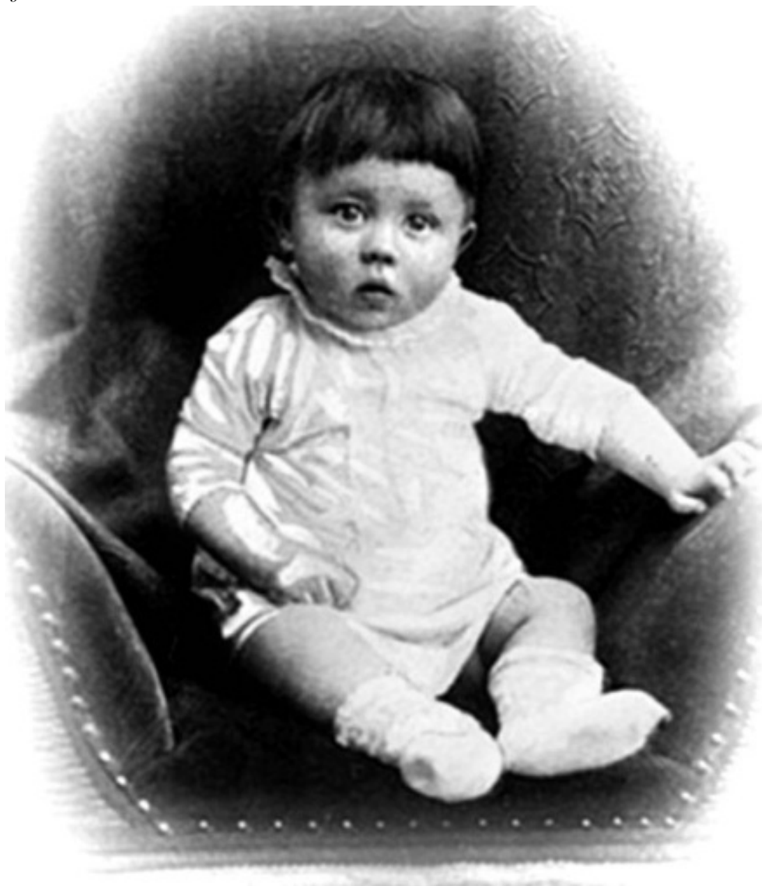
Адольф Гитлер в младенчестве

школе в Ламбахе. Это давало мне возможность часто бывать в церкви и прямо опьяняться пышностью ритуала и торжественным блеском церковных празднеств. Было бы очень натурально, если бы для меня теперь должность аббата стала таким же идеалом, как им в свое время для моего отца была должность деревенского пастора. В течение некоторого времени это так и было. Но моему отцу не нравились ни ораторские таланты его драчуна сынишки, ни мои мечты о том, чтобы стать аббатом. Да и я сам очень скоро потерял вкус к этой последней мечте, и мне стали рисоваться идеалы, более соответствующие моему темпераменту...»