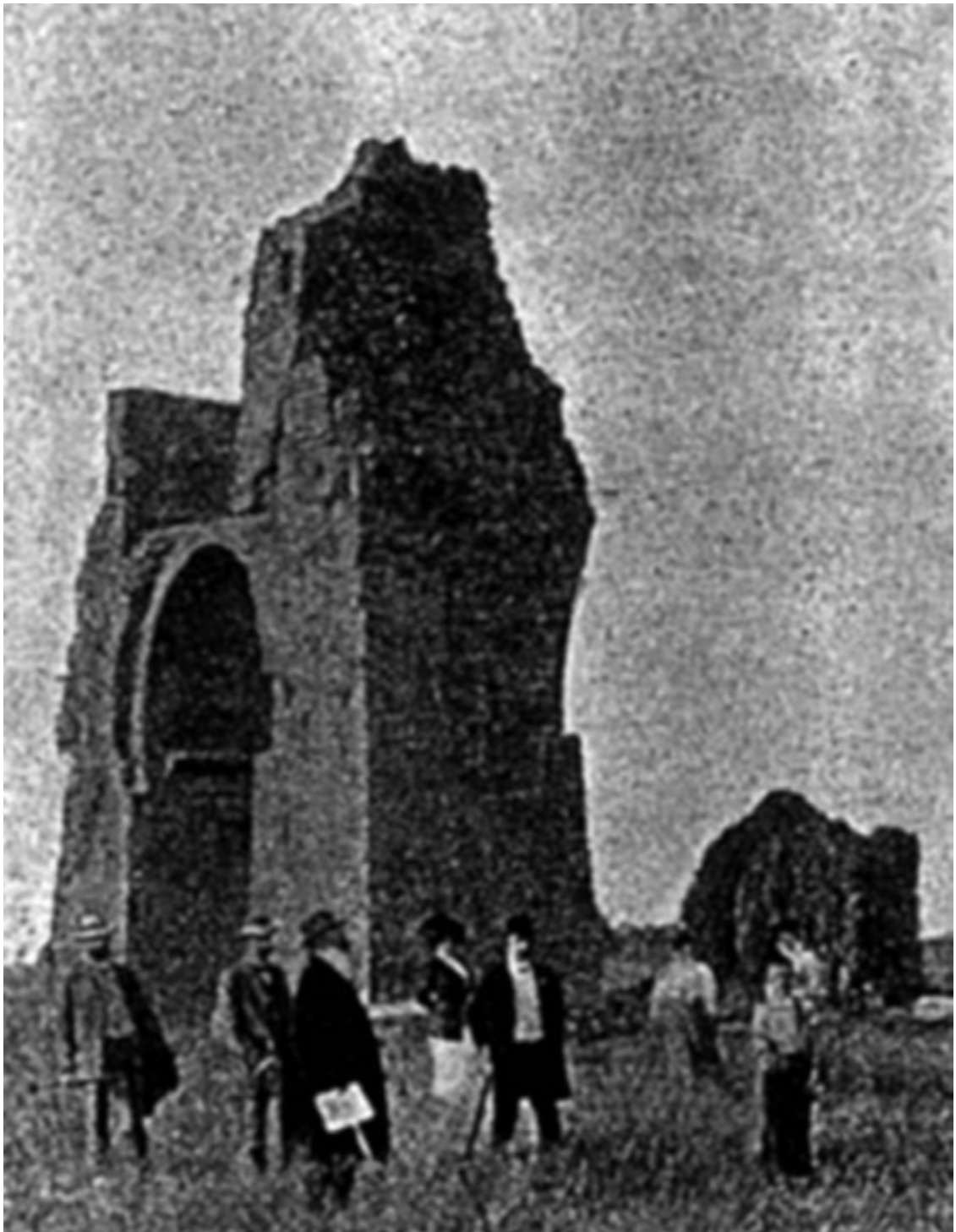
Гвидо фон Лист с членами своего Общества осматривает древние руины (1911 год)

В апреле 1915 года Гвидо фон Лист собрал конференцию своих поклонников в Вене. Он произнес торжественную речь, в которой приветствовал мировую войну как начало тысячелетнего сражения, предвещающее наступление новой эпохи. Он предупредил, что переходный период первоначально может быть связан с «ужасными преступлениями и сводящими с ума мучениями», но все испытания должны послужить окончательному отделению добра от зла.