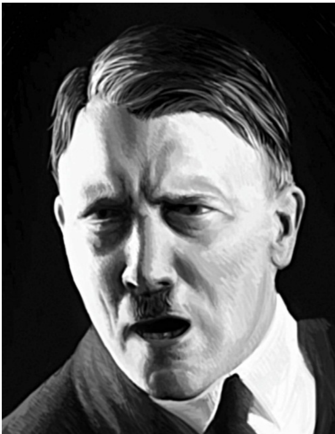
Адольф Гитлер выступает перед публикой

И все же не это было главное в Гитлере. Власть и признание пришли к нему, благодаря его необычайной харизме. Людей привлекало не только то, что он им говорил, но и как говорил, как он вел себя при выступлениях или дискуссиях.