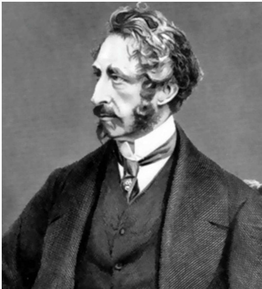
Английский писатель Эдвард Бульвер-Литтон, автор романа «Грядущая раса»

им делом и жил сообразно своим склонностям, не возбуждая ничьей зависти или стремления превзойти его».