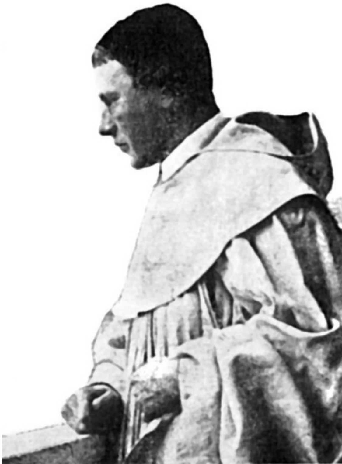
Адольф Ланц (Йерг Ланц фон Либенфельс), основатель Ордена новых тамплиеров