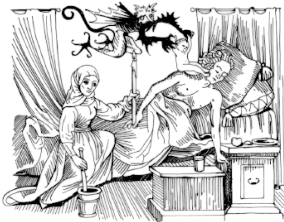
Душа покидает человека в момент его смерти

Смерть всегда заставляла человека задуматься над ее сущностью. Именно смерть побудила людей создать миф о бессмертной душе.