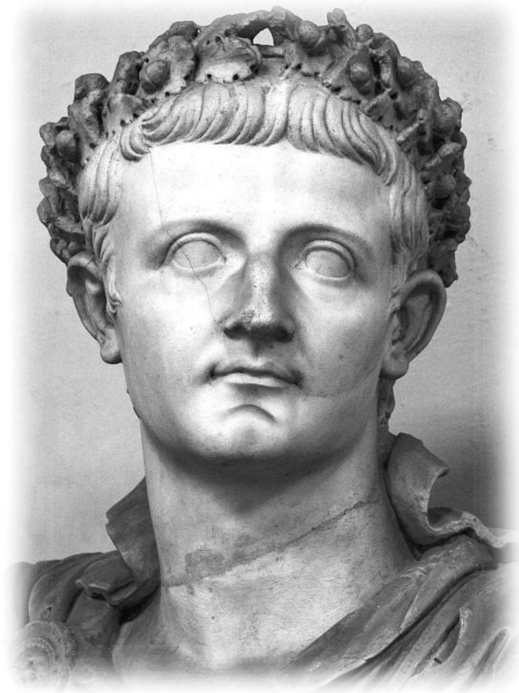
Тибери́й Цеза́рь Авгу́ст, импера́тор Рима

Но только шпионить я не собираюсь, о чём и заявил сходу. А он грустно взглянул и говорит: