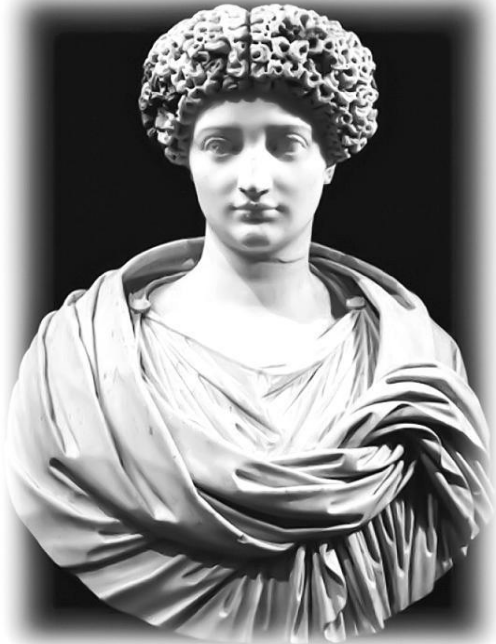
Юлия, дочь Октавиана Августа

Она издевалась над моим другом, унижала его своими ночными похождениями, писала на него доносы и кляузы отцу. Ко всему этому добавлялась скорбь от запрета видеть любимую женщину. В конце концов Тиберий не выдержал и решил уехать в добровольное изгнание на Родос. Он уже тогда руководил всей римской армией, был народным трибуном, но Октавиан не отпускал его, не понимая, как может пасынок и зять добровольно отказаться от огромной власти второго лица в империи и уехать на какой-то остров.