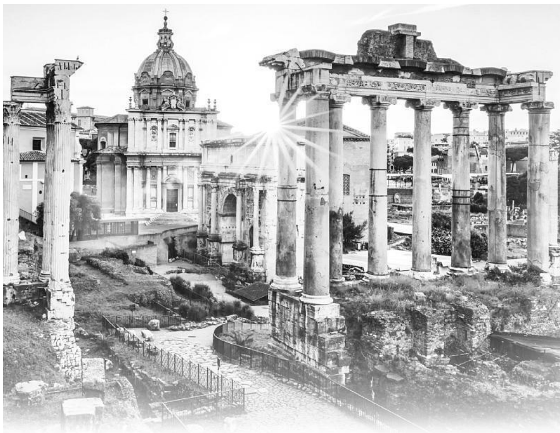
Сохранившаяся часть Древнего Рима

Особое внимание приходится уделять многочисленным кораблям, что приплывают к берегам благословенной Капреи и тем, кто ищет приёма у Цезаря: того и гляди, враги и предатели Рима подoshьют тайных убийц. Так что моя верная супруга Валерия и драгоценный сын Антоний видят меня столь редко, будто я снова в дальних походах.