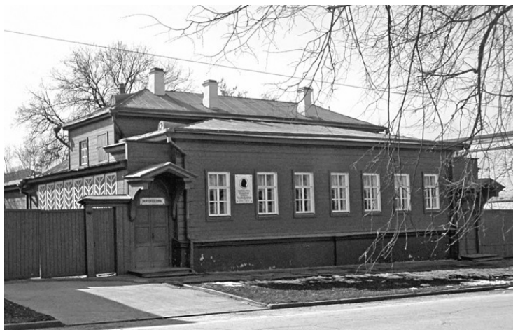
Дом Ульяновых в Симбирске (ныне Ульяновск)