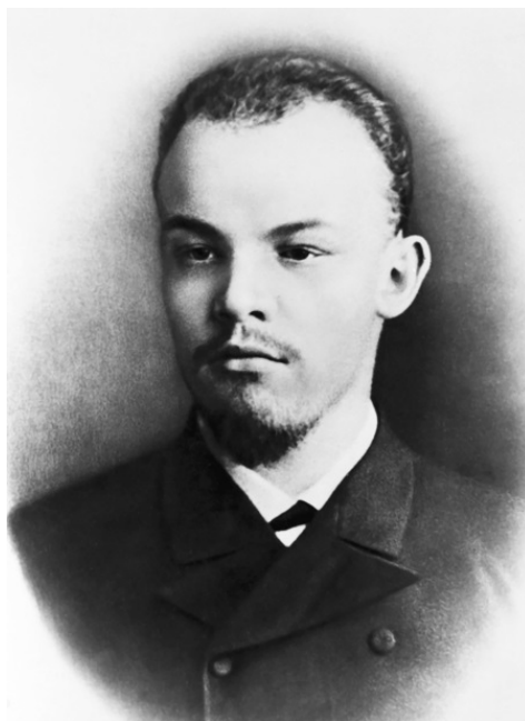
Владимир Ульянов в молодости

Сохранились и его приметы: «Ростом 2-х аршин и 6 вершков (168,9 см. – В.Л. ), волосы на голове, усы и борода светло-русые, лицом бел, чист, глаза карие». Сопоставьте эти приметы с полицейской справкой о Ленине, и вы увидите – «в кого пошел» внук.