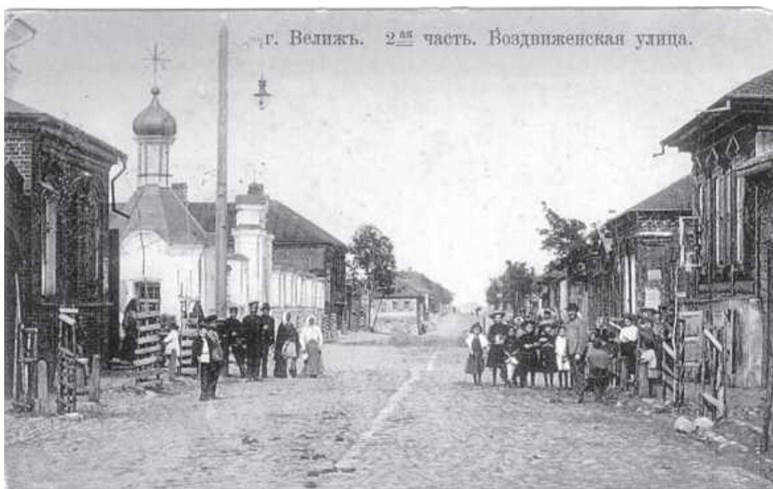
Велиж. 2-я часть. Воздвиженская улица. Фото нач. XX века

«Велижское дело» длилось 12 лет. Решающую роль в снятии с евреев обвинения сыграл владелец велижского имения Селезни гр., адмирал Н. С. Мордвинов. Взявшись за это дело, он пришёл к выводу, что оно сфабриковано, а обвинение евреев имело источником злобу и предубеждение. В результате все 40 с лишним подозреваемых в убийстве мальчика евреев были оправданы, а свидетели, доказчицы и родители мальчика сосланы в Сибирь.