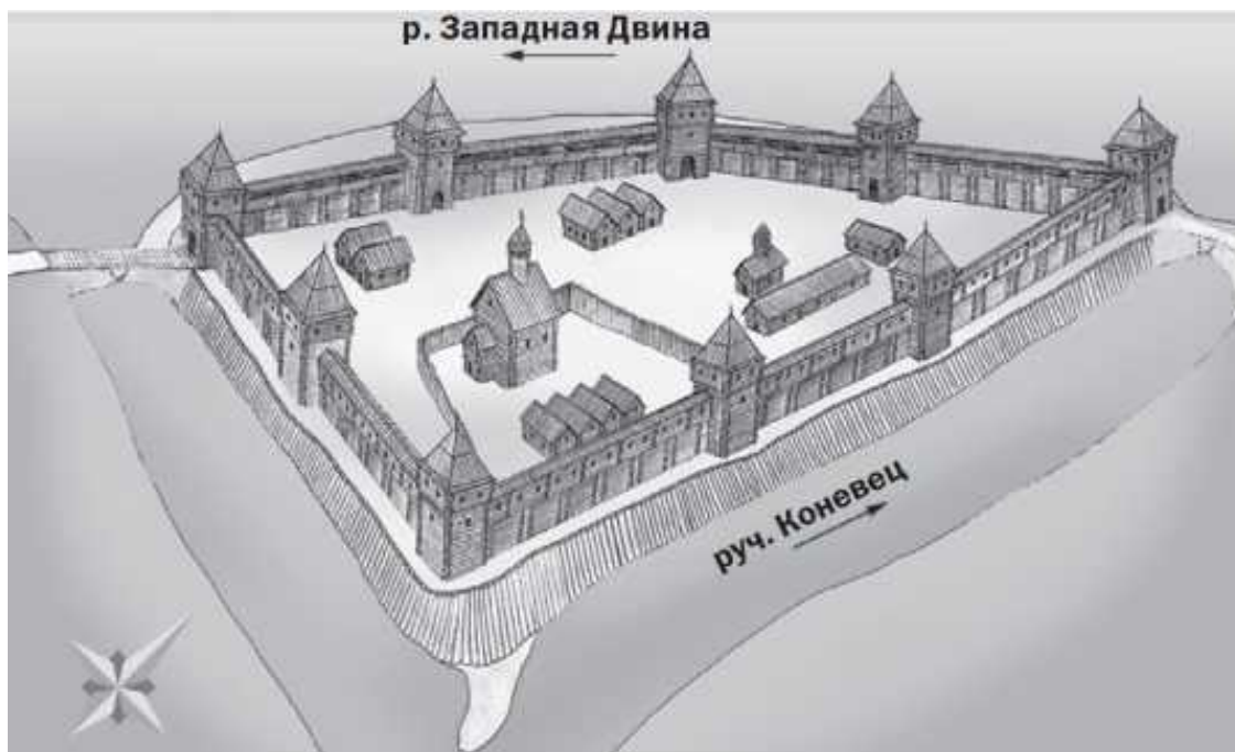
Крепость Велиж в XVI в. Реконструкция автора