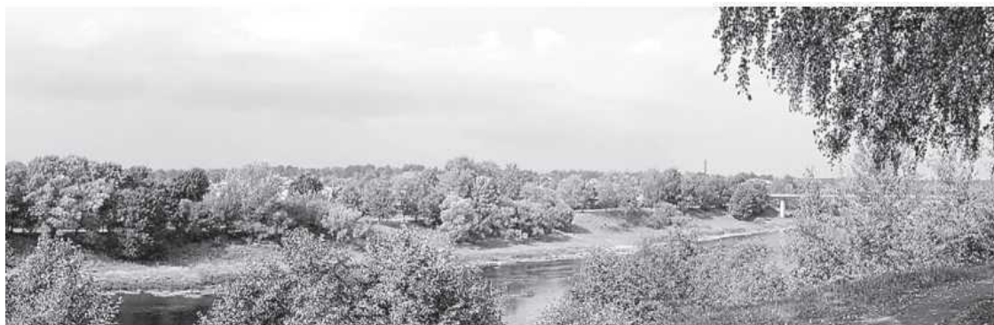
Вид на Западную Двину с Лидовой горы

В большой, светлой, самой полноводной на Смоленщине р. Западная Двина. Замечено, что именно реки придают особое очарование тому или иному городу.