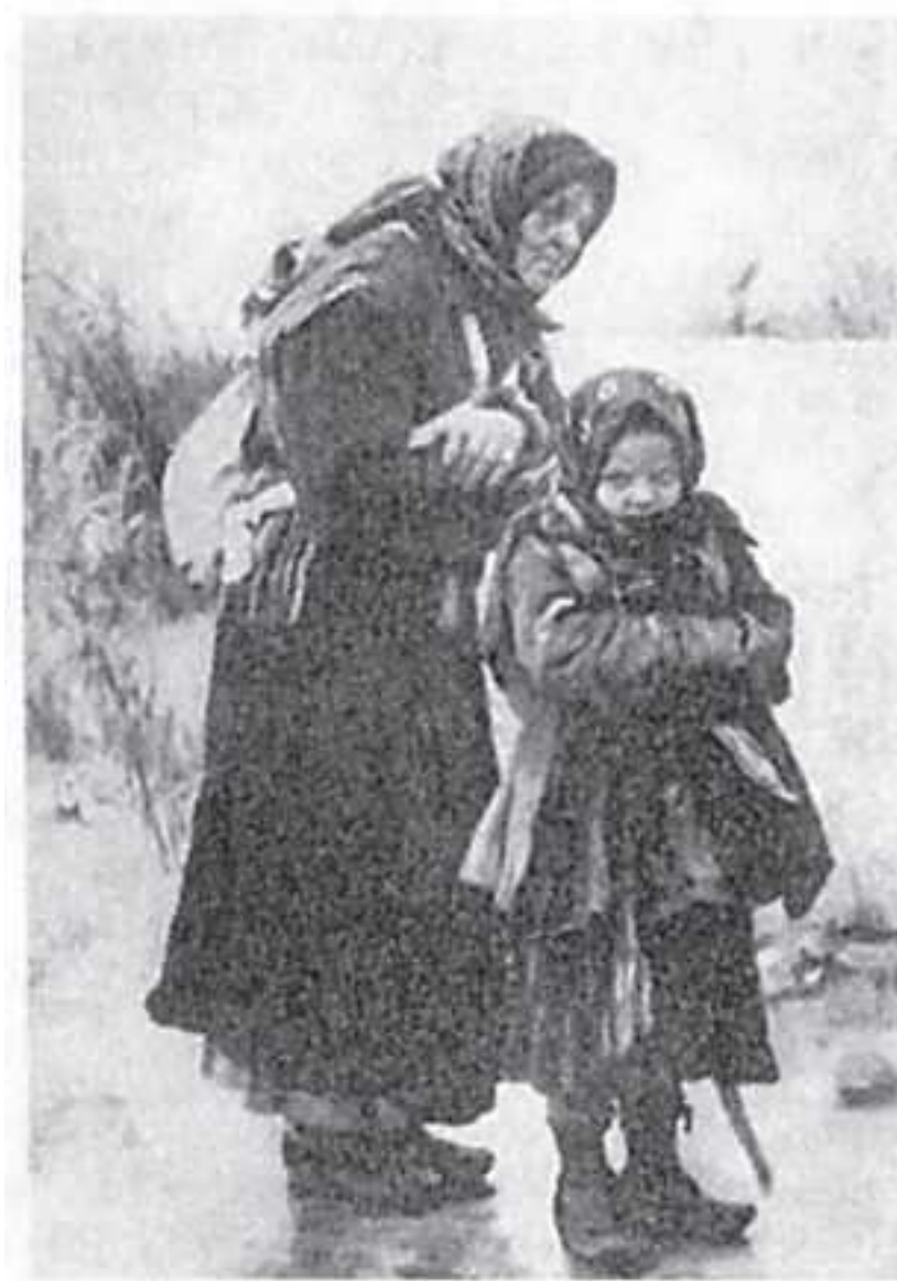
За милостыней. Худ. И.И. Творожников. Ок. 1884 г.

Крестьянин рад бы работать просто из-за хлеба, да работы нет. Побирающийся кусочками и нищий, отмечал учёный, – это два совершенно разных типа просящих милостыню. Нищий – это специалист. Просить милостыню – его ремесло. Он не имеет ни двора, ни хозяйства и странствует с места на место. Всё собранное продаёт, превращая в деньги. Как правило, нищий – это калека, больной или немощный старик, неспособный к работе. Он одет в лохмотья и не стыдится своего занятия.