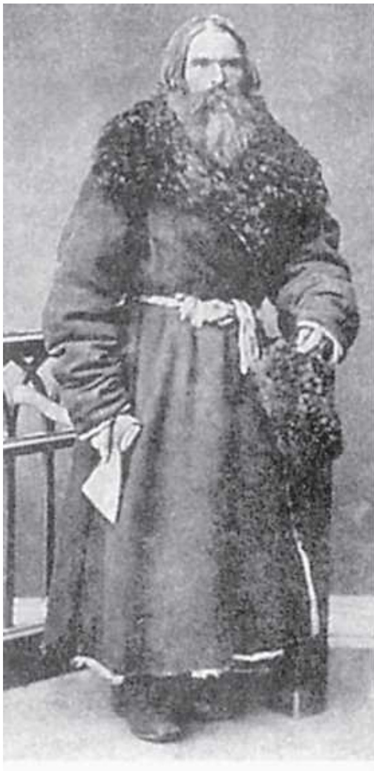
Крестьянин-плотник. Отходничество. Фото 1887 г.