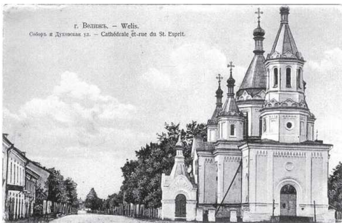
Велиж. Собор и Духовская улица. Фото нач. XX века

В заречной части Велижа имелось четыре церкви, из которых войну пережила единственная в городе ц. Трёх Святителей. В нач. XX в. главные улицы города были выложены камнем, а тротуары – кирпичом. Приезжающие в город на ярмарки (в апреле и в августе) были обязаны везти с собой камни.