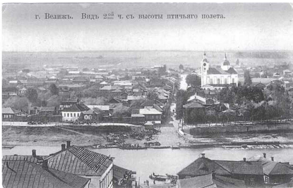
Вид правобережной части города. Фото нач. XX века

В самом Велиже сохранились старые названия правобережья – Малая сторона или Малая Зарека и левобережная Большая сторона или Большая Зарека. Примечательно название Лидова гора. Во время польского владычества это место народного гулянья называлась Людова гора (от польского слова «люд» – «народ»). Постепенно название приняло современную форму.