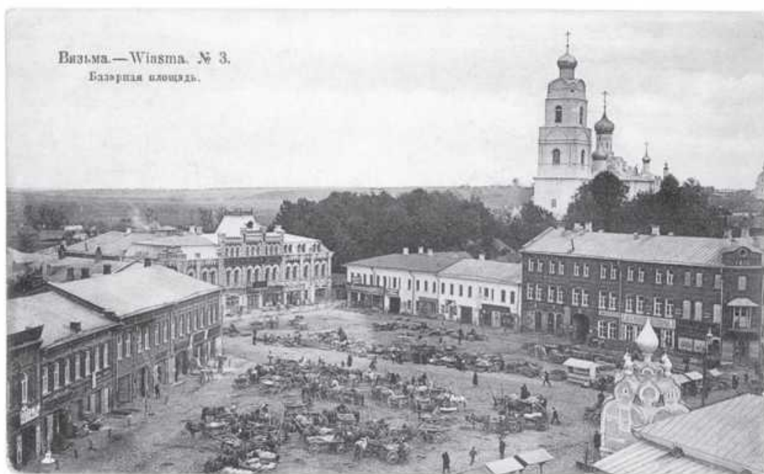
Вязьма. Базарная площадь. Фото нач. XX века

Исследовала! В.Сергина и Соборную гору – детинец древнерусской Вязьмы, который образовался позже – в XII–XIII вв. Это было более обширное и мощное укрепленное поселение. Оно постепенно росло, в то время как жизнь крепостцы на Русятке затухала. Возможно, окончательно это укрепление уничтожили монголо-татары в 1238 г.