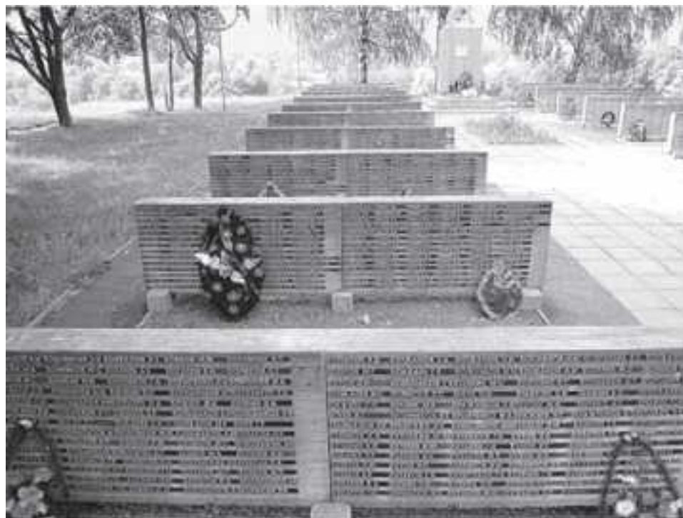
Мемориал на Лидовой горе

29 января 1942 г. фашисты уничтожили ок. 2 тыс. узников гетто. В память заживо сожжённым евреям в городе создан выразительный памятник, который никого не может оставить равнодушным, – изображение человеческой ладони, как бы поднимающейся из огня.