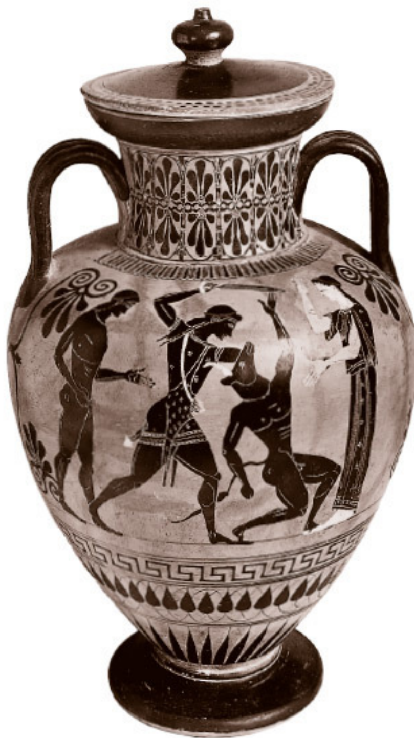
Тесей убивает Минотавра