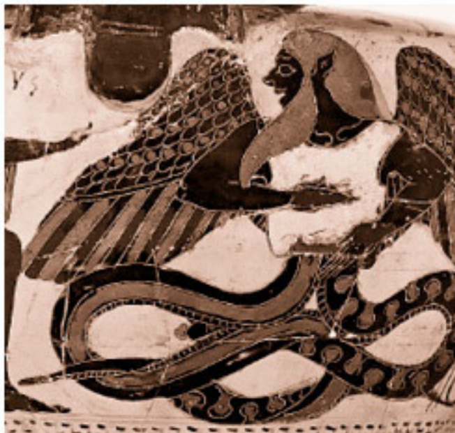
Тифон, пораженный молнией Зевса (деталь)