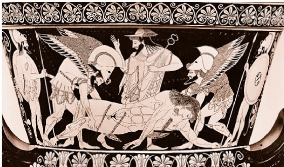
Крылатые Сон и Смерть уносят смертельно раненного героя (аттическая ваза, около 510 года до н. э.)

возрасте предположительно 23 лет. Она привлекла внимание многих художников и других деятелей искусства того времени – ее называли первой красавицей Флоренции. Несмотря на повышенный интерес к себе (и намек автора на внебрачные связи), имела репутацию благопристойной дамы. Есть версия, что многие женские образы в своих картинах Боттичелли писал именно с Симонетты. Подтвердить или опровергнуть это сложно, поскольку точных портретов девушки не сохранилось. Прим. ред.