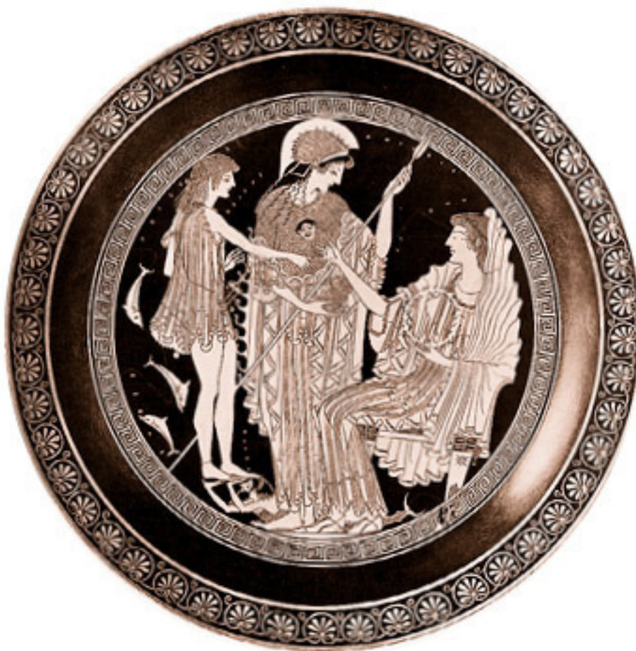
Тесей под водой получает венок от Амфитриты