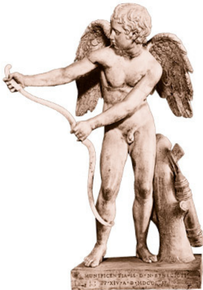
Эрос и его лук