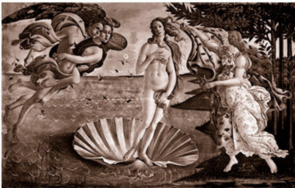
Рождение Афродиты: версия Боттичелли

в Италии ракушка была метафорой как раз для той части тела, которую Венера прячет на этой картине).