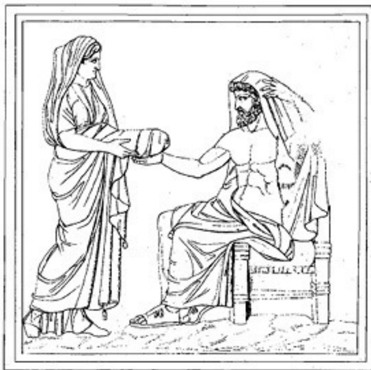
Кронос получает камень вместо Зевса

Однако, пытаясь не повторить участь отца, Кронос все-таки допустил ту же ошибку: он не принял во внимание материнские чувства жены. Как и Гею, Рею привела в ярость судьба ее детей, и, как и Гея, Рея тоже решила вмешаться в происходящее.