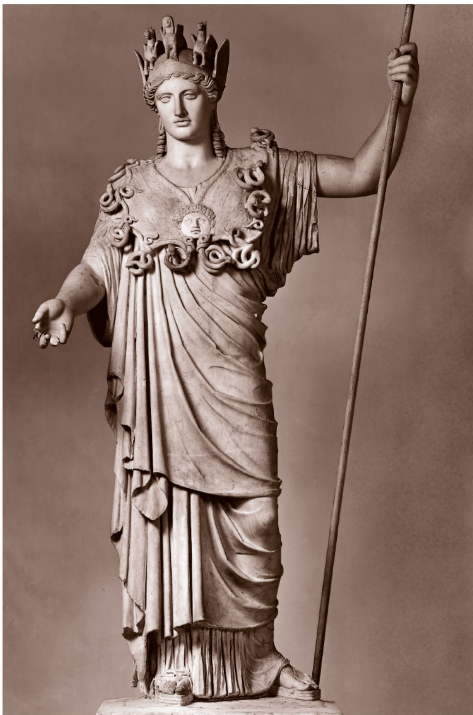
Статуя Афины (римская копия с греческого оригинала)