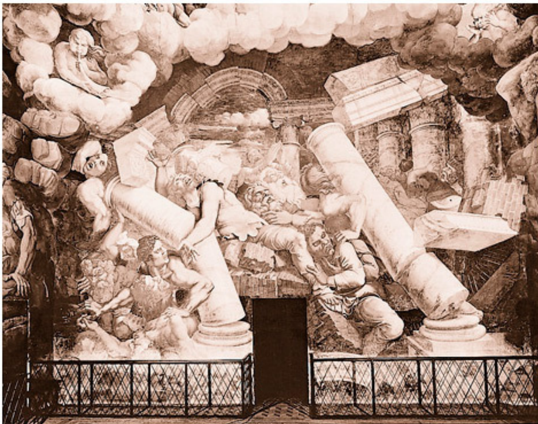
«Война на небесах»: фреска Джулио Романо

Последним и самым страшным соперником, бросившим вызов власти Зевса, стал Тифон – стоголовый, ураганный, дышащий огнем. Тифон был младшим сыном Геи, и ему почти удалось обеспечить силам беспорядка и тьмы победу. Но Зевс поразил Тифона молниями, которые сделали для него циклопы, и сбросил его на землю, под гору Этна на Сицилии. Отсюда Тифон все еще время от времени изрыгает огонь в бессильном гневе 17 .