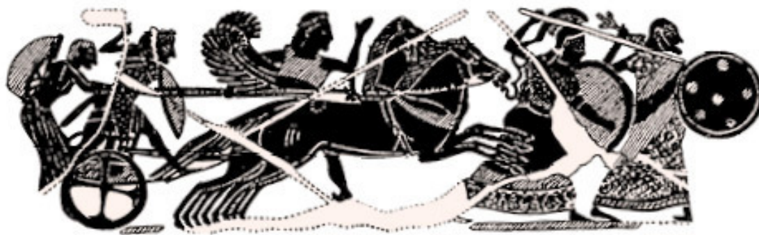
Боги, отправляющиеся на битву с гигантами (с греческой вазы работы Никосфена)