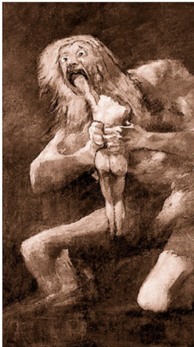
Кошмарное изображение Кроноса у Гойи

Но в конце концов Кронос потерпел поражение, и титанов, сражавшихся на его стороне, заперли в Тартаре.