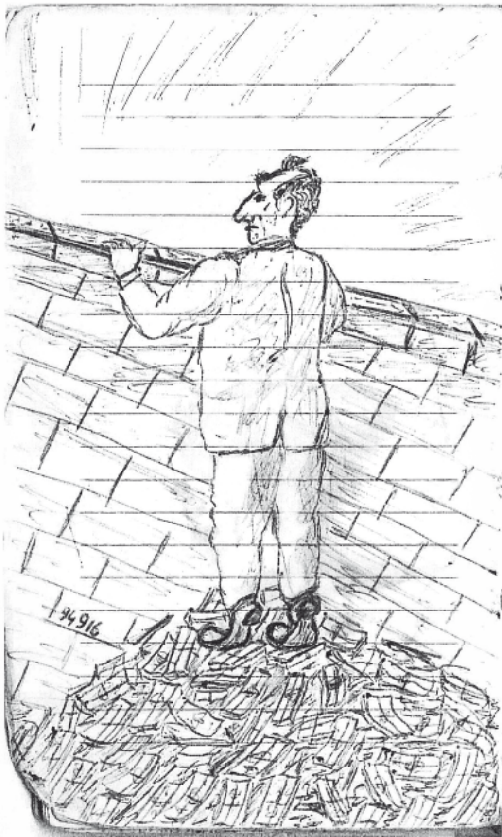
Рисунок автора, 1996 г.