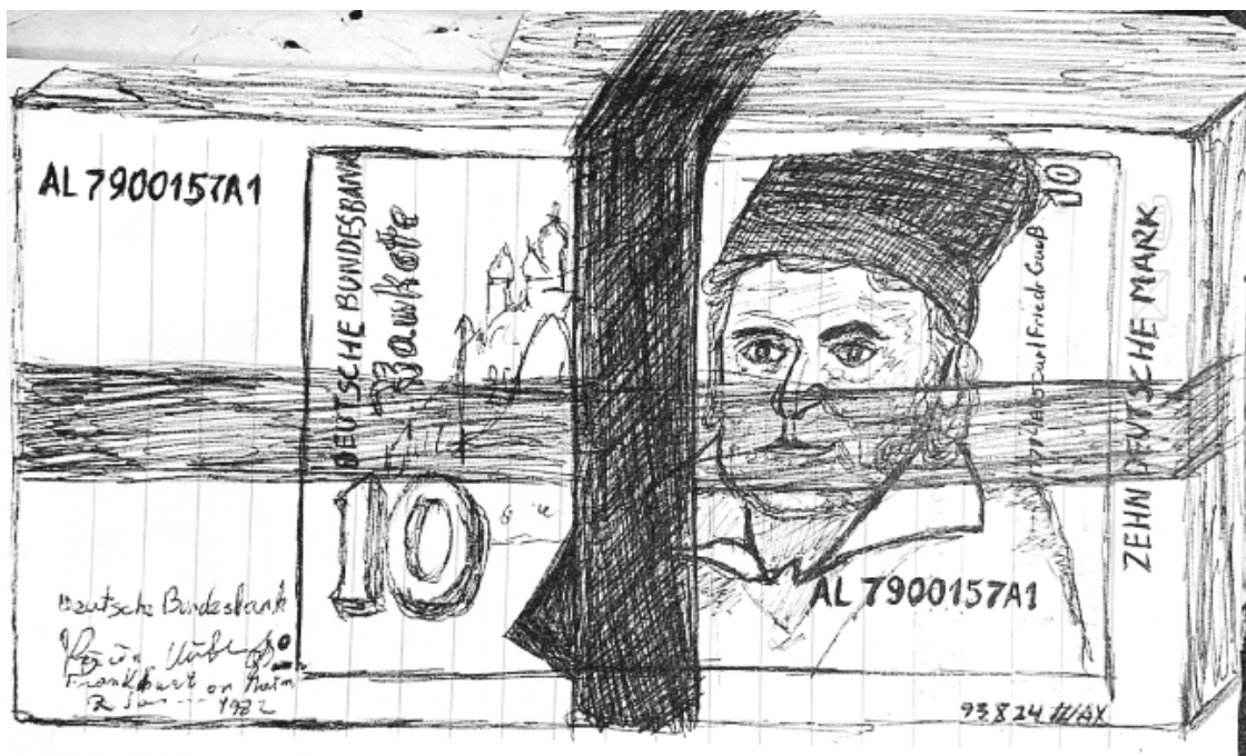
Пачка дойчмарок – воплощение любви студента к деньгам (рисунок автора 1993 г.)