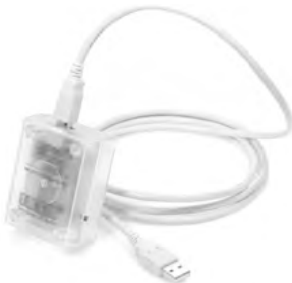
Рис. 1.6. USB-датчик температуры и влажности

□ датчики протечек и утечки газа (рис. 1.7) – для распознавания аварийной ситуации;