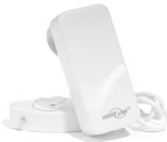
Рис. 1.7. Датчик утечки воды, посылающий беспроводной сигнал

□ датчики протечек и утечки газа (рис. 1.7) – для распознавания аварийной ситуации;