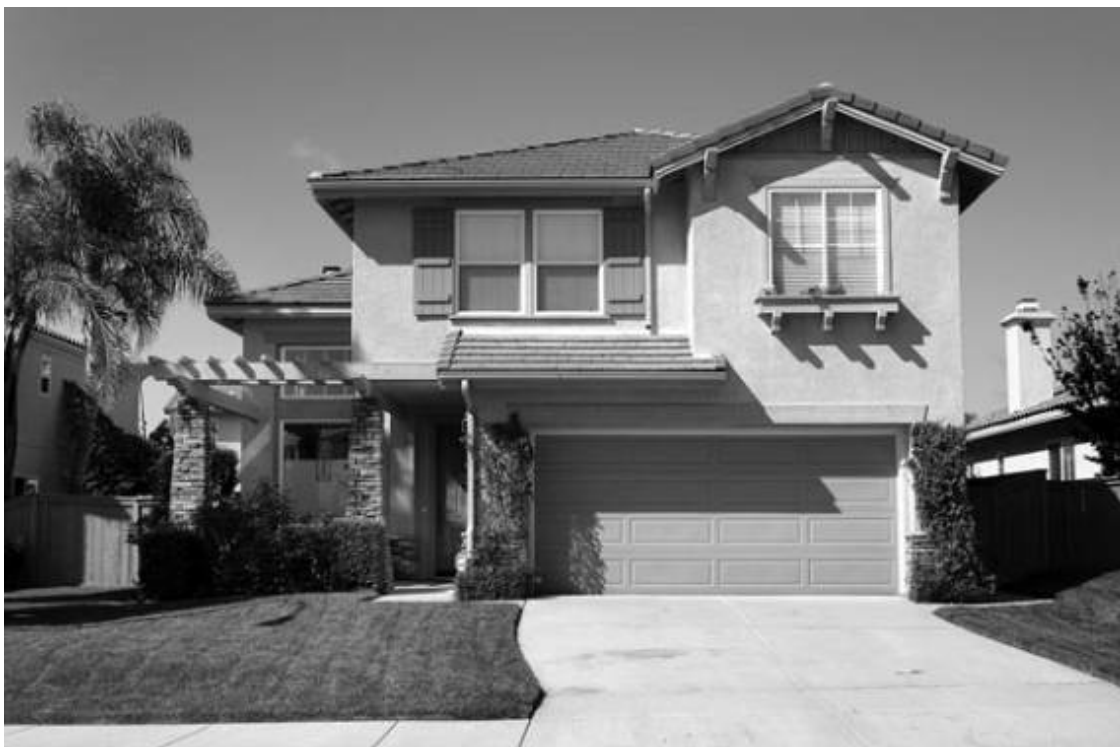
Рис. 2.3. Гараж, расположенный непосредственно под жилыми помещениями