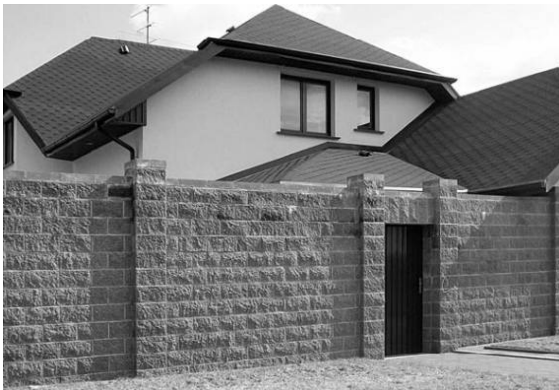
Рис. 2.5. Вход в дом непосредственно с улицы через тамбур

Вне зависимости от того, какое место выбрано для дома, необходимо правильно ориентировать жилые помещения по сторонам света, чтобы соблюсти требования к уровню инсоляции (естественного освещения) и естественной вентиляции.