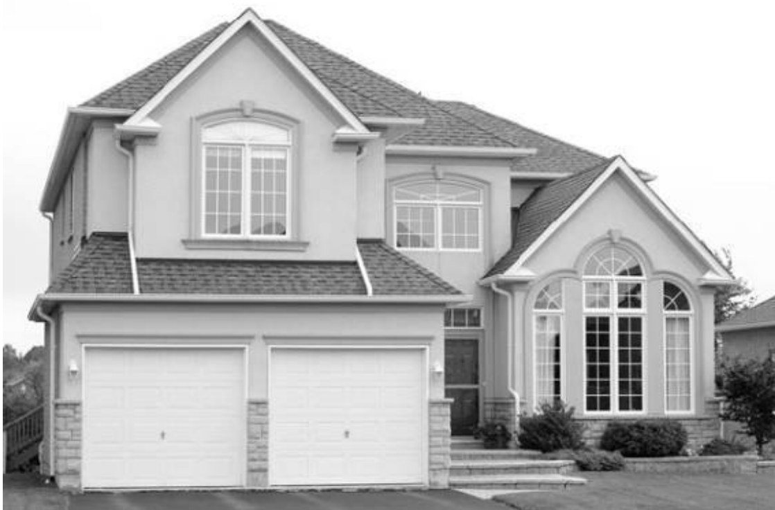
Рис. 2.2. Гараж, примыкающий к дому

Однако если нет возможности расположить гараж отдельно от дома, то приходится прибегать к совмещению (рис. 2.2–2.4). При этом важно помнить об устройстве хорошей вентиляции.