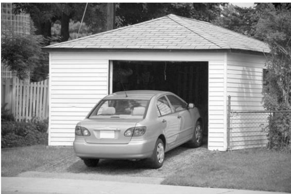
Рис. 2.4. Гараж, стоящий отдельно от дома

Сторонники компактного строительства обычно заявляют, что главный плюс «совмещенного» дома – снижение затрат на отопление: мол, гораздо дешевле отапливать всего один дом вместо нескольких построек. Но практика показывает, что затраты на отопление в обоих случаях различаются незначительно.