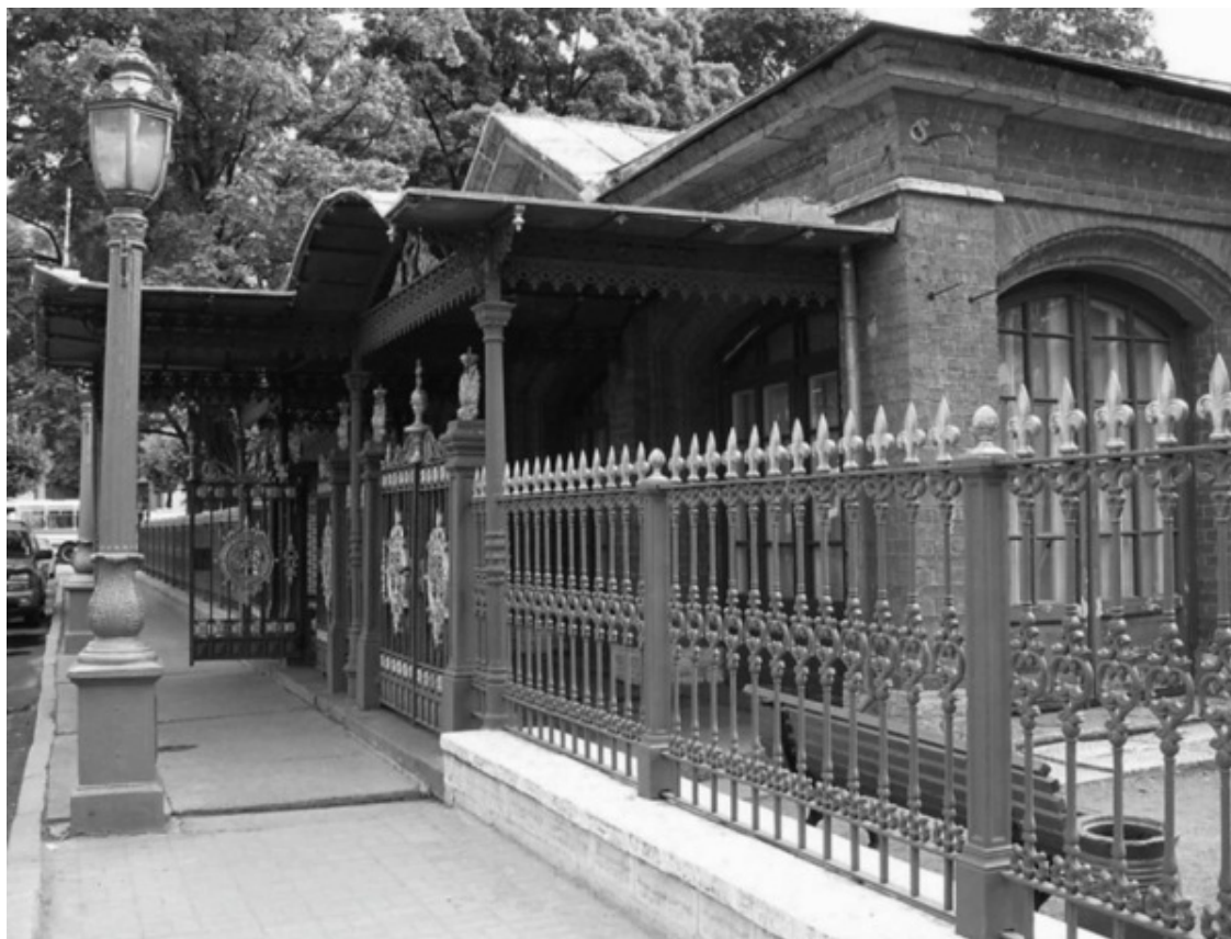
Домик Петра I

В 1703 году здесь был организован первый морской порт Петербурга, позже перенесённый на стрелку Васильевского острова. Но даже после перенесения порта здесь располагалась Фрегатская гавань.