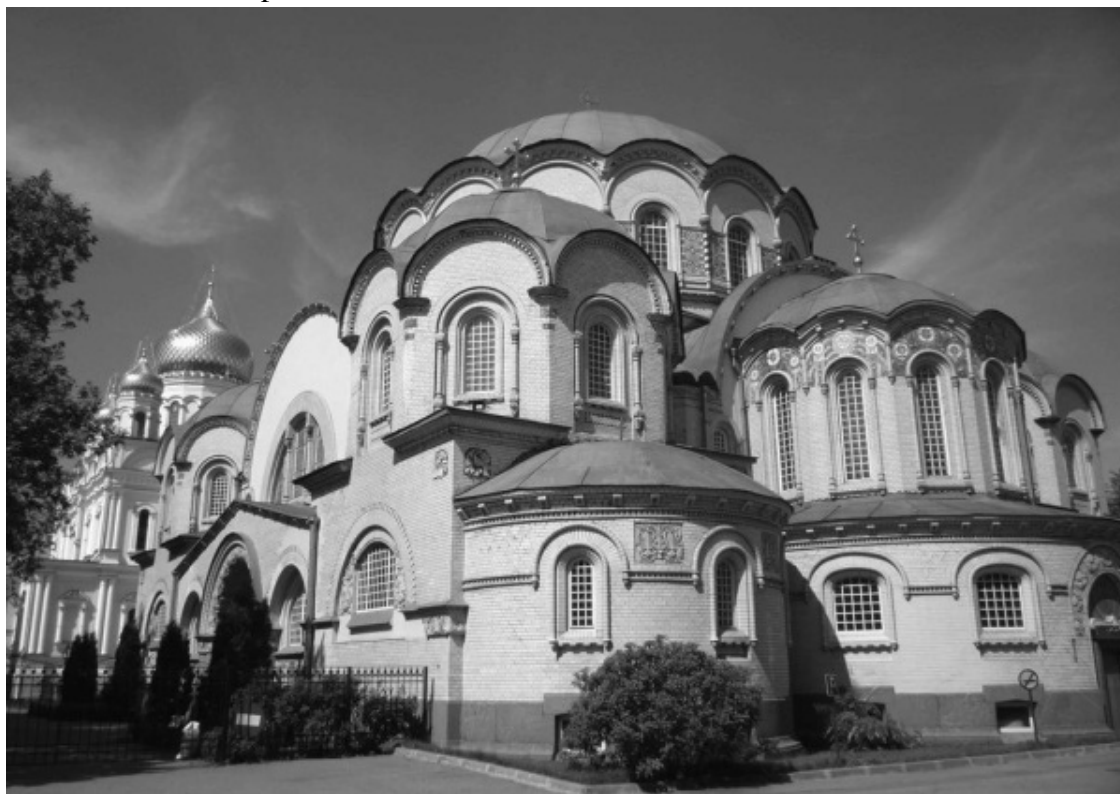
Воскресенский Новодевичий монастырь

Московский проспект протянулся от Сенной площади до Площади Победы. Его длина более десяти километров. У этой магистрали за годы существования было много наименований: Саарская перспектива, Царскосельская дорога, Московское шоссе, Обуховская улица, Обуховский проспект, Забалканский проспект, Международный проспект, Проспект имени Сталина, Московский проспект.