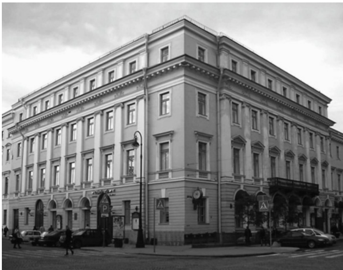
Филармония. Современное фото

Михайловская площадь (ныне площадь Искусств) – это целостный архитектурный комплекс. Три акцента умело расставлены в этом ансамбле Карлом Ивановичем Росси, одним из лучших мастеров того времени: Михайловский дворец (сегодня Государственный Русский музей), площадь со сквером и домами по периметру, Михайловская улица, соединяющая Невский и площадь. Одним из таких домов по периметру, на углу площади и Михайловской улицы, и является здание бывшего Дворянского собрания. Сдержанный, скромный и простой фасад выполнен в ионическом ордере. Внутреннее убранство филармонии куда богаче, чем экстерьерная отделка.