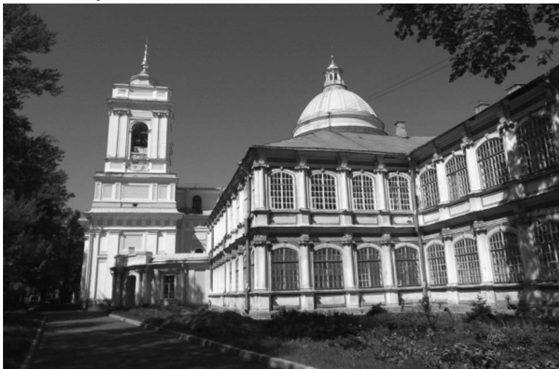
Ансамбль Александро-Невской лавры

25 марта 1713 года в присутствии императора была освящена деревянная церковь во имя Благовещения Пресвятой Богородицы и состоялась закладка братских деревянных келий. Архитектором монастыря был назначен Доменико Трезини. Рассмотрев проект в 1715 году, Пётр I одобрил его, начертав: «Во имя Господне делать по сему». Строительство монастыря продолжалось на протяжении почти всего XVIII столетия.