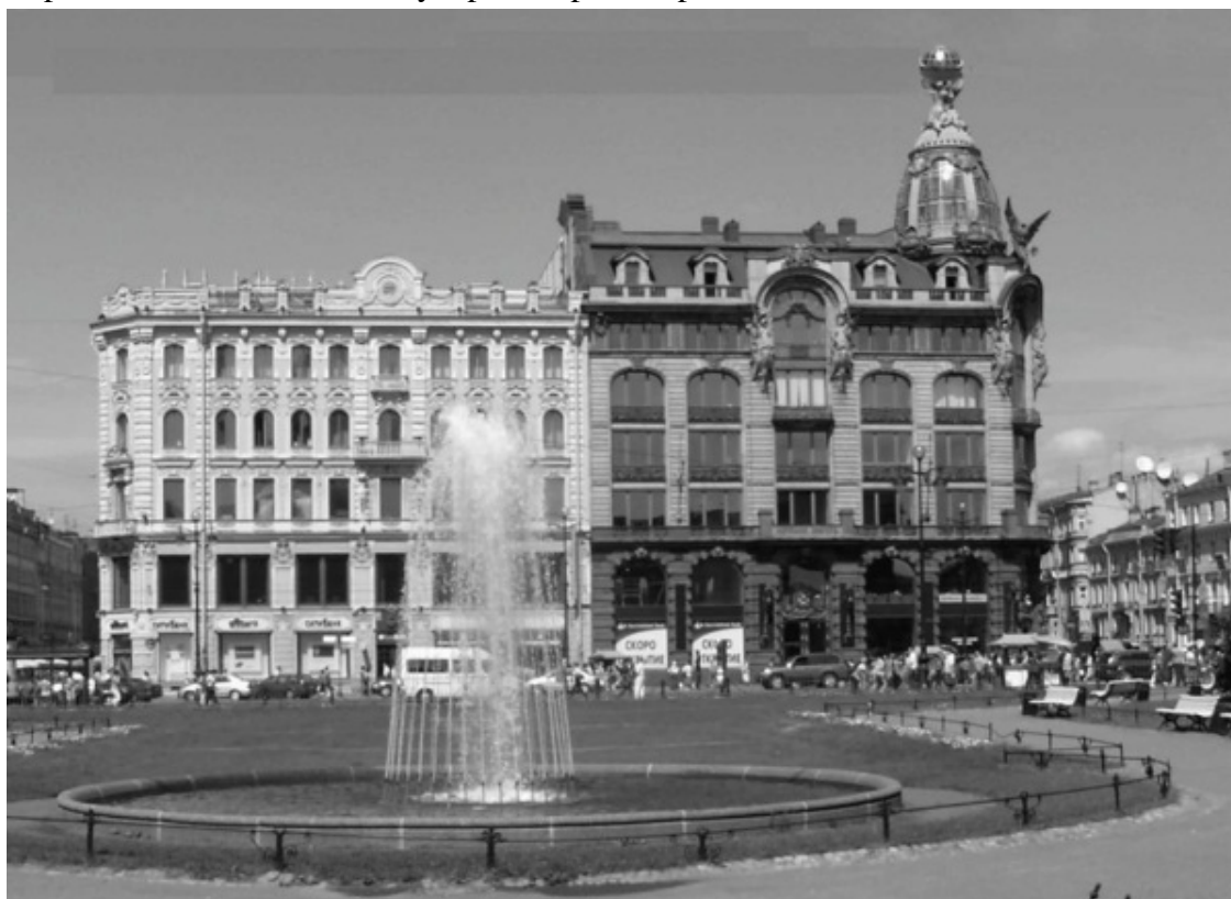
Дом книги (Зингер)

Интересно, что место на углу Екатерининского канала (ныне канала Грибоедова) и Невского проспекта было всегда популярным среди горожан.