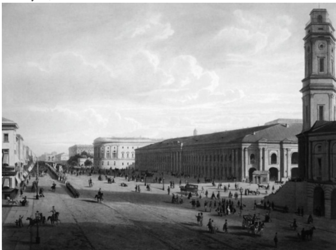
Невский проспект. Гостиный Двор. 1850-е гг.

К Невскому проспекту подходят 27 переулков, улиц и проспектов, но только четыре из них пересекают трассу. Это Большая Морская улица, Садовая улица, Лиговский проспект и Полтавская улица.