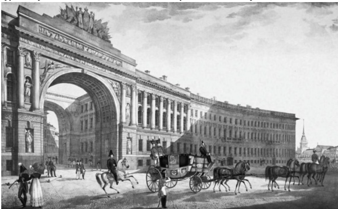
Арка Главного штаба. XIX в.

Существующий ныне Зимний дворец строился с 1754 по 1762 год по проекту Варфоломея Варфоломеевича Растрелли. Он же составил первые планы организации примыкающей к нему площади. В одном варианте архитектор предполагал оградить её от Адмиралтейского луга монументальной решёткой с тремя воротами. В другом проекте Растрелли предполагал создать круглую площадь, а в центре установить памятник Петру I. По периметру площади предполагалось разместить галереи. В следующем плане на круглой площади размещалась лишь колоннада. А в последнем варианте 1762 года здесь планировался лишь памятник Петру I, вокруг которого должна была быть возведена художественная ограда.