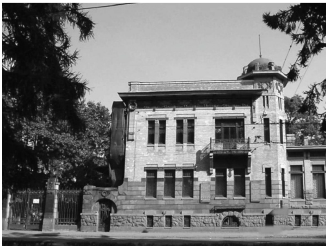
Особняк Матильды Кшесинской

Участок, где балерина решила построить себе новый дом, располагался на углу Кронверкского проспекта и Большой Дворянской улицы. Большая Дворянская улица отделяла участок от Троицкой площади. Троицкая площадь – первая площадь города. В центре площади стояла церковь в честь Святой Троицы. Долгое время Свято-Троицкий собор был главным кафедральным храмом города, здесь объявлялись царские указы. Здесь 22 октября 1721 года Петру I был пожалован титул императора. На шпиле колокольни собора были укреплены часы, снятые с Сухаревской башни Кремля в Москве. К 1730-м годам площадь потеряла своё значение, порт и административный центр переместились на Васильевский остров.