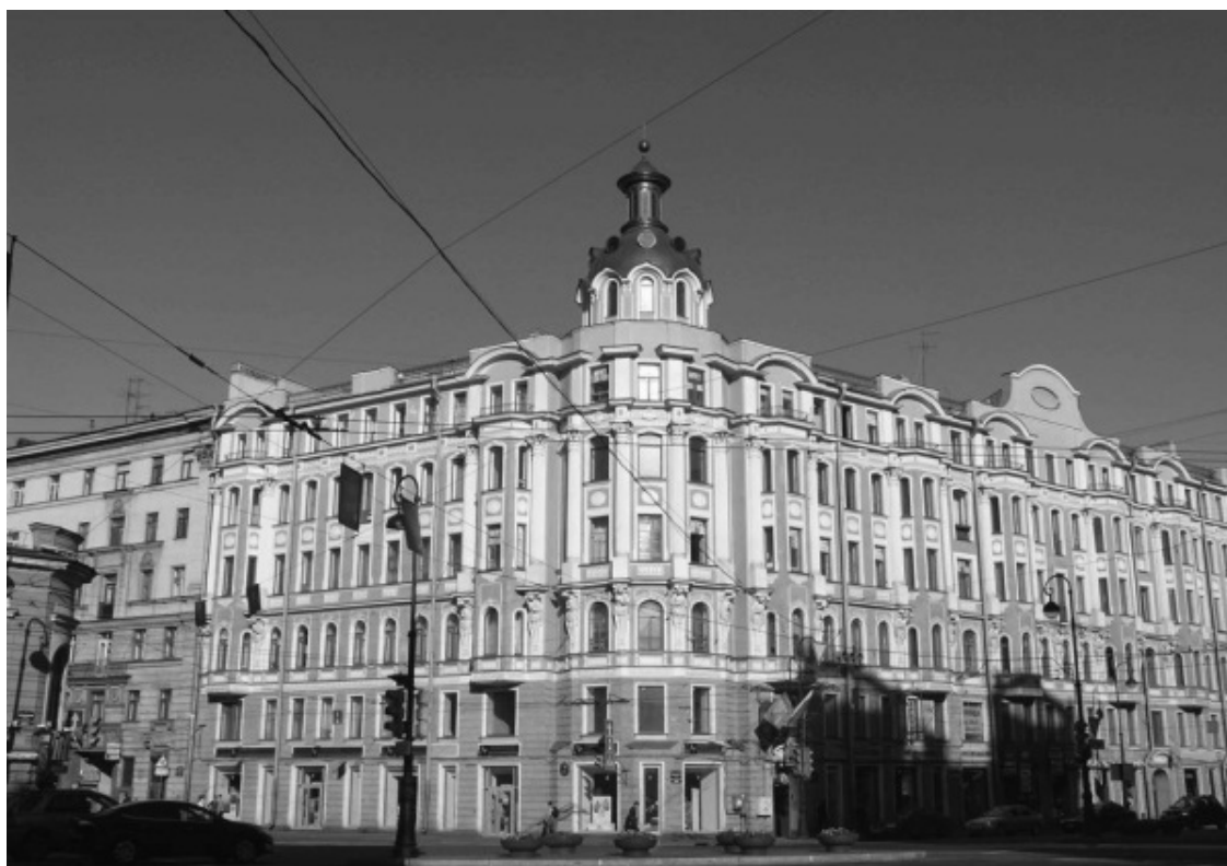
На Каменноостровском проспекте

Архитектурный облик проспекта отличается внутренним единством и в то же время живописным разнообразием. Он воспринимается как целостный ансамбль со своим особым ритмическим строем и неповторимым силуэтом. Главную роль в его пространственной композиции играют угловые башни зданий, увенчанные куполами и шпилями. Видимые издалека, они словно перекликаются друг с другом в перспективе магистрали.