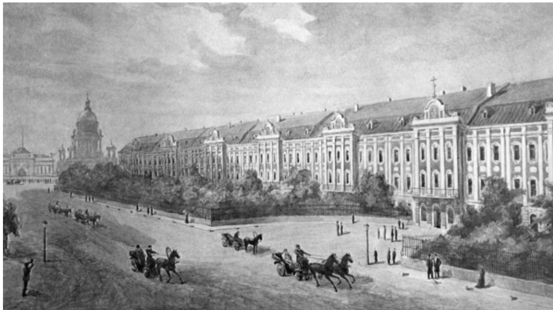
Университет. XIX в.

Кстати, это единственное здание, которое обращено к Университетской набережной торцом и вытянуто вдоль Менделеевской линии. Существует легенда, что изначально его планировалось построить вдоль набережной, как и большинство других зданий того времени. Но вышло так, что руководить строительством было поручено Александру Меншикову. Пётр I же неосторожно пообещал своему ближайшему сподвижнику, что на участке земли, который останется между готовым зданием и 1-й линией, тот сможет построить свой собственный особняк. Тогда-то Меншиков и распорядился, чтобы здание Двенадцати коллегий выходило на набережную своей самой узкой стеной, чтобы между ним и 1-й линией осталось как можно больше места. Когда строительство было завершено, Пётр I приехал на Васильевский остров принимать работу своего фаворита. Возмущению его не было предела. Меншиков оправдывался, уверяя Петра, что он «неправильно понял» его распоряжения, но от праведного царского гнева это его не спасло. Говорят, что Пётр I прогнал любимчика по всем коридорам и лестницам здания, ударяя его по спине своей тростью. Правда, построить на Васильевском острове дворец он Меншикову все-таки разрешил, но места для этого выделил гораздо меньше, чем тот пытался заполнить.