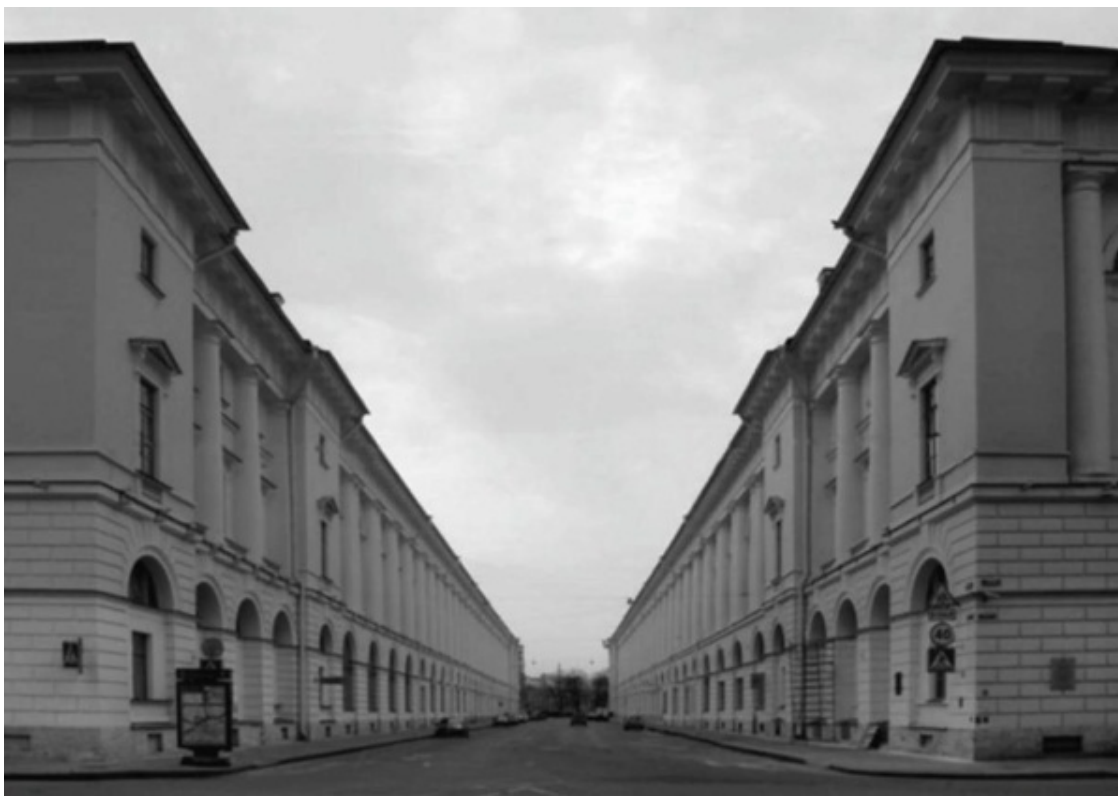
Улица Зодчего Росси со стороны Александринского театра

Разработка проекта оформления вновь созданной городской площади (площади Островского) возобновилась в конце 1820-х годов.