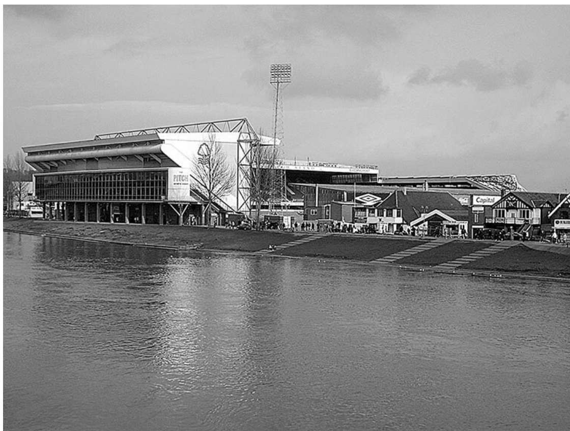
Стадион «Сити Граунд» – домашняя арена «Ноттингем Форест»