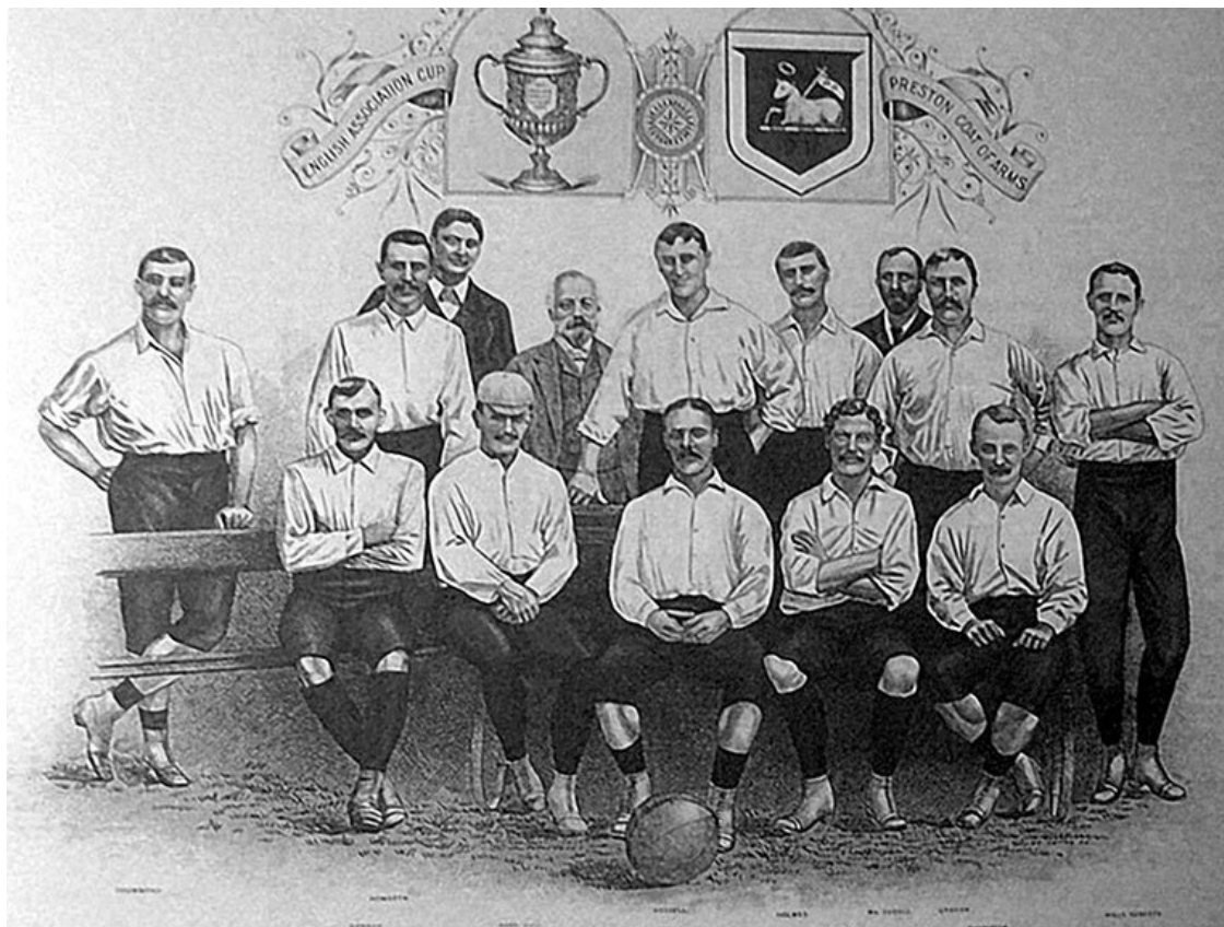
Команда «Престон Норт Энд» на открытке конца XIX в.

Однако футбол уже превращался в доходное предприятие. Зрители стали платить за билеты на матч, и чем интереснее матч, тем больше был сбор. Интерес же к матчу подогревался именно участием в нем первоклассных игроков. Неудивительно, что хозяева многих клубов смотрели на запрет Футбольной ассоциации сквозь пальцы и действительно платили футболистам за игру.