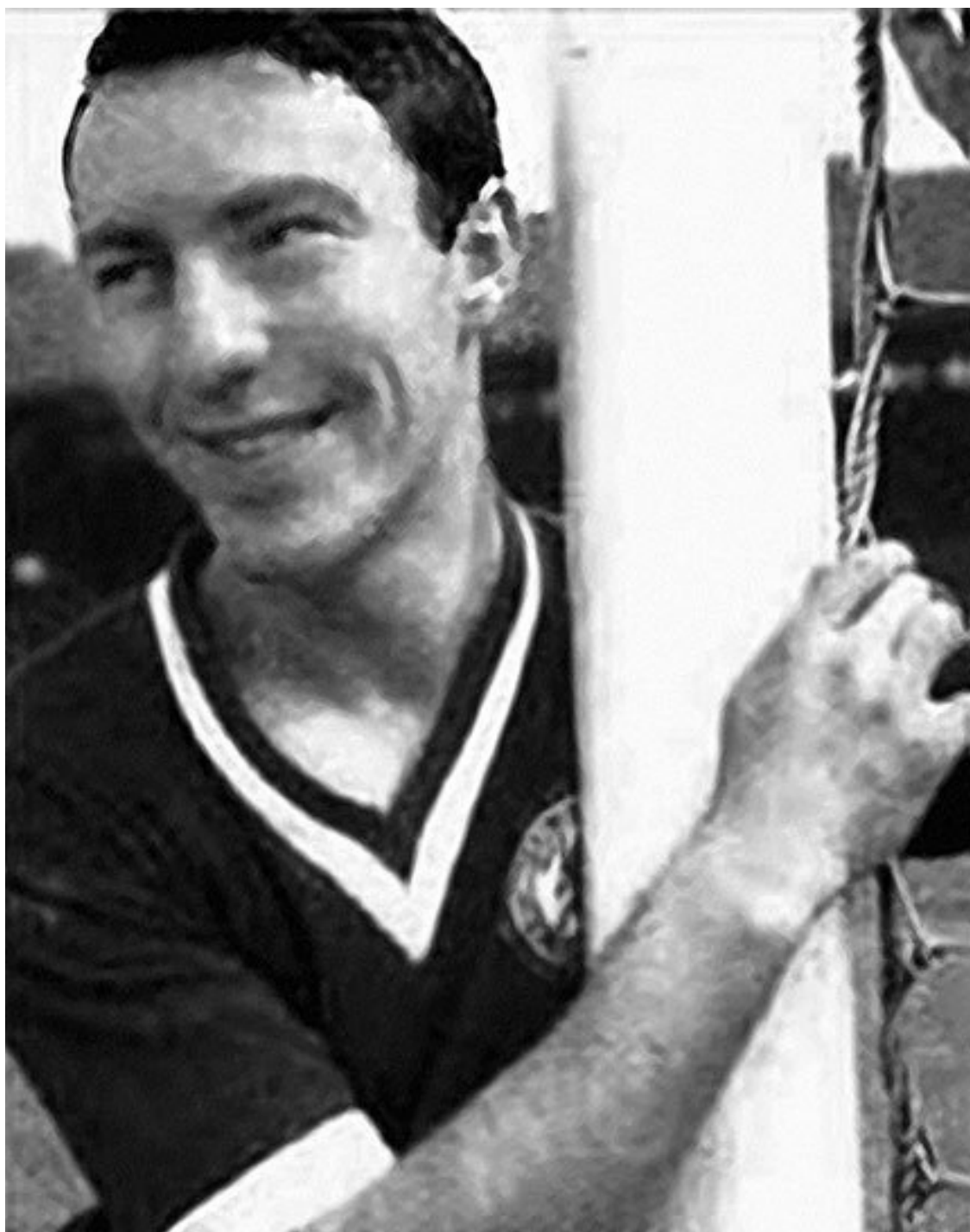
Джимми Гривз играл за «Тоттенхэм Хотспур» 7 сезонов

История основания этого клуба сходна с историей «Астон Виллы» и «Эвертона» – «Тоттенхэм Хотспур» тоже был основан игроками в крикет, на этот раз учениками одной из лондонских школ. Это случилось в 1882 году, но первый успех пришел только в 1900 году – «Тоттенхэм» выиграл Кубок южной лиги, как тогда назывался один из низших дивизионов. А в следующем году «Тоттенхэм Хотспур» дошел до финала Кубка Футбольной ассоциации, где ему противостоял «Шеффилд Юнайтед», уже завоевывавший этот трофей двумя годами раньше и успевший также побывать чемпионом Англии. Новичок «Тоттенхэм» оказался дерзким. Первый финальный матч потребовал дополнительного времени, но все равно завершился