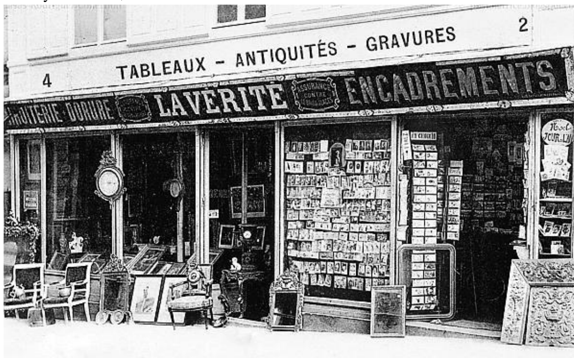
Улица французской столицы. Конец XIX – начало XX века

пособие». Но повезло ли мальчишкам? – Нам уже не узнать точно. Чаще всего приемыши становились дармовой рабочей силой и жили впроголодь, деля кров с домашними животными. То ли сбегая от тяжелой жизни, то ли в силу наследственности и воспитания (или отсутствия его как такового) мальчики сделались ярмарочными торговцами. В общем, пошли по стопам своего непутевого отца.