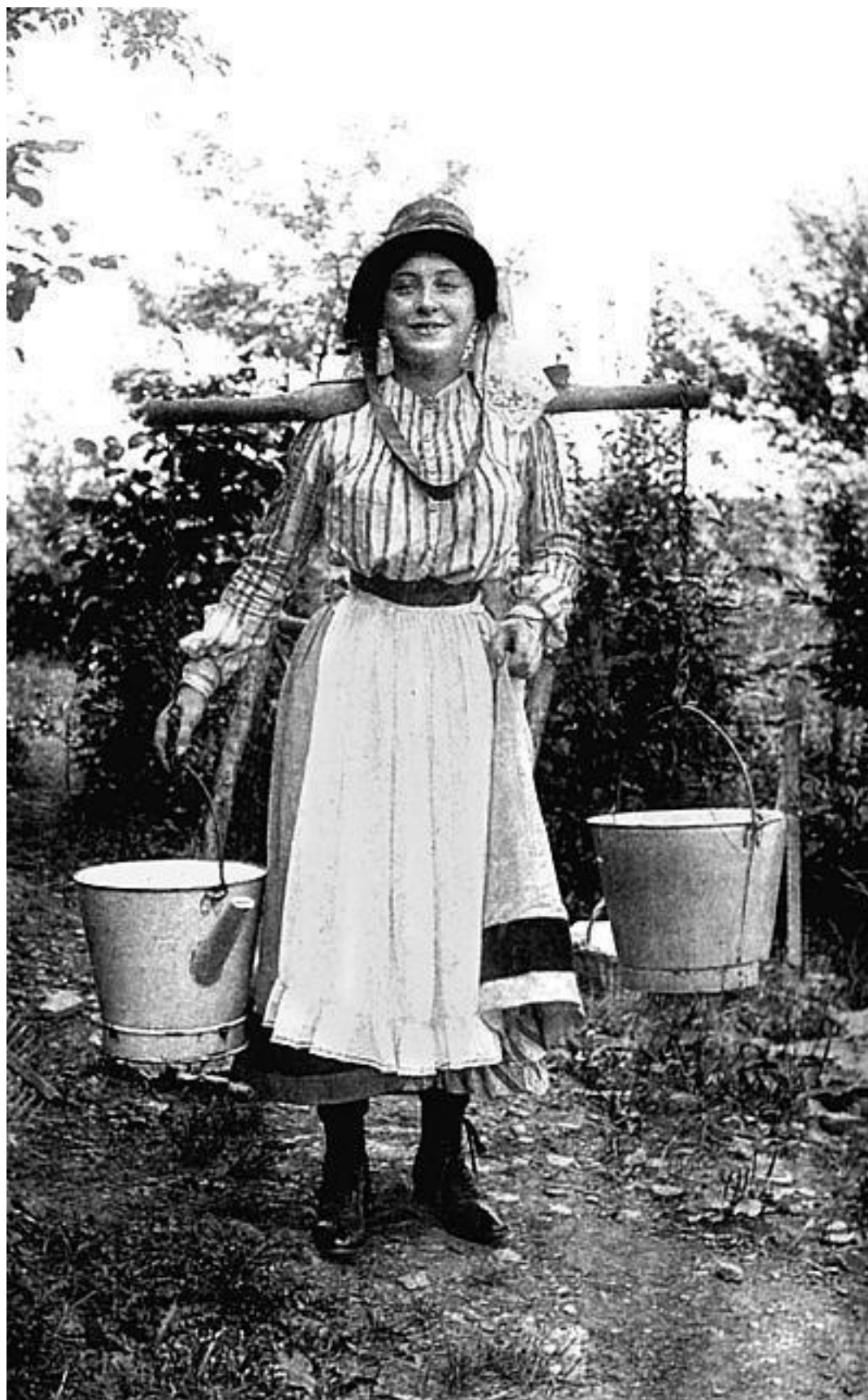
Француженка, идущая утром на рынок. Фото начала XX века

Во времена жительства там семьи Шанель городок Исуар являл собой некий шумливый базар и легко вселял надежду, что здесь дела могут пойти на лад. Даже несмотря на то, что