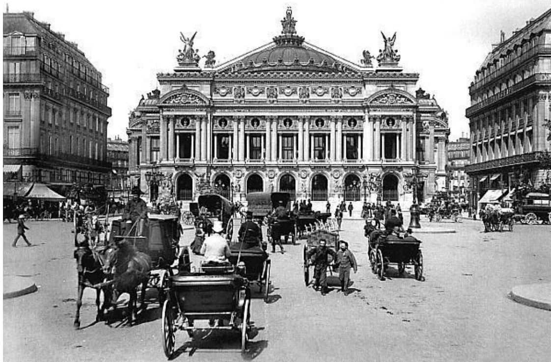
Париж времен детства и юности Габриэль Бонер Шанель. Конец XIX – начала XX века