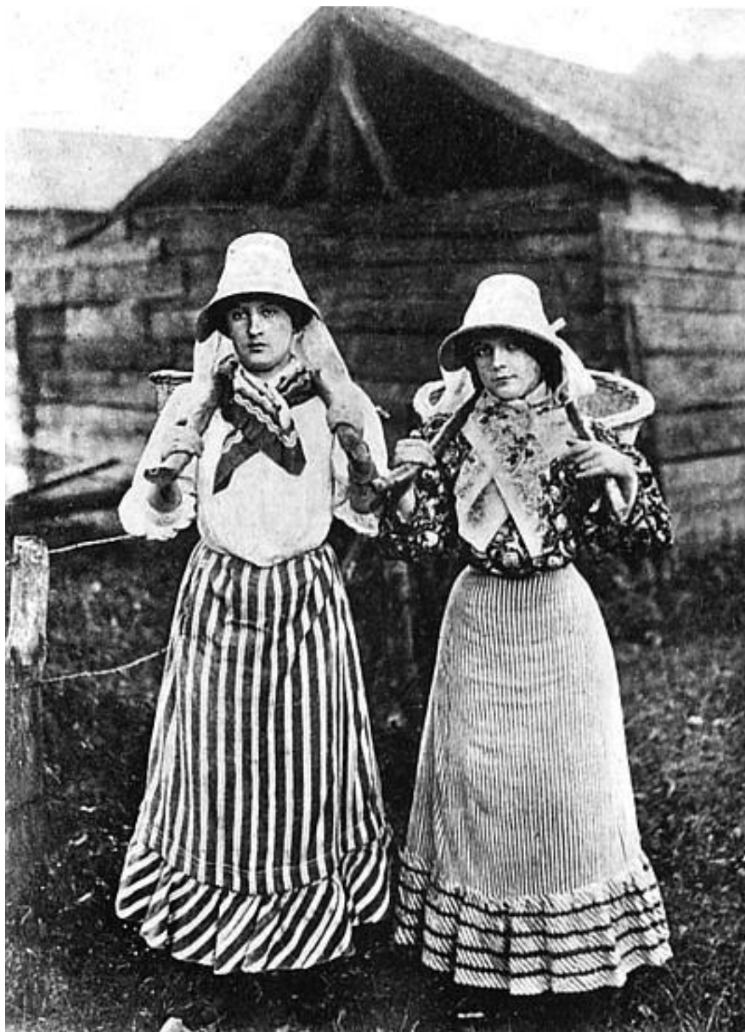
Француженки, идущие на рынок. Фото начала XX века

Впоследствии сия тетушка (которая не намного старше) станет лучшей подружкой Габриэль Шанель.