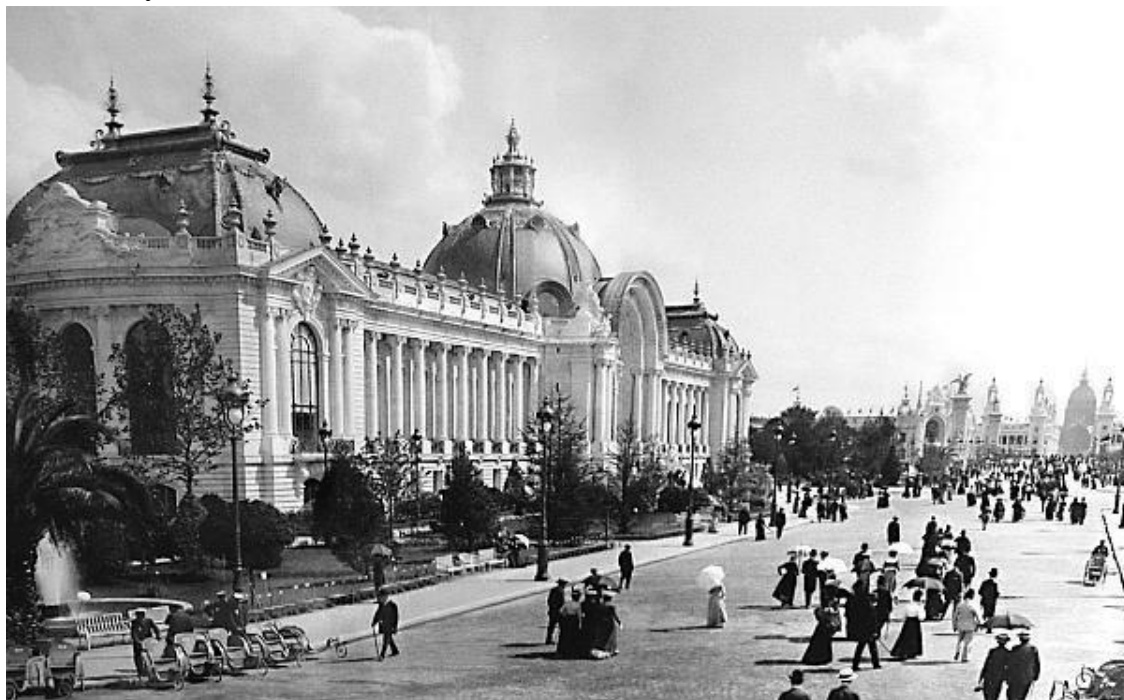
Париж времен детства и юности Габриэль Бонер Шанель. Конец XIX – начала XX века