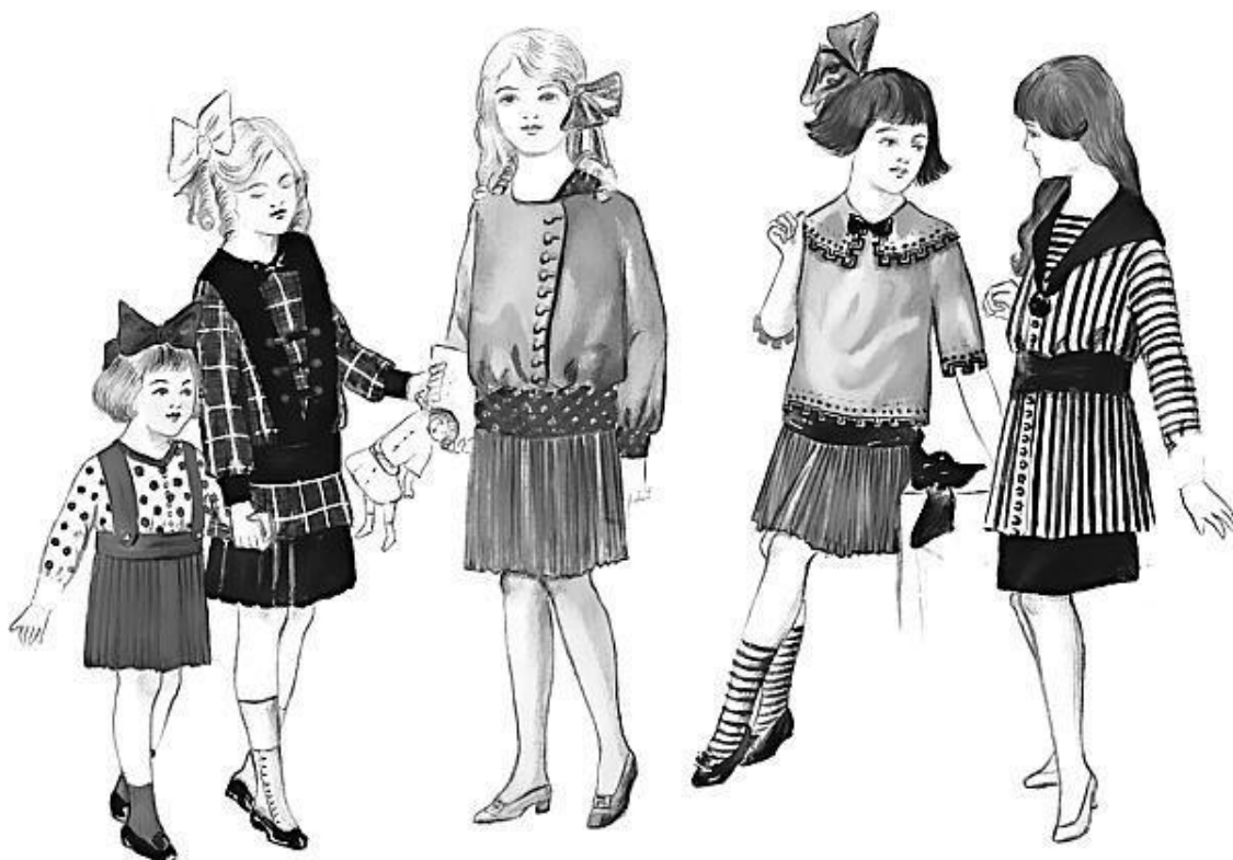
Мода для детей и девочек-подростков начала XX века. Рисунок из модного журнала