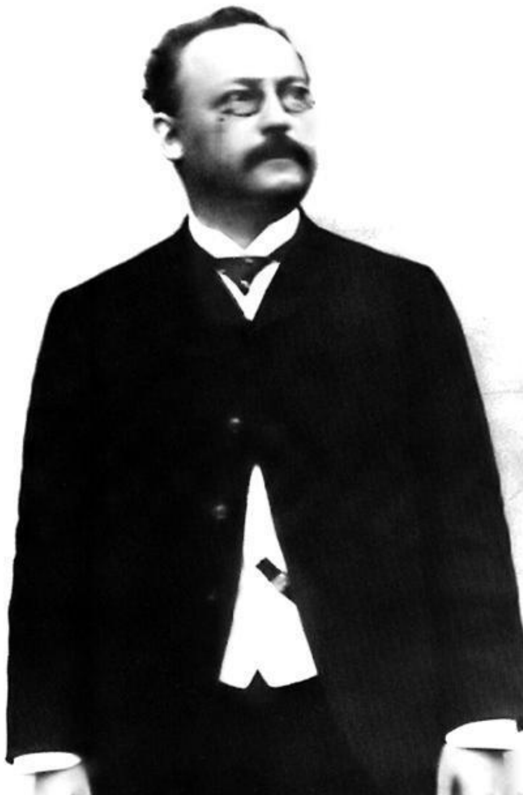
Отец Альберта – Герман Эйнштейн (1847 – 1902)

Достойна только та жизнь, которая прожита ради других людей