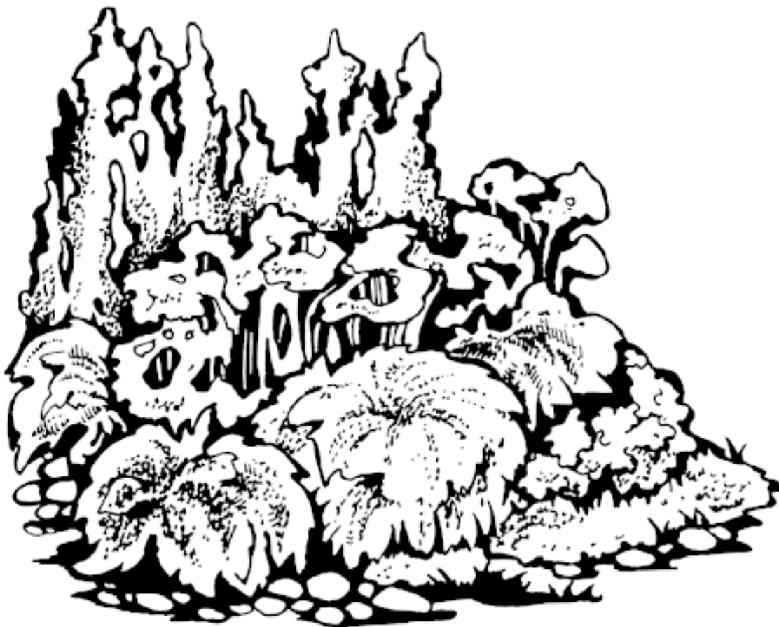
Рисунок 6. Расположение растений в цветнике по высоте

Низкорослые растения располагают на переднем плане (рис. 6). В этом случае придется создавать вертикальные композиции и может получиться группа растений, миксбордер или солитер.