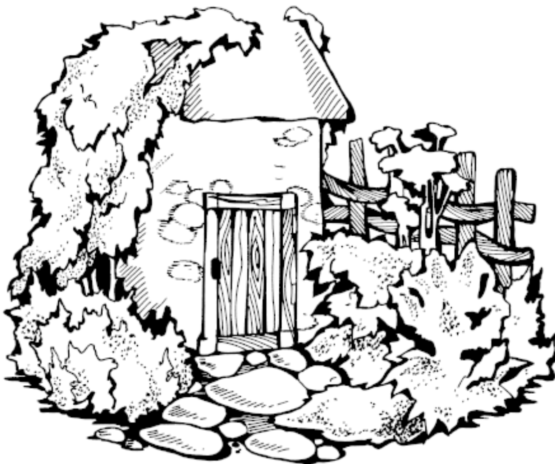
Рисунок 2. Цветник в сельском стиле

Декоративный огород – это огород с грядками строгой геометрической формы, на которых овощи и зелень чередуются с декоративными растениями (рис. 3). Как правило, грядки огорожены бордюрами. Из них может складываться какой-либо узор. Между грядками располагают ровные прямые дорожки, посыпанные гравием. Впервые декоративные огороды появились во Франции.