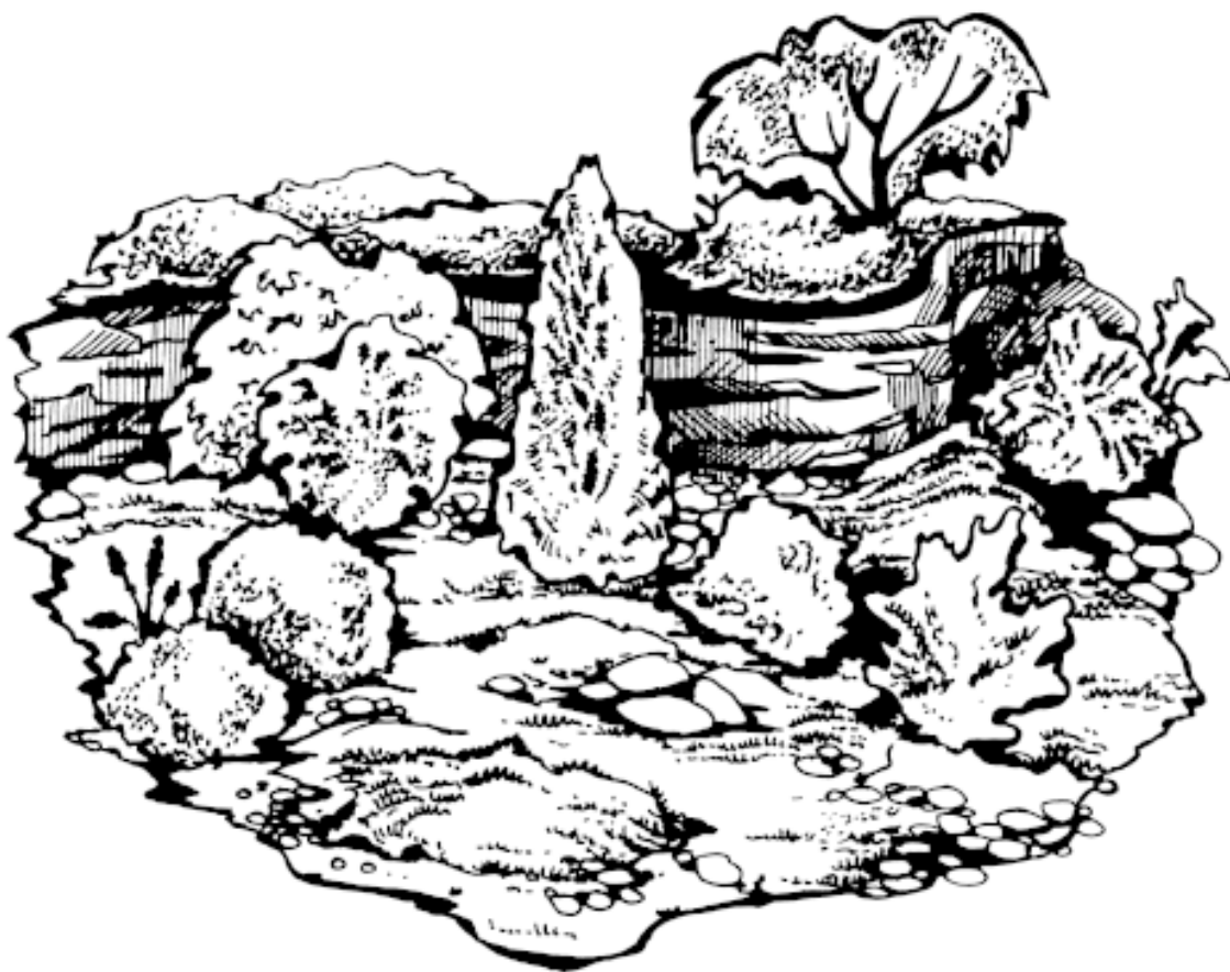
Рисунок 5. Группы растений