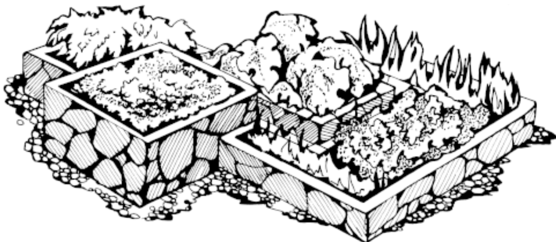
Рисунок 3. Декоративный огород

Декоративный огород – это огород с грядками строгой геометрической формы, на которых овощи и зелень чередуются с декоративными растениями (рис. 3). Как правило, грядки огорожены бордюрами. Из них может складываться какой-либо узор. Между грядками располагают ровные прямые дорожки, посыпанные гравием. Впервые декоративные огороды появились во Франции.