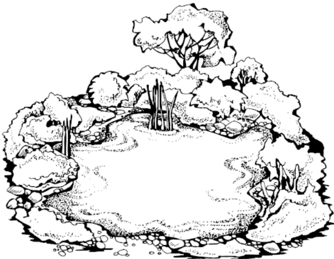
Рисунок 1. Прибрежная композиция

Цветник в сельском (кантри) стиле включает растения, произрастающие в данной местности. Для него характерно естественное расположение растений (рис. 2). Цветники в таком стиле имеют извилистые формы и напоминают сад у дома.