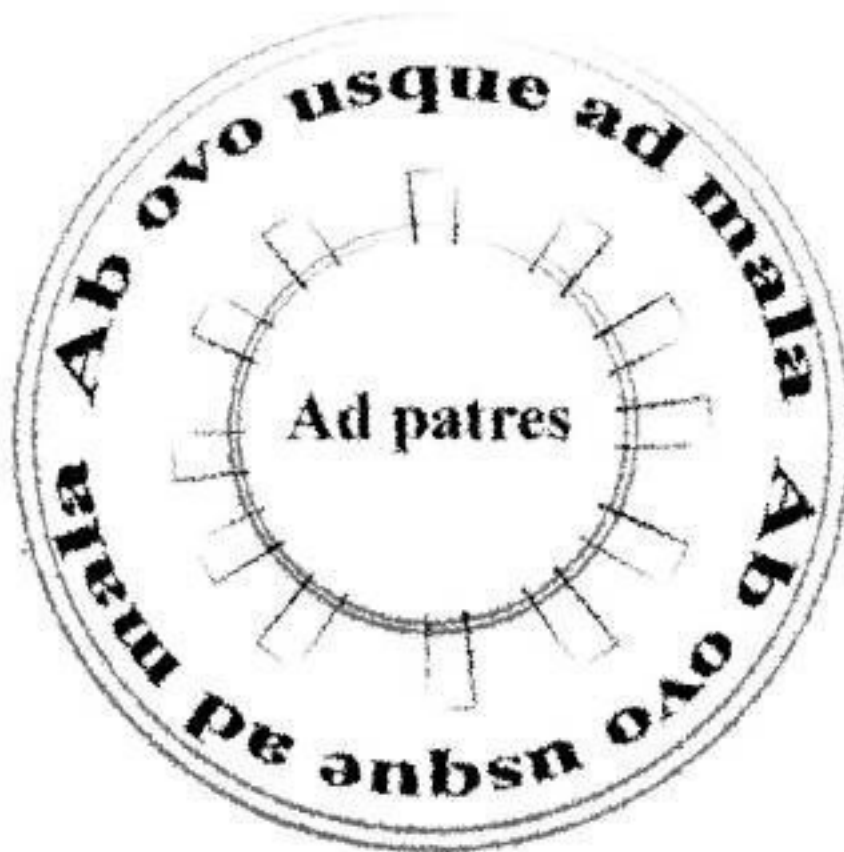
Клеймо Ad patres

Может быть, идея была не очень хорошей, но таблетка из походной аптечки, запитая глотком вина с кофе, подействовала. Пятно перестало чесаться, пока я наслаждался капучино с бисквитом. Затем допил вино, кстати, вполне сохранившее вкус. Этот ужасный с точки зрения врачей и диетологов полдник избавил меня от всех симптомов, начиная с головной боли, заканчивая сужением поля зрения, память также вполне работала.