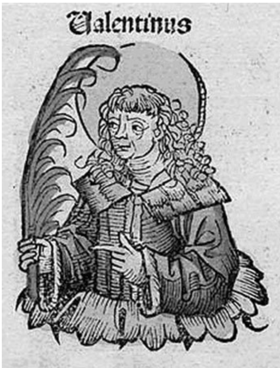
Святой Валентин Римский (средневековая миниатюра).

В житии, рассказанном Дмитрием Ростовским, нет упоминаний о тайных браках, которые устраивал молодой пресвитер – святой Валентин был схвачен солдатами и доставлен императору Клавдию за проповедь христианства.