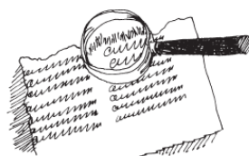
Рис. 2. Ищем волокна

Иногда бумагу метко называют «паутиной слов». На самом же деле бумага – это коврик из крошечных волокон растительного вещества, которое называется целлюлоза. В растениях эти волокна соединены между собой другим веществом – лигнином. Если растолочь их и подвергнуть химической обработке, то тонкие волокна целлюлозы разделятся. А потом, переплетаясь, они образуют «паутину», и завершающее давление сгладит волокна, превращая их в тонкий гладкий лист.