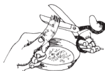
Рис. 4. В поисках волокон (первый шаг к получению бумаги)

Ваша первая задача – отделить целлюлозные волокна от носового платка. Отрежьте от него полоску приблизительно 2,5х20 см. Затем по одной вытаскивайте нитки из узкого конца полоски. Получившуюся бахрому обрежьте ножницами. Все нитки, и длинные, и короткие, собирайте в миску. Продолжайте выдергивать отдельные нитки и состригать бахрому до тех пор, пока не превратите всю полоску ткани в ворох маленьких ниточек. Это займет у вас не меньше часа. Чем терпеливее и аккуратнее вы будете сейчас, тем лучше и качественнее получится ваша бумага.