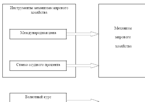
Рис. 3 Инструменты механизма мирового хозяйства

Экономически развитые страны заинтересованы в экспорте предпринимательского капитала: создавая в других странах производственные филиалы, они расширяют возможности для экспорта своих товаров, преодоления таможенных барьеров, использования зарубежных рынков.