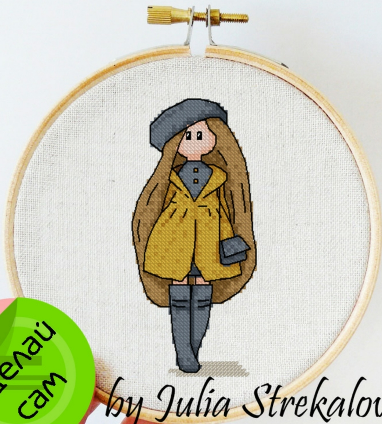
Схема для вышивки крестиком