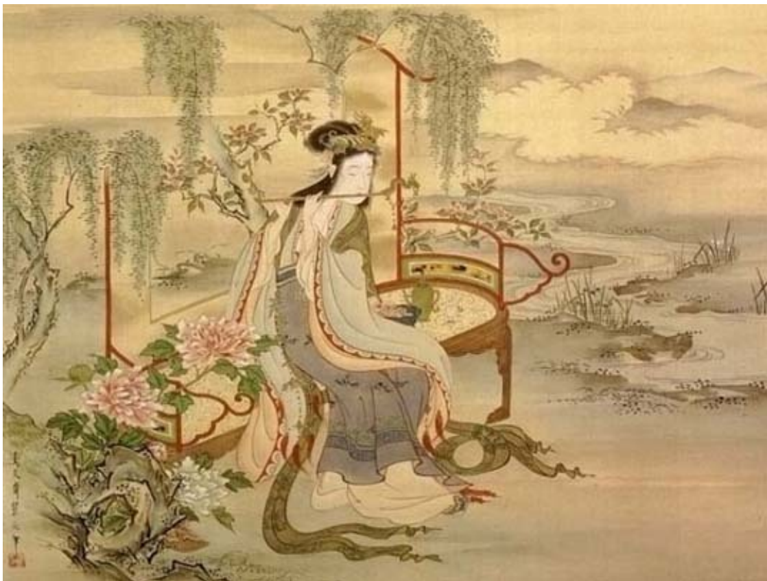
Китайская красавица Ян Гуйфэй

Легенда гласит, что в древности жили в Китае четыре великие красавицы, которые могли «затмить луну и посрамить цветы и [обладали] внешностью, способной рыбу заставить утонуть, а летящего гуся упасть». Красивейшей из четырёх, бесспорно, была Ян Юйхуань-гуйфэй. Ян – это фамильное имя «Тополь», Юйхуань – личное имя, переводится как «Нефритовое колечко», «гуйфэй» или «драгоценная наложница» – высший титул наложницы императора.