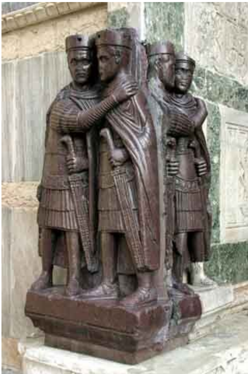
Тетрархи. Скульптура на соборе Св. Марка в Венеции

Ряд историков христианства предполагают, что инициатором Великого гонения был Галерий, воспитанный фанатичной матерью в духе старого римского многобожия. Остальные тетрархи лишь согласились с ним. Однако в истории виновником гонения обычно называют императора Диоклетиана. Имя его приравнено к имени Нерона.