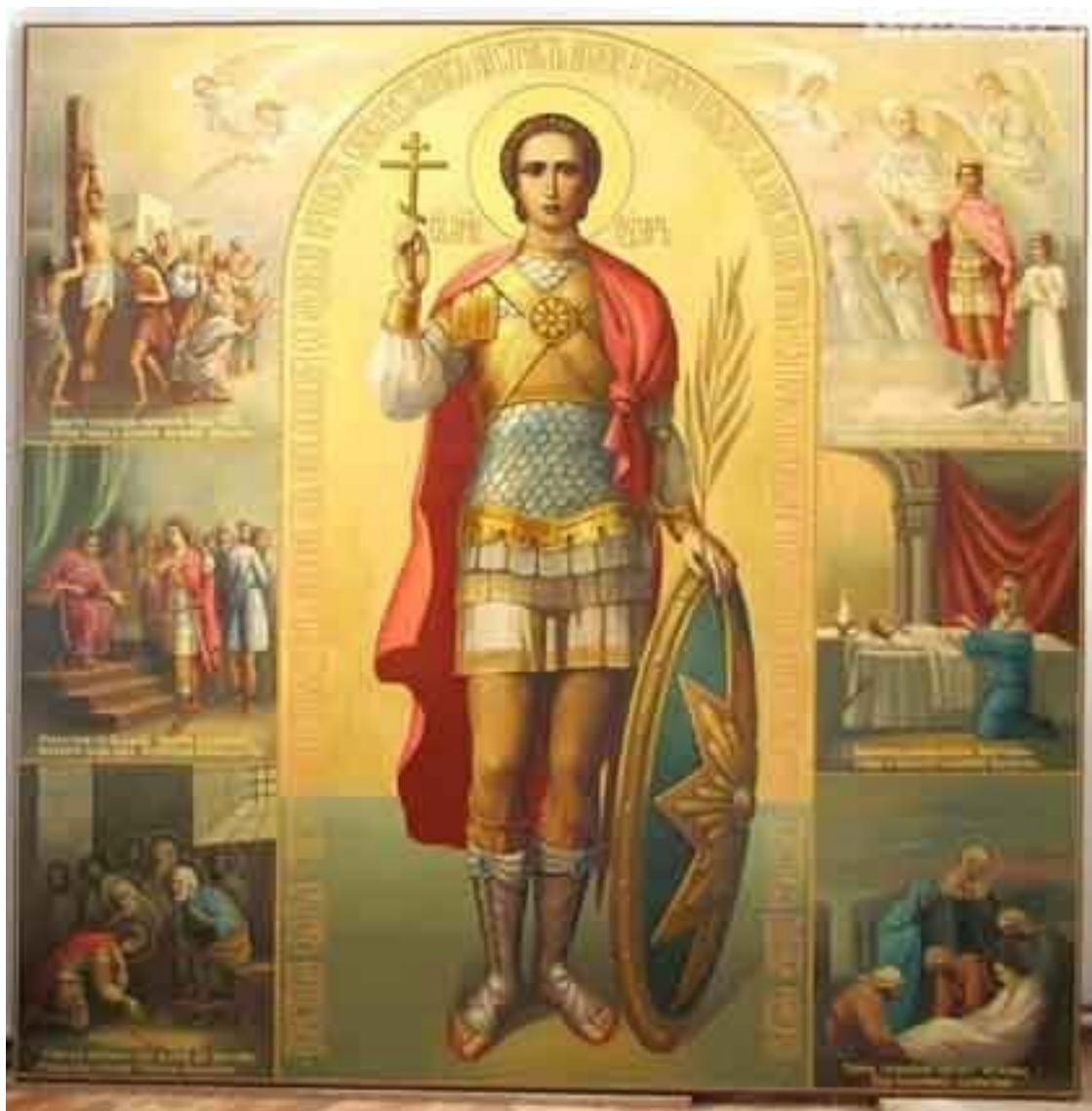
Св. мученик Уар с клеймами

Настал день суда. Обвиняемые предстали перед вершителями правосудия. Но не успел судья приступить к рассмотрению дела, как вперёд вышел охранявший преступников стражник Уар и объявил себя христианином. Его сразу же подняли на дыбу и избили кожаными ремнями, принуждая отречься. Когда мученик отказался, его привязали к столбу, вспороли ему живот и оставили так умирать.