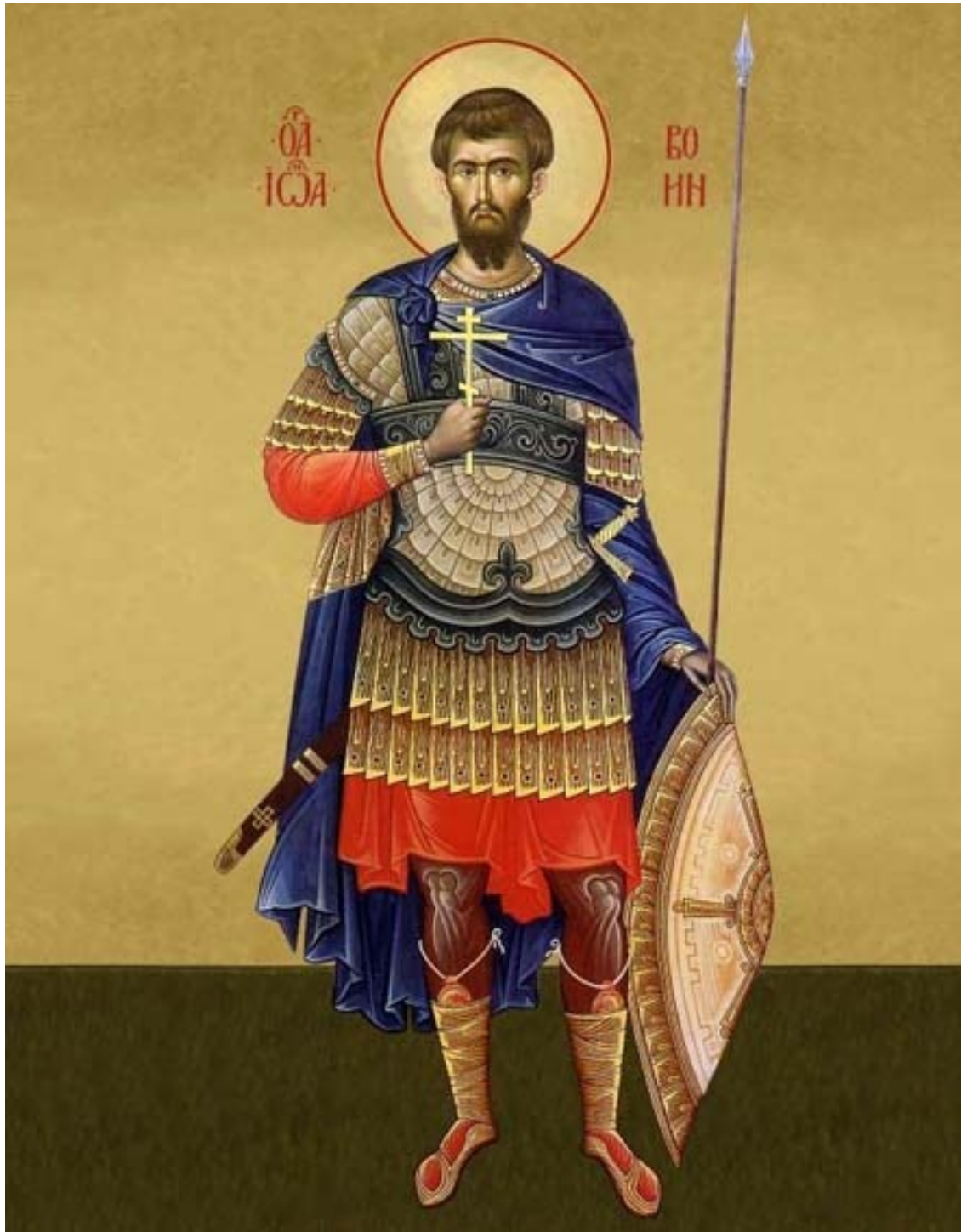
Святой Иоанн Воин

Иоанна Воина освободили. Из армии он ушёл и поселился в Константинополе. Долгие годы вёл Иоанн праведную светлую жизнь. Дожил он до глубокой старости и почил в мире.