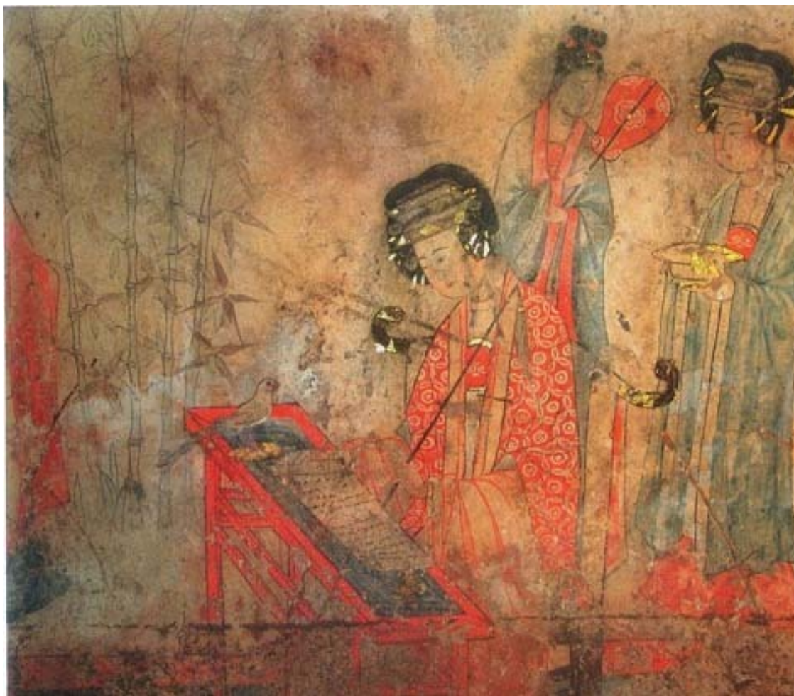
Ян Гуйфэй учит попугая повторять сутры. Роспись погребения династии Ляо. XII в.

Сюань-Цзун был человеком искушённым в дворцовых интригах. Достаточно уже того, что в детстве его неоднократно пыталась убить У Цзэтянь, но всякий раз мальчика спасала любившая его как мать тётюшка-принцесса Тайпинь. Да и в уме молодому императору нельзя было отказать: одной из главных акций, осуществлённых Сюань-Цзуном в начале правления, стало введение первых в истории человечества бумажных денег. В империи Тан шло бурное экономическое развитие, процветали торговля и города. В одной столице империи городе Чанъань проживало тогда более миллиона человек. Никогда более в истории человечества, за исключением сталинской эпохи СССР, не был столь высоко поднят престиж учёных, писателей, зодчих, художников и музыкантов.