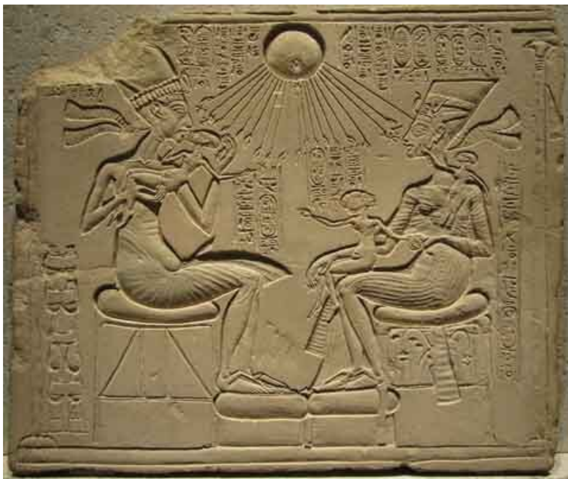
Эхнатон и Нефертити. Вверху бог Атон