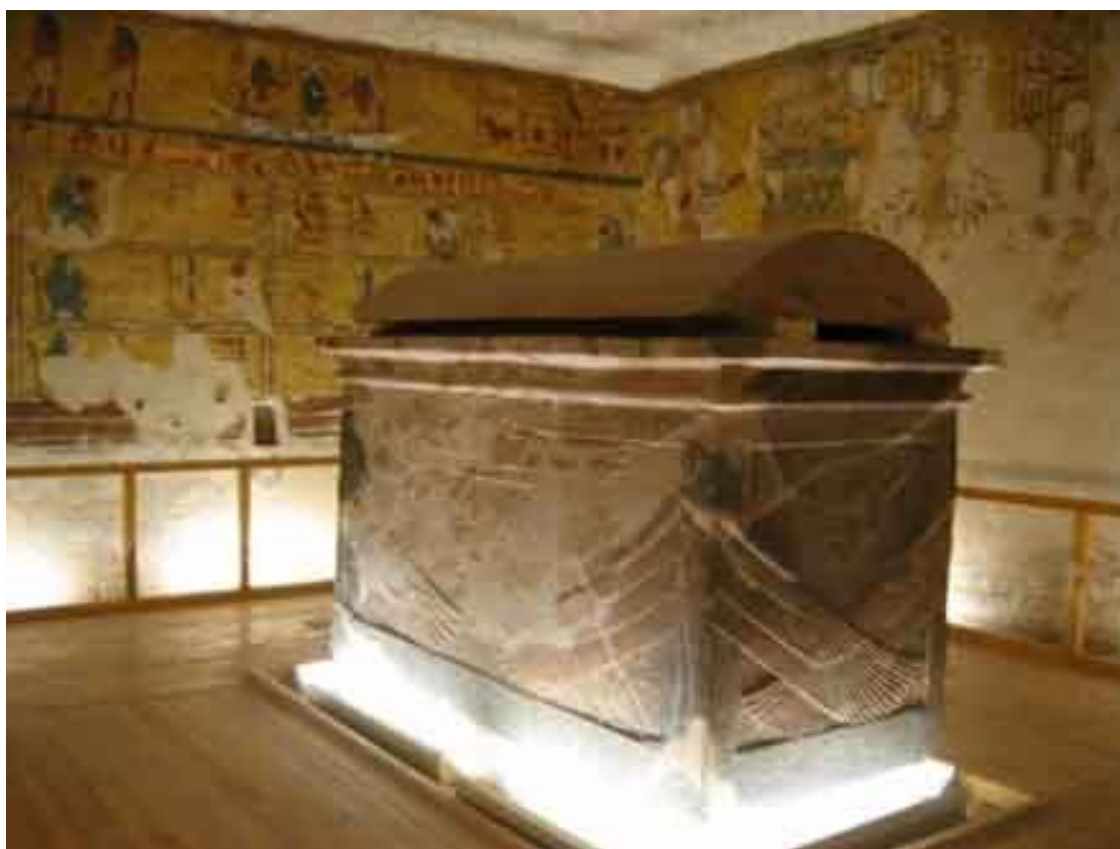
Саркофаг фараона Эйе в его гробнице

Полководец стал основателем величайшей в истории Древнего Египта XIX династии – Рамсесидов. При нём был окончательно восстановлен культ бога Амона-Ра, а бог Атон был предан забвению. Монотеистской реформе Эхнатона был положен конец, при этом Хoremхeб постарался уничтожить любую память о последних фараонах XVIII династии, начиная с Эхнатона, включая Нефертити, Тутанхамона и Эйю. Их имена удалили из списка правивших фараонов, а годы их правления присчитали к царствованию Хoremхeба. Об этих прославленных ныне фараонах забыли почти на три с половиной тысячи лет. Они были возвращены в историю только в XIX веке.