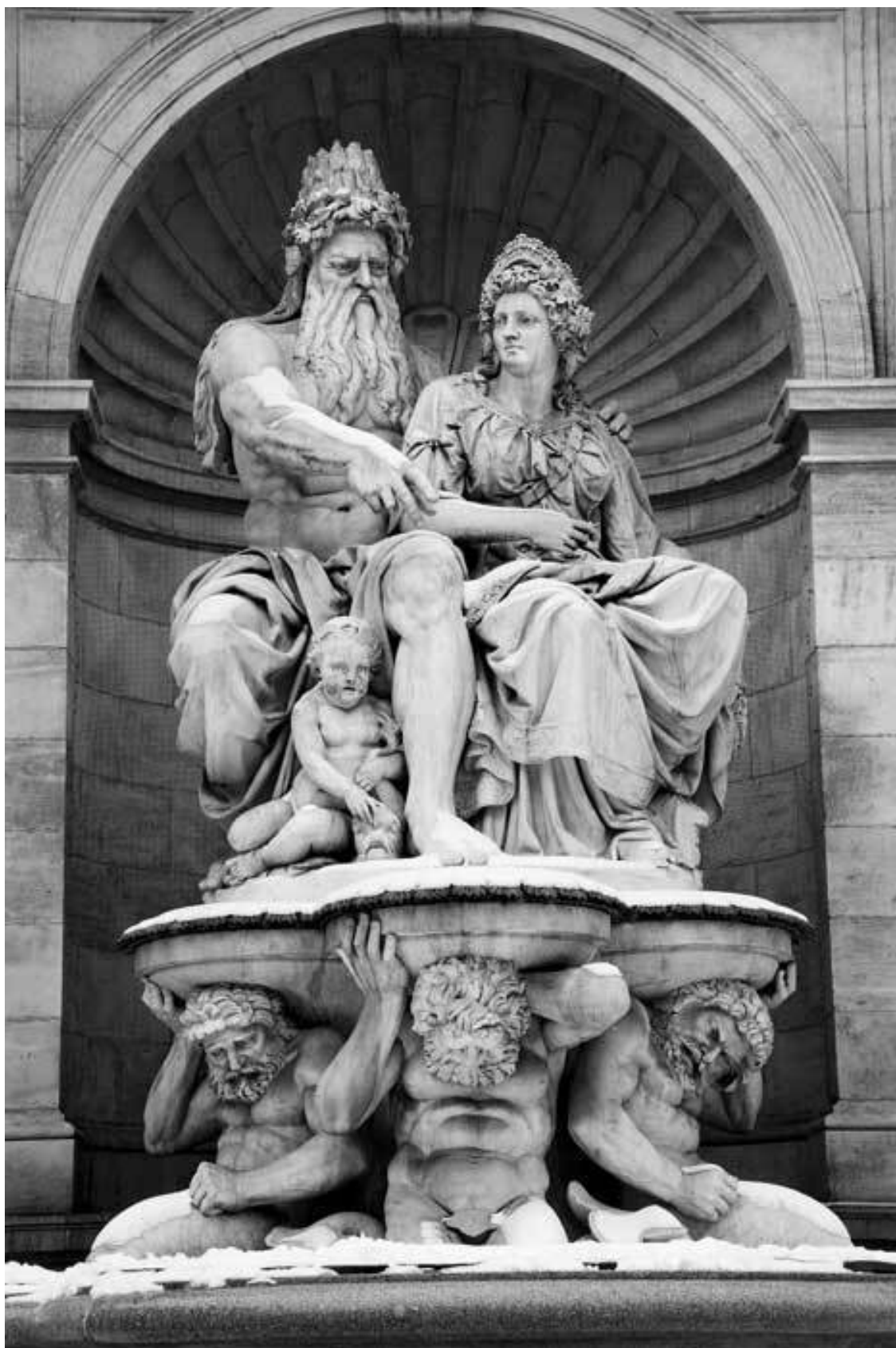
Нептун и его жена Салация. Скульптура перед музеем Альбертина в Вене, Австрия.