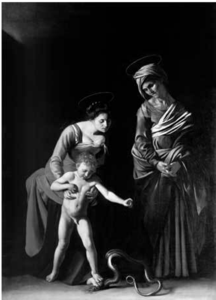
Караваджо. Мадонна со змеей. Галерея Боргезе. Италия, 1605–1606

В истории известны случаи, когда вместо отчества детям давалось матчество – именование по материнской линии. Такое бывало и на Руси, и в Европе. Например, если мать была более знатного рода, или если ребенок был незаконнорожденным. Так было с сыном князя Ярослава Владимировича Олегом от наложницы Настасьи – Олегом Настасьичем (а не Ярославичем). Сын Мстислава Владимировича тоже имел матроним: как ребенок второй жены князя и мачехи Мстиславовых детей от первого брака он звался Владимиром Мачешичем (а не Мстиславичем). Племянник Кнута Великого Свен тоже именовался по матери, сестре короля Эстрид.