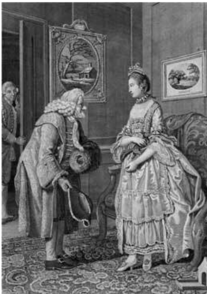
Джон Коллет. Гравюра из Кентерберийских рассказов «Январь и Май». Англия, 1771

Свинцовые белила – по сути углесвинцовая соль. Наиболее древним способом получения свинцовых белил принято считать так называемый голландский способ. Для него нарезали свинцовые пластины в пару миллиметров и длиной с мизинец, сворачивали спиралью и отправляли в глиняные горшки, покрытые изнутри глазурью, залив свинец уксусом. Горшки со свинцово-уксусной смесью пересыпались конским навозом в особых кирпичных камерах, которые заполнялись горшками и навозом. Навоз, как известно, выделяет тепло, под воздействием которого пары уксусной кислоты запускают реакцию, приводящую к получению уксусно-свинцовой, а затем и угле-свинцовой соли.