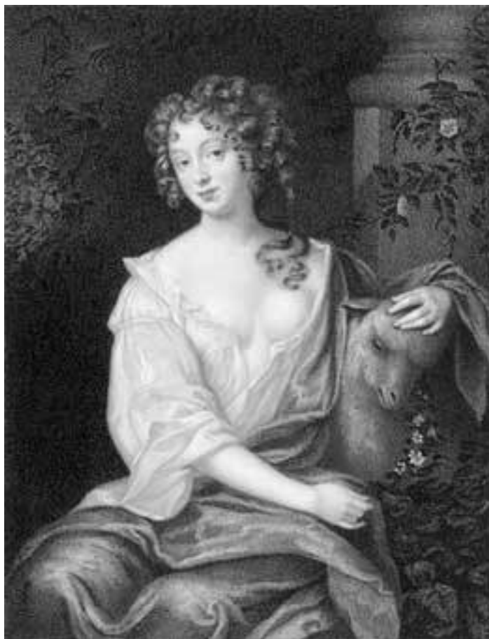
Фаворитка Карла II Нелл Гвинн. Англия, 1670

В Англии Нового времени белка символизировала проституцию, так что этот грызун на женском портрете ни о чем хорошем не говорит. А недавно доказали, что белки еще и проказу распространяли. Девушка с белкой не случайно изображена на гравюре, иллюстрирующей сюжет из Кентерберийских рассказов о связи немощного Января с молодой и неверной Май, которая изменяет старику у него под носом.