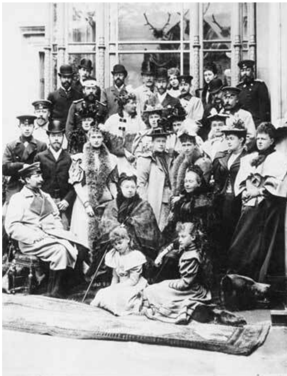
Королева Виктория, Эдуард VII, кайзер Вильгельм II и цесаревич Николай с невестой Алисой Гессенской и другие – в Кобурге 21 апреля 1894 года на свадьбе принцессы Виктории Мелита и Эрнста Гессенского

то, по слухам, выступавшего против этого брака, нашлось другое препятствие – принцесса отказывалась принимать православие, что было обязательным условием для сочетания с царским отпрыском. Но уговоры родни и ухаживания Николая Александровича не прошли даром; решился и вопрос согласия родителей и даже получено одобрение королевы Виктории, которая с симпатией отнеслась к Николаю, узнав его. В итоге, как вы знаете, и Алиса сдалась. И стала женой наследника российского престола.