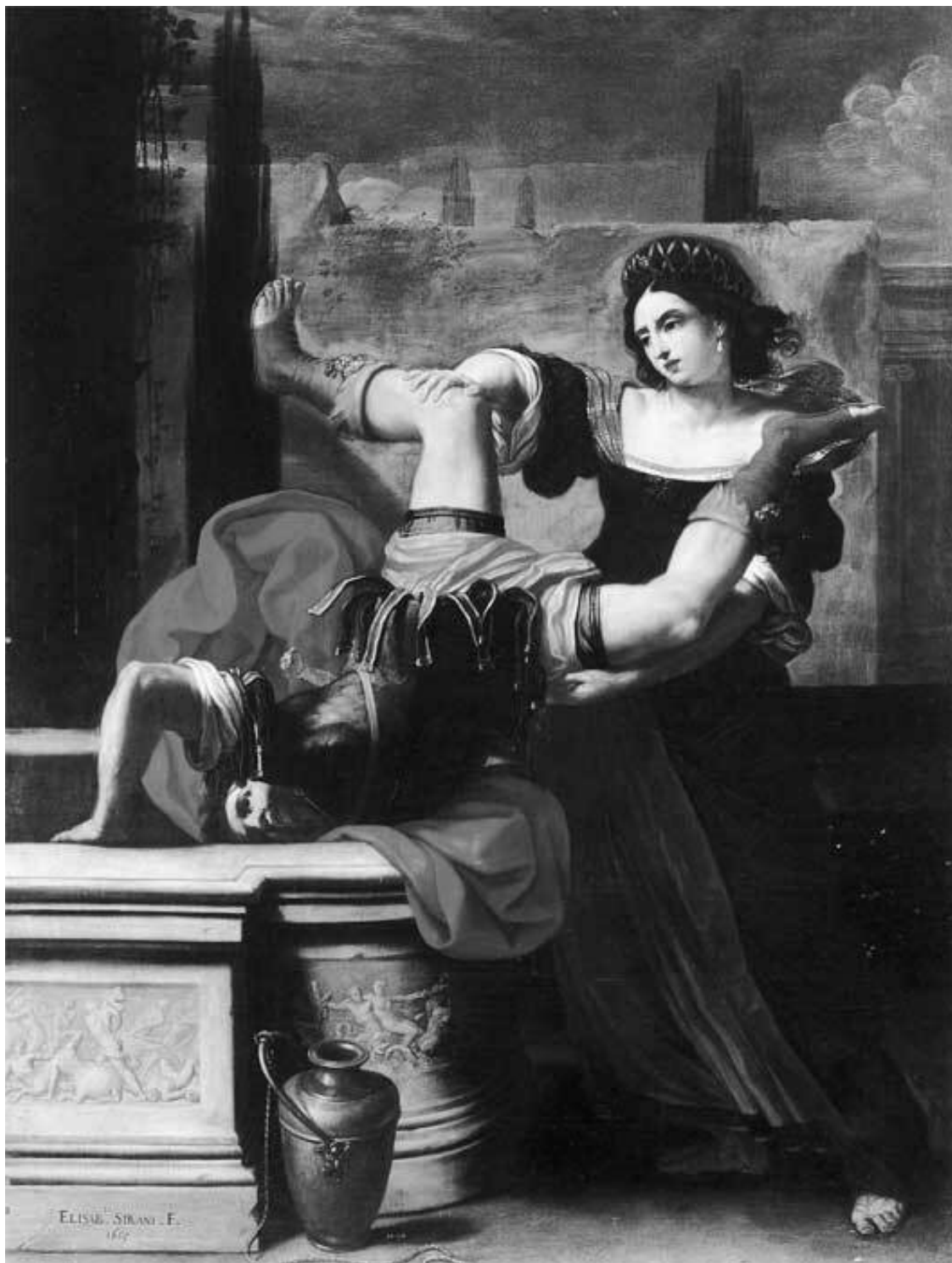
Элизабетта Сирани. Тимоклея Фиванская сбрасывает в колодец своего насильника. 1659