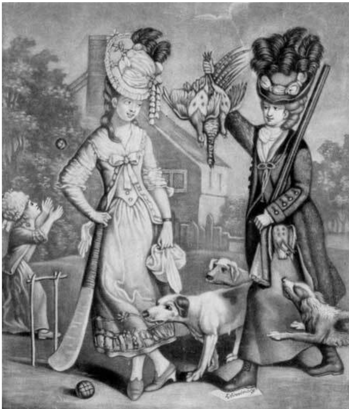
Джон Коллет. Мисс Уикет и Мисс Триггер. 1778

этому кодексу христианка, переспавшая с евреем, не просто осуждалась, а приговаривалась к девятилетней епитимье – в некоторых регионах Италии этот запрет распространялся даже на рабынь.