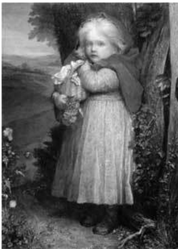
Джордж Фредерик Уоттс. Викторианская Красная шапочка. Англия, 1890

Викторианская Красная шапочка Джорджа Фредерика Уоттса – такая лапочка, как можно было ее одну отправить в лес?