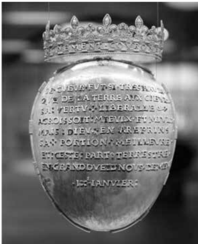
Золотой ларец Анны Бретонской. Национальная библиотека Парижа. Франция