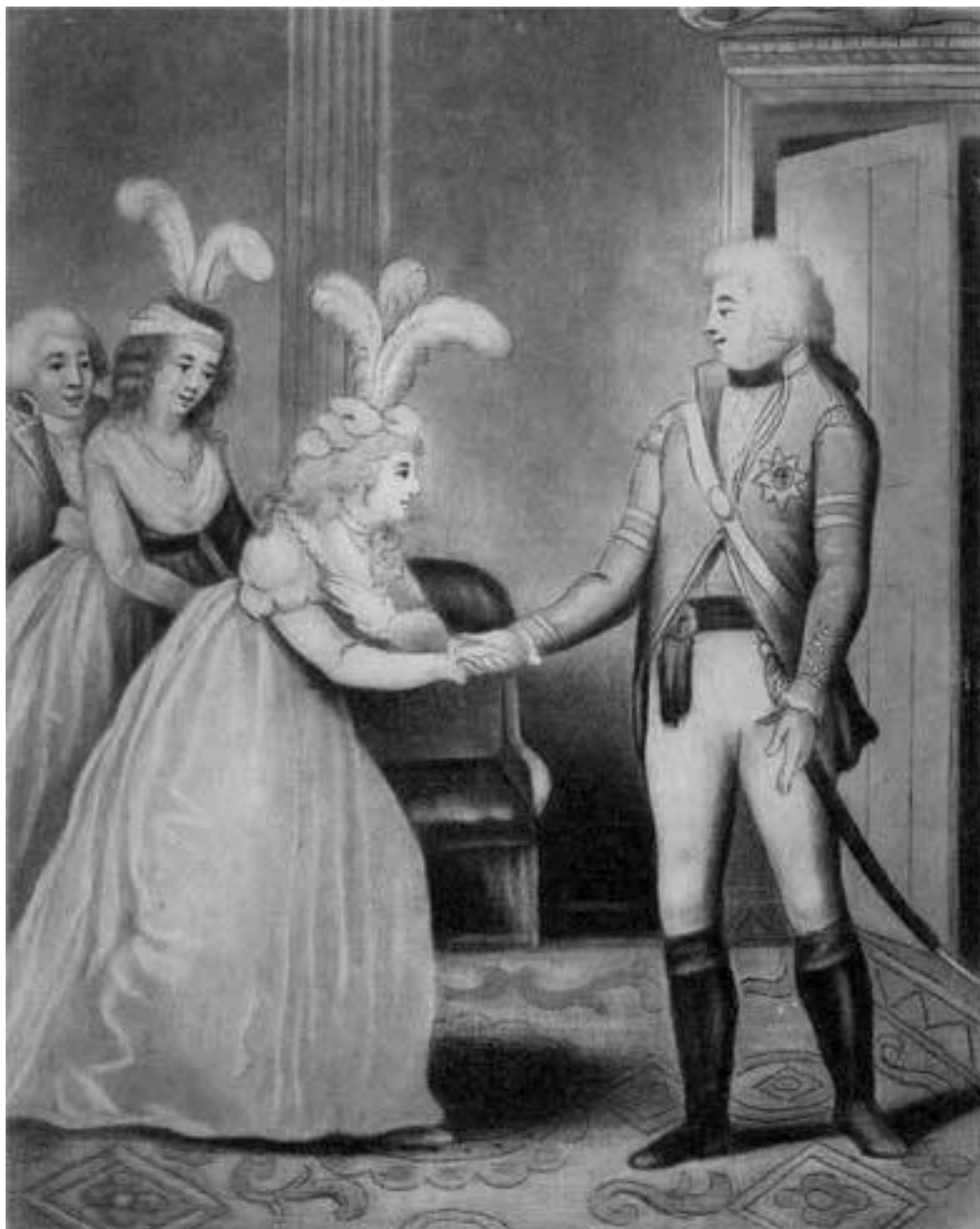
Первая встреча принца Уэльского со своей будущей женой Каролиной Брауншвейгской. Лондон, 5 апреля 1795

Католические энциклопедисты полагают, что изначально образ бородатой девы возник из мисинтерпретации образа Спасителя в тунике и с короной из Архиепархии Луки в центральной Италии. Распятый Спаситель из базилики Луки действительно выглядит довольно женственным. В свое время эта работа Никодемуса неоднократно копировалась, но с XI века такой образ Иисуса перестал быть каноническим, и, как мы видим, приобрел совершенно иную интерпретацию.