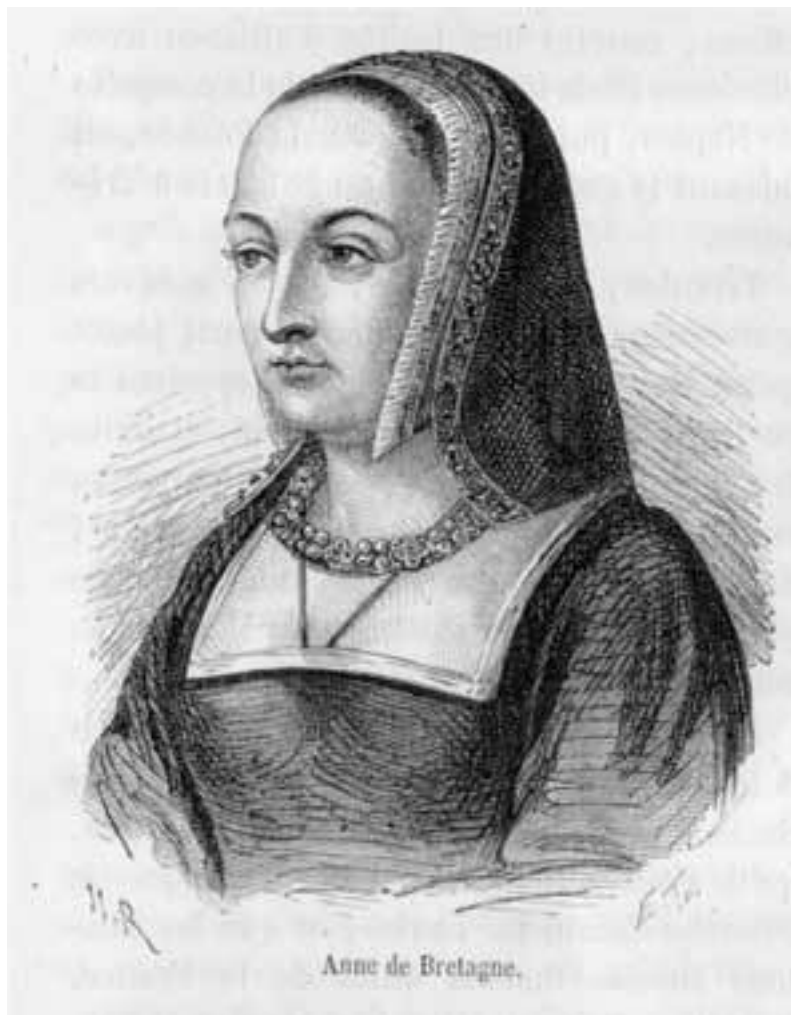
Герцогиня Бретани Анна Бретонская. Франция, XV–XVI вв

Сердце поместили в золотой реликварий 15×12 см, увенчанный короной из лепестков клевера и лилий, и торжественно доставили в Бретань, где его встречали, стоя на коленях и со слезами на глазах. Реликварий с сердцем был установлен в соборе Сен-Пьер-Сен-Поль между гробами Франциска II Бретонского и Маргариты Наваррской де Фуа.