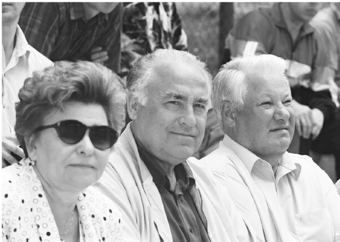
Наина Ельцина, Виктор Черномырдин и Борис Ельцин

В июне 1989 года министр газовой промышленности СССР пришел на заседание Совета министров Советского Союза с революционной идеей. Он предложил ликвидировать его министерство. Участники заседания не верили своим ушам: им казалось, что министр сошел с ума. Министра звали Виктор Черномырдин.