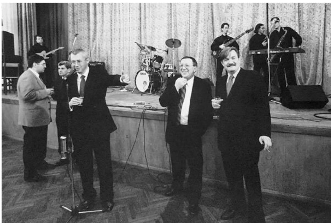
Руководители телеканала НТВ (справа налево): Евгений Киселев, Владимир Гусинский, Игорь Малашенко и Олег Добродеев

Александр Коржаков рассказывает спустя 25 лет, что это он скомандовал начать операцию против Гусинского – по требованию Ельцина. Якобы президент разозлился из-за того, что его жена Наи́на куда-то ехала и перед ней перекрыли дорогу из-за кортежа Гусинского. Вот Ельцин и приказывает «разобраться с Гусинским». О своих контактах с Березовским Коржаков почему-то не упоминает, хотя предполагает, что Березовский мог повлиять на президента через Юмашева. И, конечно, Коржаков не может скрыть собственной неприязни к Лужкову. (Семья Ельцина настаивает, что операция была личной инициативой Коржакова: Наи́на Ельцина не любит быстрой езды и никогда не жаловалась на кортеж Гусинского.)