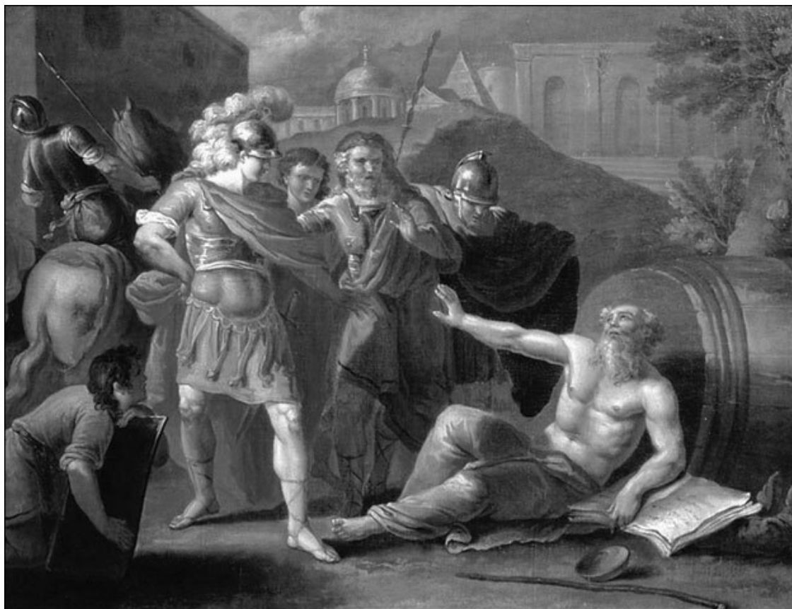
Александр Македонский перед Диогеном. Художник И. Ф. Тупылев. 1787 г.

Жизнеописание Диогена Синопского, оставленное античным биографом Диогеном Лаэртским, изобилует абсурдными сценами. «Желая всячески закалить себя, летом он перекатывался на горячий песок, а зимой обнимал статуи, запорошенные снегом. [...] Однажды он рассуждал о важных предметах, но никто его не слушал; тогда он принялся верещать по-птичьи; собрались люди, и он пристыдил их за то, что ради пустяков они сбегаются, а ради важных вещей не пошевеливаются. Он говорил, что люди соревнуются, кто кого толкнет пинком в канаву, но никто не соревнуется в искусстве быть прекрасным и добрым» («Жизнь, учения и изречения знаменитых философов», VI, 2).