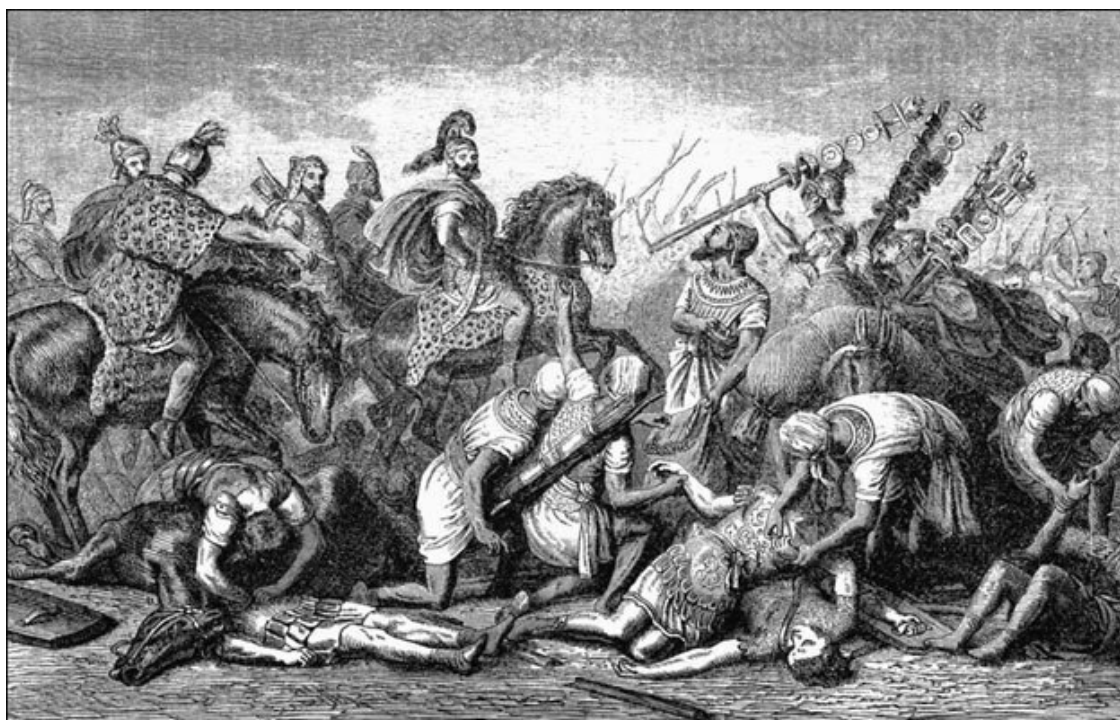
Ганнибал в битве при Каннах. Гравюра XIX в.

Ганнибал начал войну, несмотря на явное неравенство сил. В 220 г. до н. э. Рим при населении в 3,75 миллиона человек был в состоянии мобилизовать около 750 (древнегреческий историк Полибий) или даже 800 тысяч солдат (Тит Ливий). В то время Рим во всех отношениях превосходил Карфаген. Рим располагал огромной, мощной армией, привыкшей к победам, сильным флотом и немалыми денежными средствами. После Первой Пунической войны серьезно изменилось геополитическое положение Италии. Теперь Сицилия и Сардиния защищали итальянское побережье от нападений с моря; в то же время с территории этих островов можно было совершать вторжения в Африку – в Карфаген.