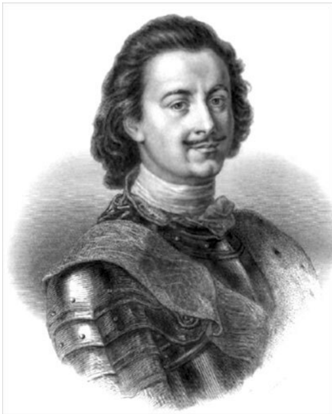
Император Петр Великий

В 1652 году при дворе патриарха Никона был составлен еще один летописный свод. Его значение было неприкрыто политическим, поскольку он завершался рассказом о перенесении в Москву из Соловков мощей митрополита Филиппа, который был убит при Иване Грозном, и поставлением на патриаршество самого Никона 26 .