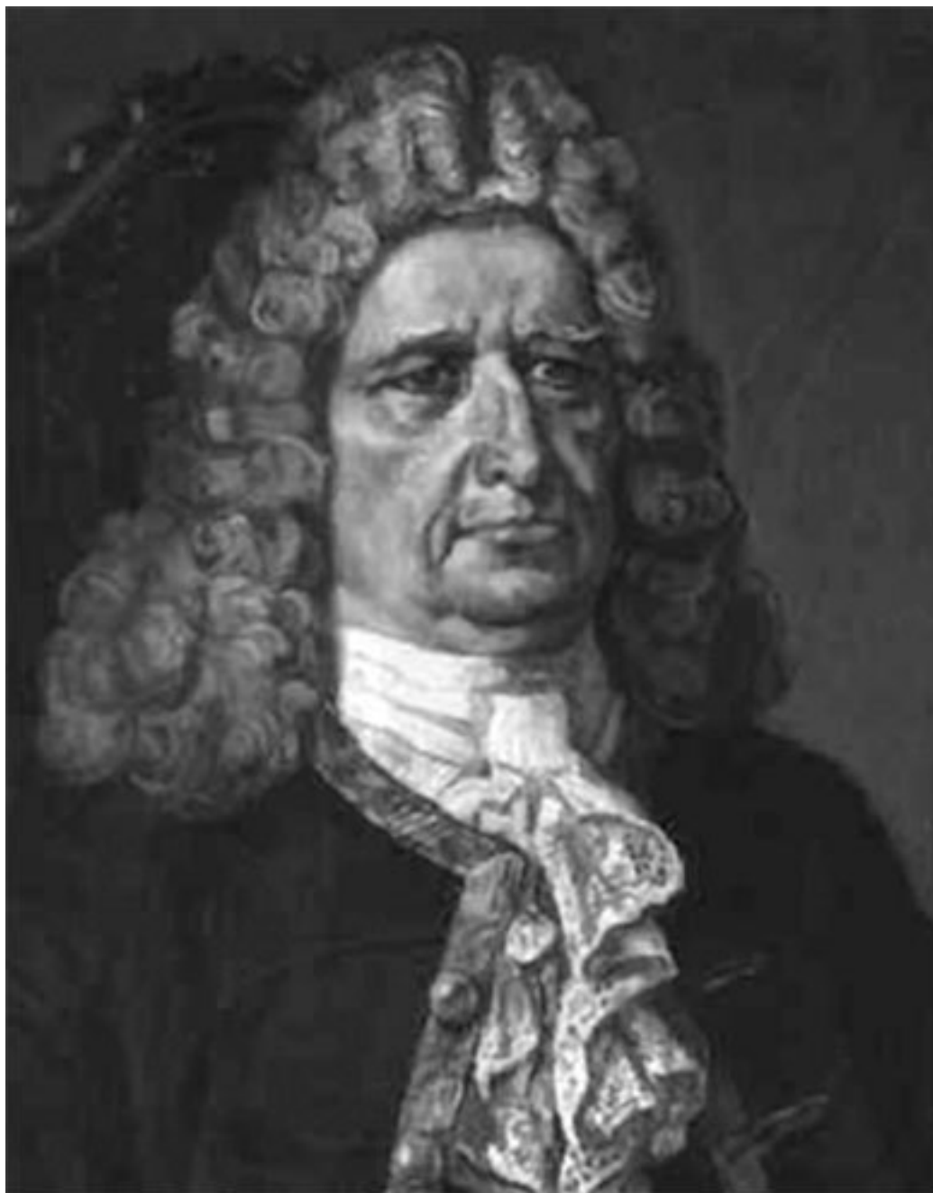
Герхард Фридрих Миллер

Почтенное академическое собрание и лично Ломоносов для обвинений Миллера использовали перлюстрацию его переписки с Делием. Ломоносов, безусловно, знал о вскрытом письме Миллеру хотя бы потому, что присутствовал на всех собраниях по этому поводу, подписывал все решения и даже редактировал рапорт Разумовскому. На документе, опубликованном в «Полном собрании сочинений», есть собственноручная правка Ломоносова и его подпись в конце документа. Так что считать его обманутым нет никакой возможности.