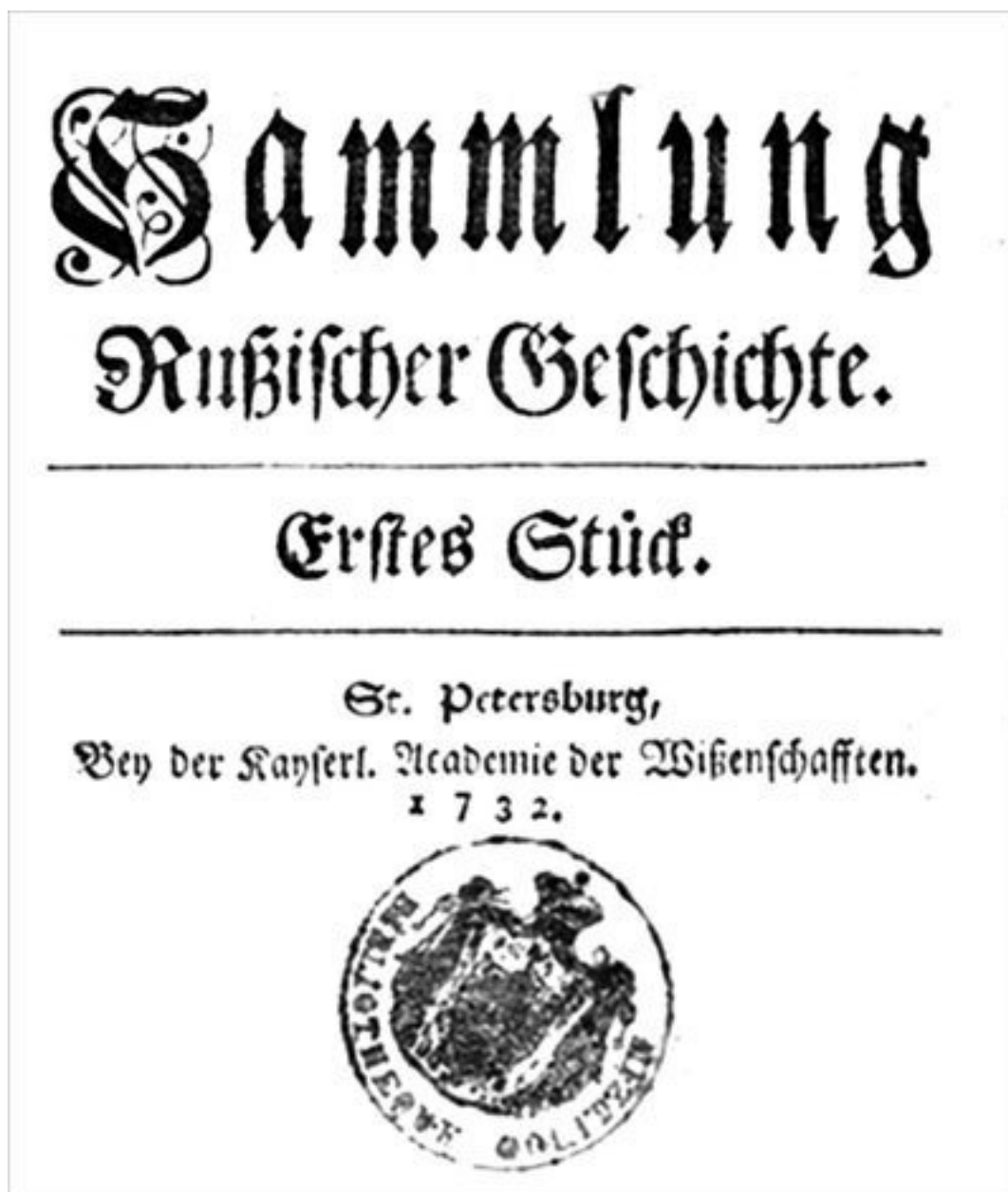
Обложка одного из первых выпусков «Sammlung Rußische Geschuchite»

Потому в 1732 году Миллер инициирует издание нового журнала, теперь уже по русской истории на немецком языке, – «Sammlung Rußische Geschichte». Первые три выпуска этого журнала вышли под редакцией Миллера в 1732–1733 годах, пока он не уехал в экспедицию в Сибирь. «Sammlung» стал быстро известен всей образованной европейской общественности. Огромный интерес к нему объяснялся первыми публикациями русских летописей, несторовской летописи в переводе на немецкий язык. В первых шести выпусках журнала, в 1732–1735 годах, издавались выдержки из Повести временных лет в немецком переводе 72 . Журнал широко разошелся по Европе и надолго стал чуть ли не единственным источником сведений по русской истории. В статье о Миллере об этом прямо говорится: «На многие годы журнал «Sammlung Rußische Geschichte» стал основным источником по русской истории для всей про-