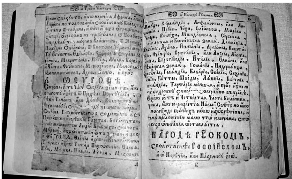
Рукопись киевского «Синописиса»

Следующая часть из 20 глав посвящена киевским князьям от Владимира до нашествия Батыя. В ней выделяется княжение Владимира Мономаха и вводится глава «О сем, откуда российский самодержец венец царский на себе носить начаша», о происхождении царских регалий. Четыре главы автором отведены на описание монгольского нашествия, а дальше начинается большая часть, посвященная Дмитрию Донскому и Куликовской битве, включающая 29 глав. Это самая большая часть книги, где события получили наиболее подробное описание, включающее, впрочем, описание разнообразных чудес и явлений, вполне в духе летописной традиции.