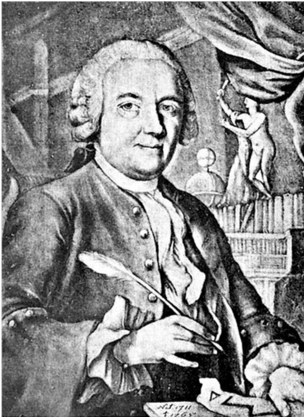
Михаил Васильевич Ломоносов. Портрет 1765 г.

До спора с Миллером Ломоносов имел всего три касательства к русской истории. Первое – в 1746 году, когда составлялась надпись к серебряной раке для мощей Александра Невского, в чем Ломоносов также принимал участие 100 . Второе – уже упомянутый выше разбор «Родословия великих князей, царей и императоров» П.Н. Крекшина. Третье – написание посвящения «Истории Российской» В.Н. Татищева в 1748 году. Конечно, некоторое представление о русской истории у него было, но назвать его «профессиональным историком» и вообще