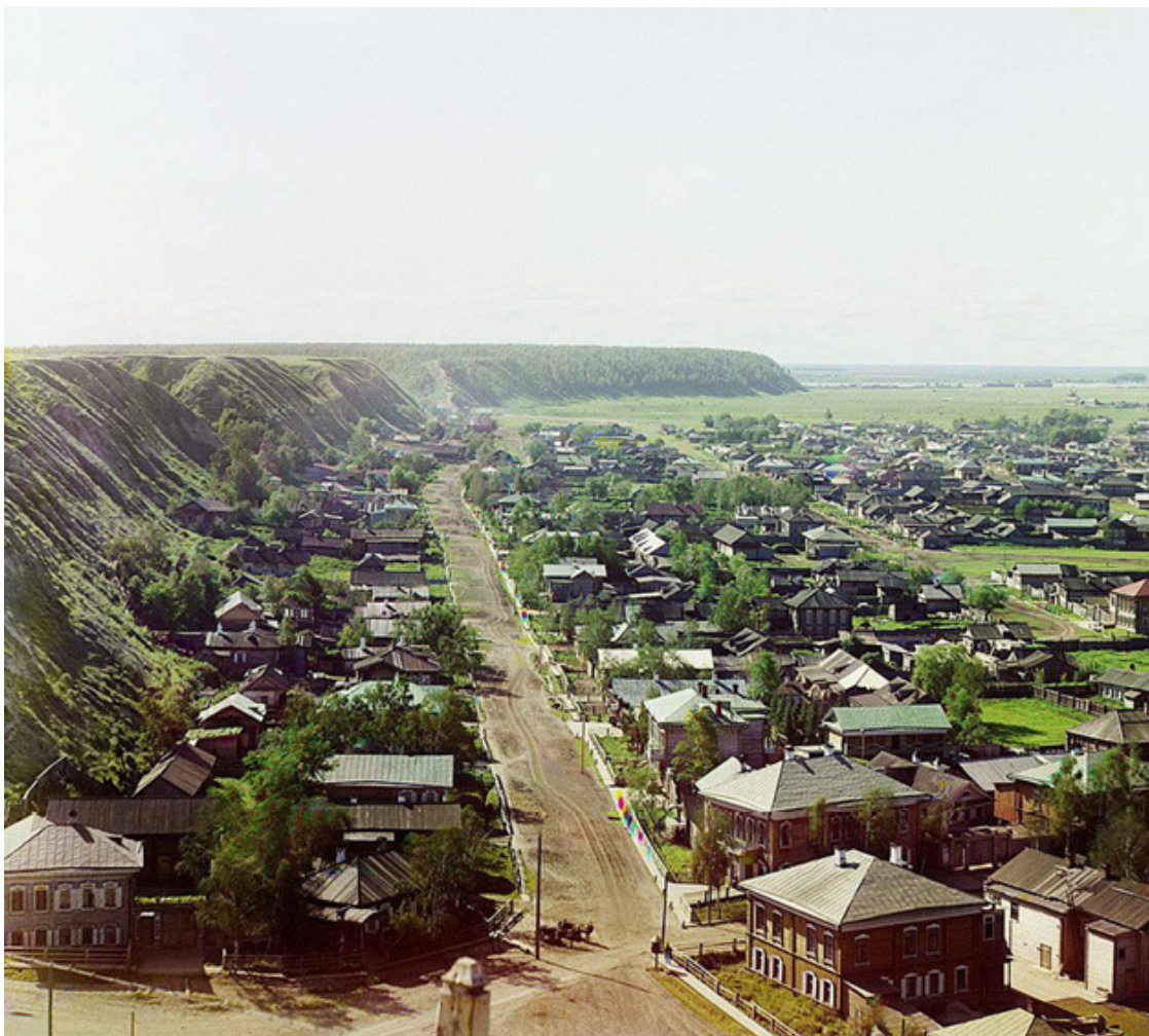
Старый Тобольск летом

В этот же год я заболел корью (а может, ветрянкой). Всё-таки, наверное, корью. Даже я помню эту болезнь.