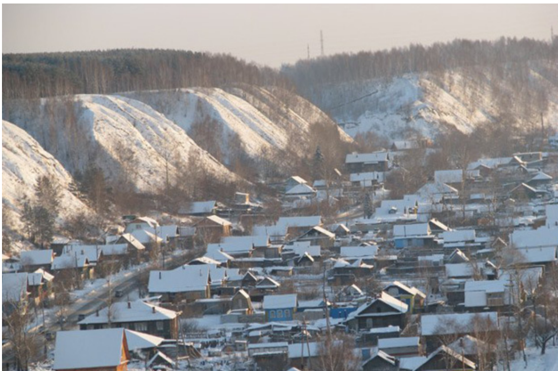
Старый Тобольск зимой

Даже царь Пётр I покровительствовал городу, создав в городе ряд государственных учреждений. В 1711 году в город приезжает первый Сибирский губернатор – князь Матвей Птои Гагарин. Тобольск дал России много замечательных людей, десятки известны. Это Менделеев Дмитрий Иванович, Ремезов Семён Ульянович и другие замечательные люди. Родился и я там, чем горжусь всю свою жизнь. Здесь я помешу ряд видов Тобольска которые очень любила моя мама.