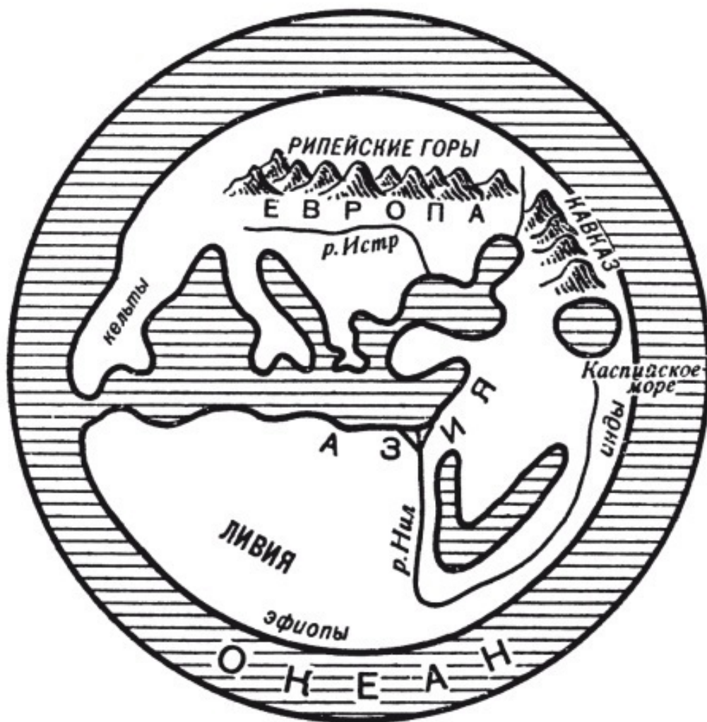
Рис. 2. Карта Земли по Гекатею в реконструкции Л.А. Ельницкого в реконструкции Э. Банбери

Ледник, как известно, распространялся к югу довольно далеко, доходил до теплых средних широт. Как это происходило? Представление о продвижении ледника на юг под давлением масс льда, нарастающих в приполярных областях, не выдерживает критики. Нарастание высоты слоя льда само по себе не должно вызывать горизонтального перемещения его нижних слоев, так как лед, в отличие от воды, представляет собой типичное кристаллическое твердое тело.