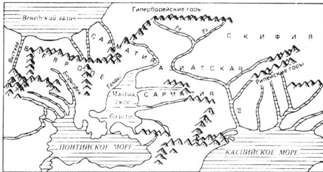
Рис. 1. Гиперборейские горы по Птолемею

Этот хребет на Русской равнине точно совпадает с краем ледникового щита Валдайского оледенения» – утверждает А.А. Сейбутис и приводит карту, показанную на рисунке 1 [2, 102–10].