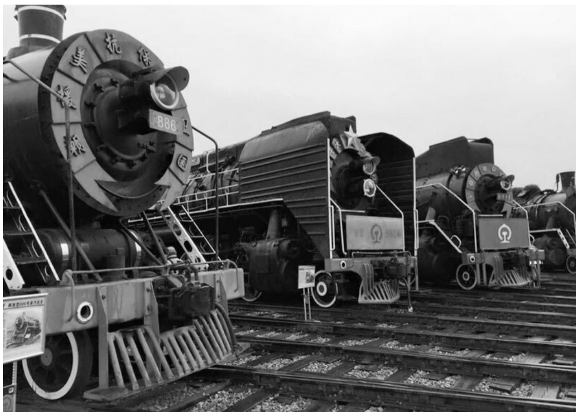
Хэндаохэцзы – русский поселок на КВЖД (2015 г.)