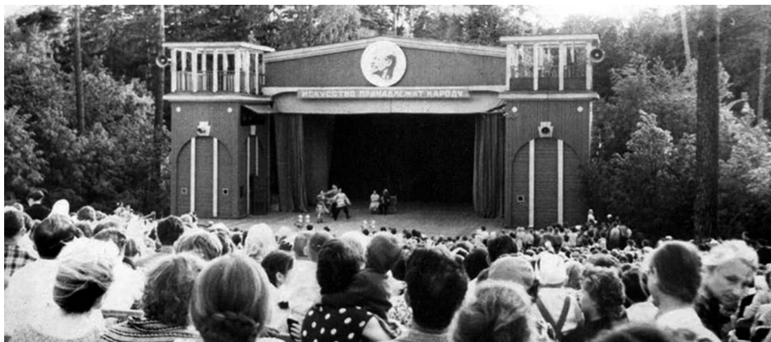
Танцплощадка и сцена. Красногорск

стиляги в брюках-дудочках, с волосами, густо смазанными бриолином и зачёсанными назад. На площадке становилось всё теснее, а толпа зевак всё плотнее. Всем хотелось увидеть, как танцуют запрещённые танцы, особенно рок-н-ролл.