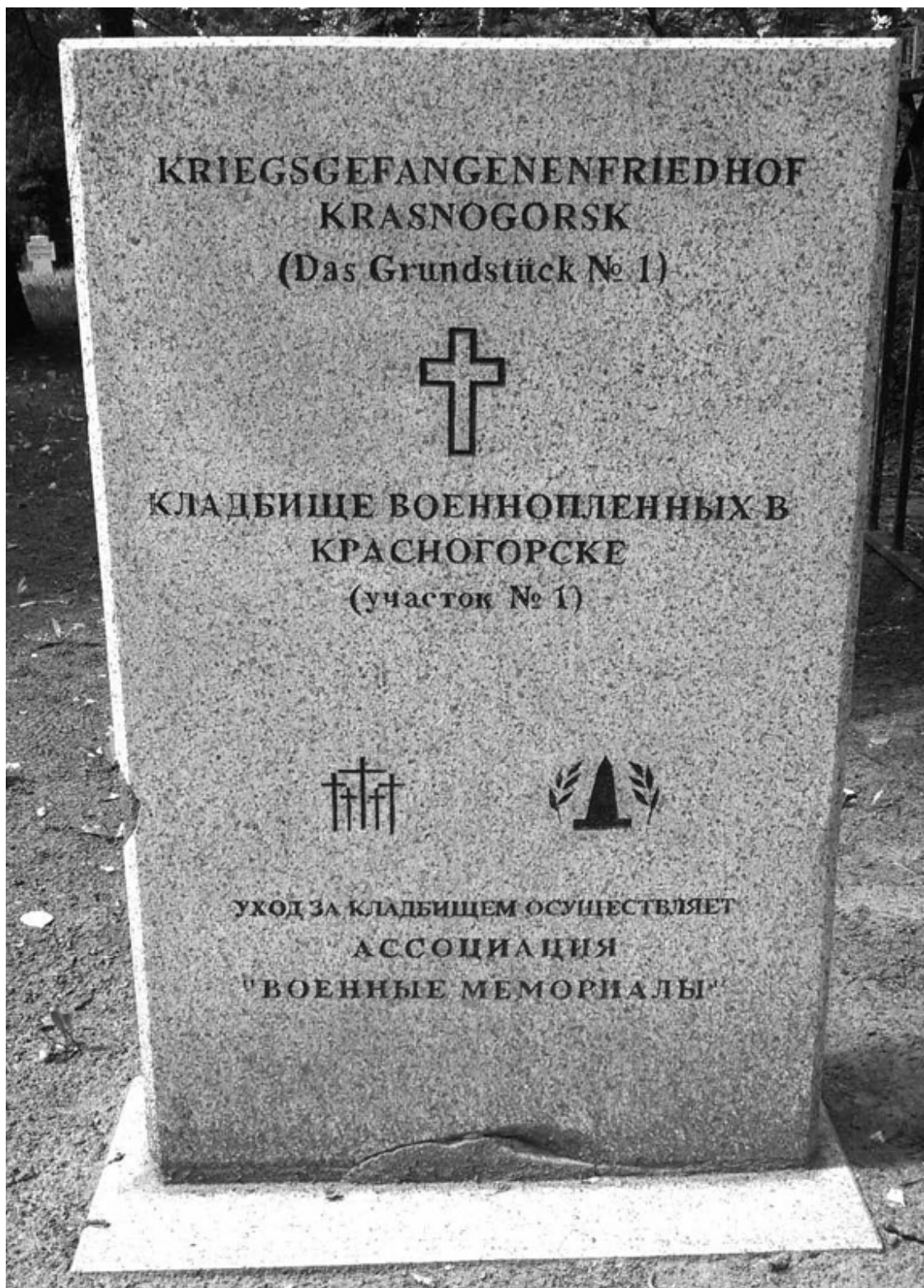
Монумент на немецком кладбище в Красногорске, наши дни