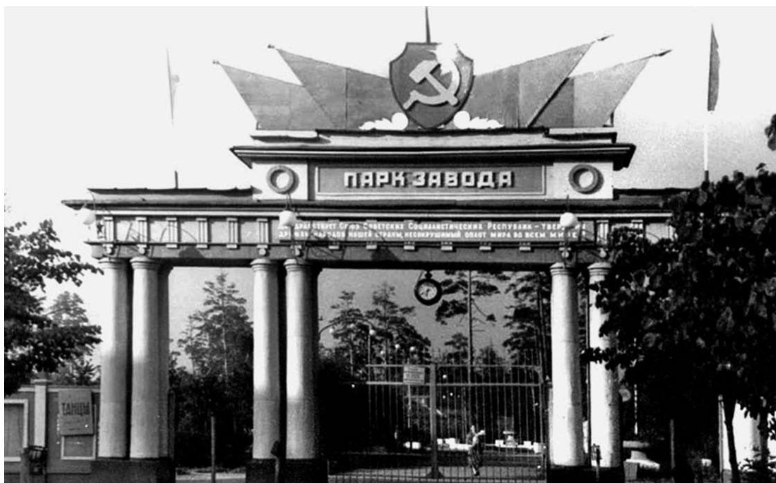
Вход в парк завода КМЗ