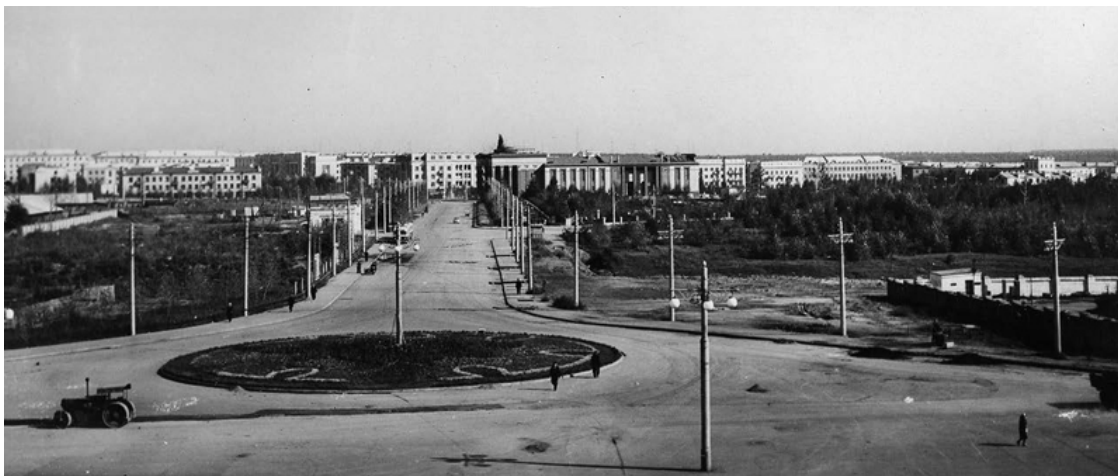
Вид на Красногорск, 1950-е годы

Подмосковный Красногорск, каким я его помню с 1952 года, был относительно небольшим, очень уютным городом с парком, прудом, с аттракционами для детей и взрослых.