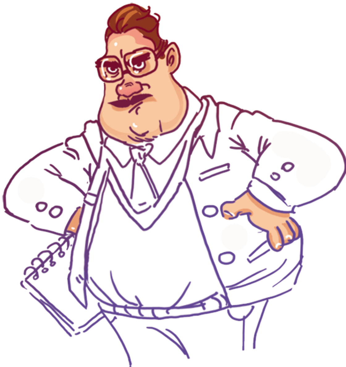
Директор в «злом» костюме