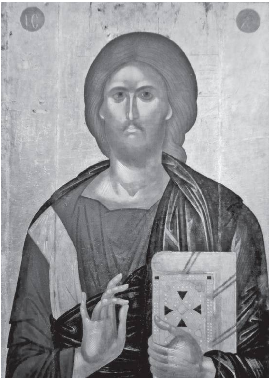
Христос Пантократор. XV век