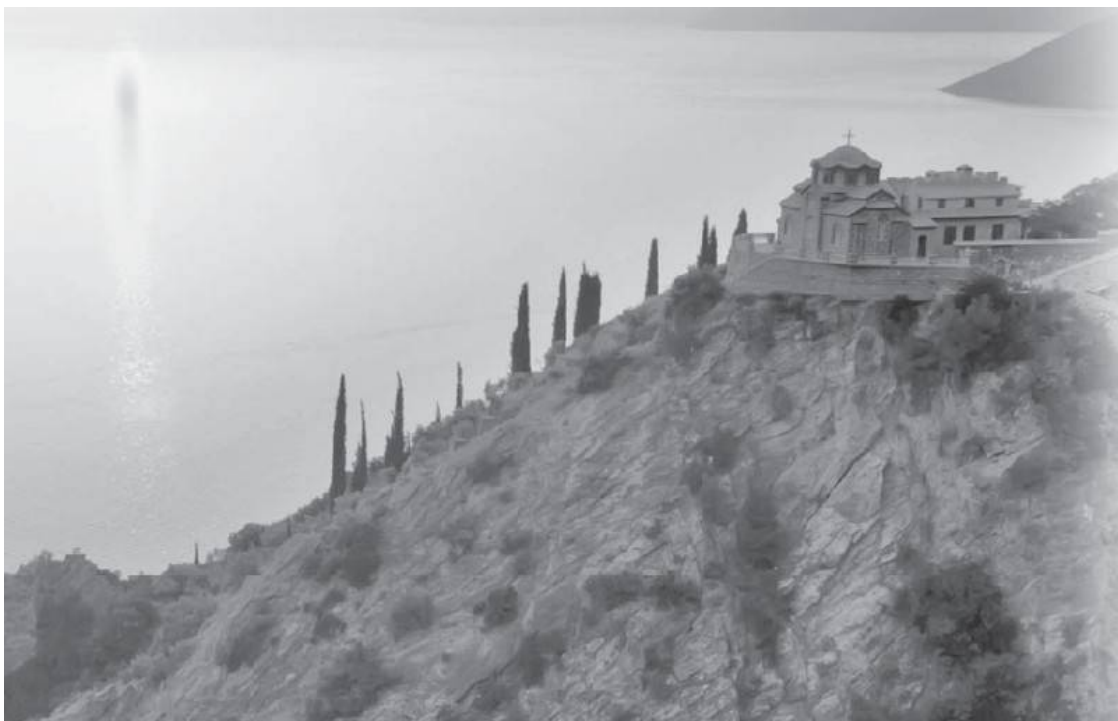
Келья в скиту святой Анны. Афон

• Некто попросил старца сказать что-нибудь для духовной пользы. «Что я вам скажу?» — спросил старец. «А что вам ваше сердце подсказывает», — ответили ему. Старец сказал: «Мое сердце подсказывает мне вот что: “Возьми нож, изрежь меня на кусочки, раздай их людям и после этого умри”».