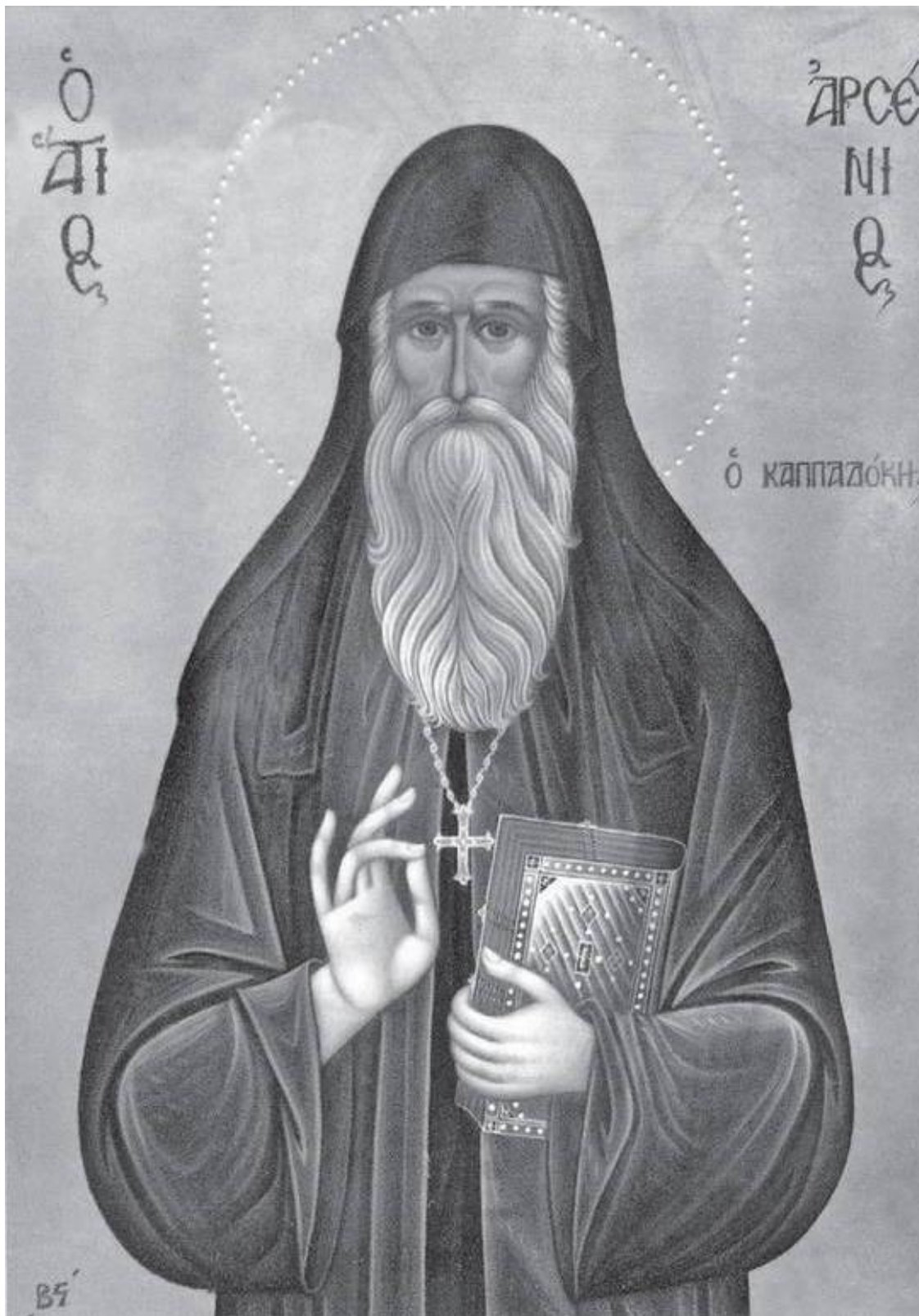
Преподобный Арсений Каппадокийский. Современная греческая икона

• Когда будущий старец был еще ребенком, один знакомый рассказал ему теорию Дарвина. Будущий святой очень расстроился, уединился и несколько часов молился Богу о врачевании. Ему явился Христос и сказал: «Я есть Воскресение и Жизнь. Верующий в Меня, если и умрет, оживет». Все сомнения на этом закончились.