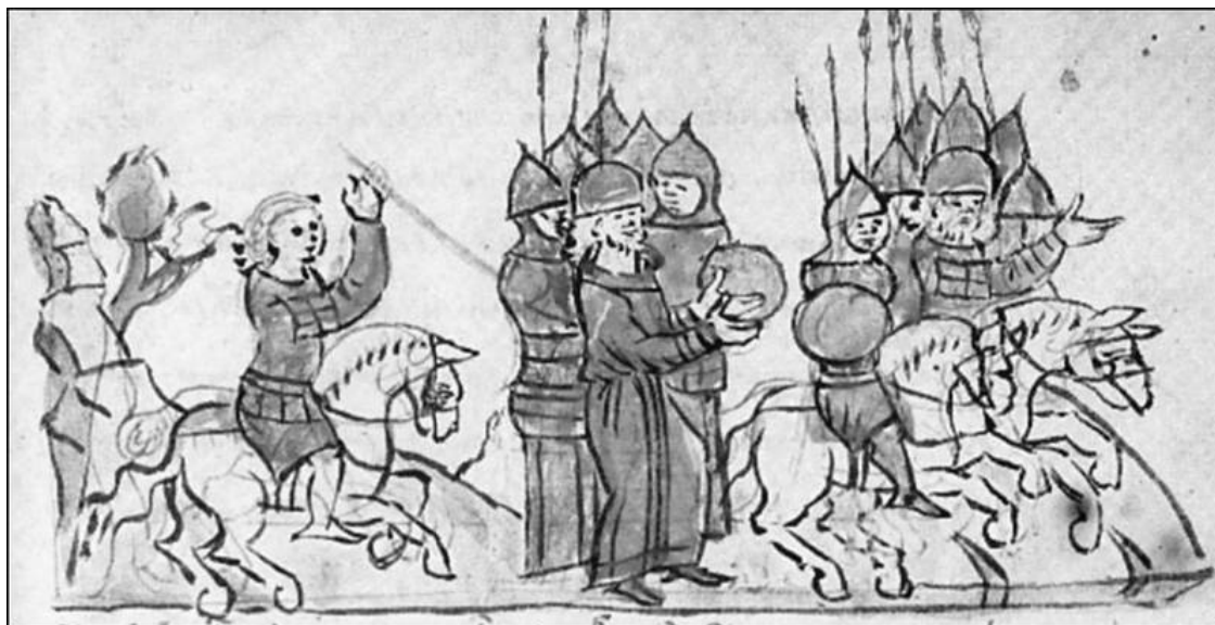
Битва на Нежатиной Ниве. Смерть Изяслава. Миниатюра Радзивилловской летописи.

На пути Олега встали телохранители Изяслава. Прикрывшись большими, в рост человека, червленными щитами, эти отборные бойцы преградили путь вражеской коннице. Гридни Олега сражались на пределе сил, пытаясь прорубиться к великокняжескому стягу, но каждый раз на их пути вставала стена щитов. Множество воинов погибло с той и с другой стороны, телохранители были вынуждены отступить на несколько шагов, однако Изяслав даже не пошевелился и продолжал оставаться под стягом. Воеводы уговаривали князя покинуть опасное место, но Изяслав Ярославич пропустил их слова мимо ушей – киевляне должны видеть своего князя.