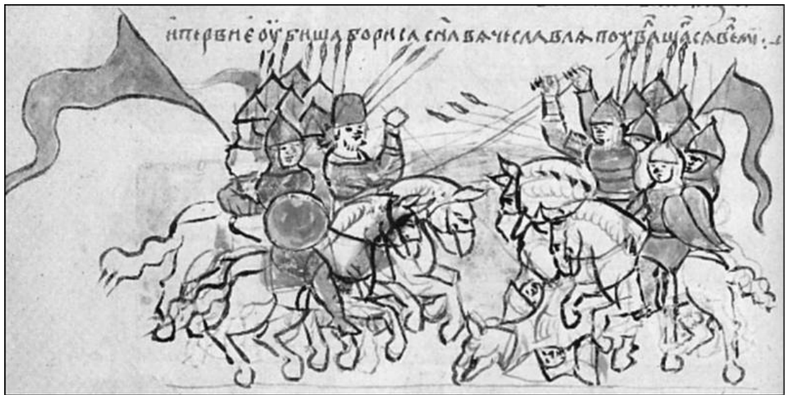
Битва на Нежатиной Ниве. Смерть Бориса Вячеславовича. Миниатюра Радзивилловской летописи.

В центре боевых порядков стали сходиться пешие полки. Сжимая в руках палицы, топоры, кистени и рогатины, ратники месили ногами осеннюю грязь, выкрикивали оскорбления в адрес противника. Северяне и киевляне сошлись в ближнем бою, теперь битва бушевала по всему фронту. Киевских ратников было больше, и вскоре они стали теснить противника. Олег видел, как дрогнула дружина Бориса, как захлебнулась атака северян в центре, что в целом сражение складывается неудачно. Князь решил переломить ход битвы. Осадив коня перед строем гридней, Олег скинул с плеч тяжелый промокший плащ и вытащил из ножен меч. Дружинная конница медленно пошла вперед, конские копыта вязли в раскисшей земле, но постепенно лошади набрали ход, и железный клин стрелой полетел через поле.