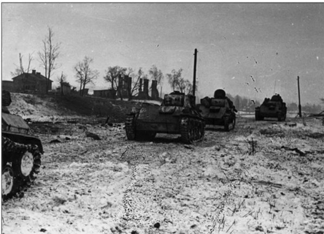
Танки Т-60 южнее Ладожского озера

В Шлиссельбурге стоял гарнизон из 328-го гренадерского полка (704 человека боевого состава). Вдоль дороги Синявино – Гонтская Липка оборону занимал 366-й гренадерский полк