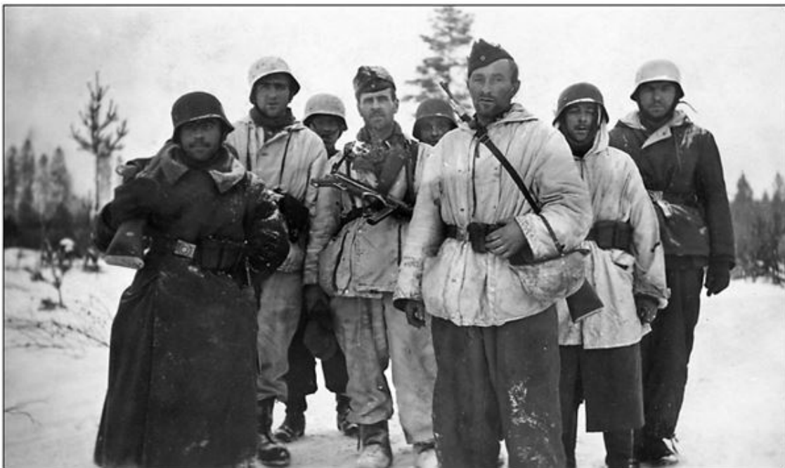
Немецкие солдаты у Рабочего поселка № 6