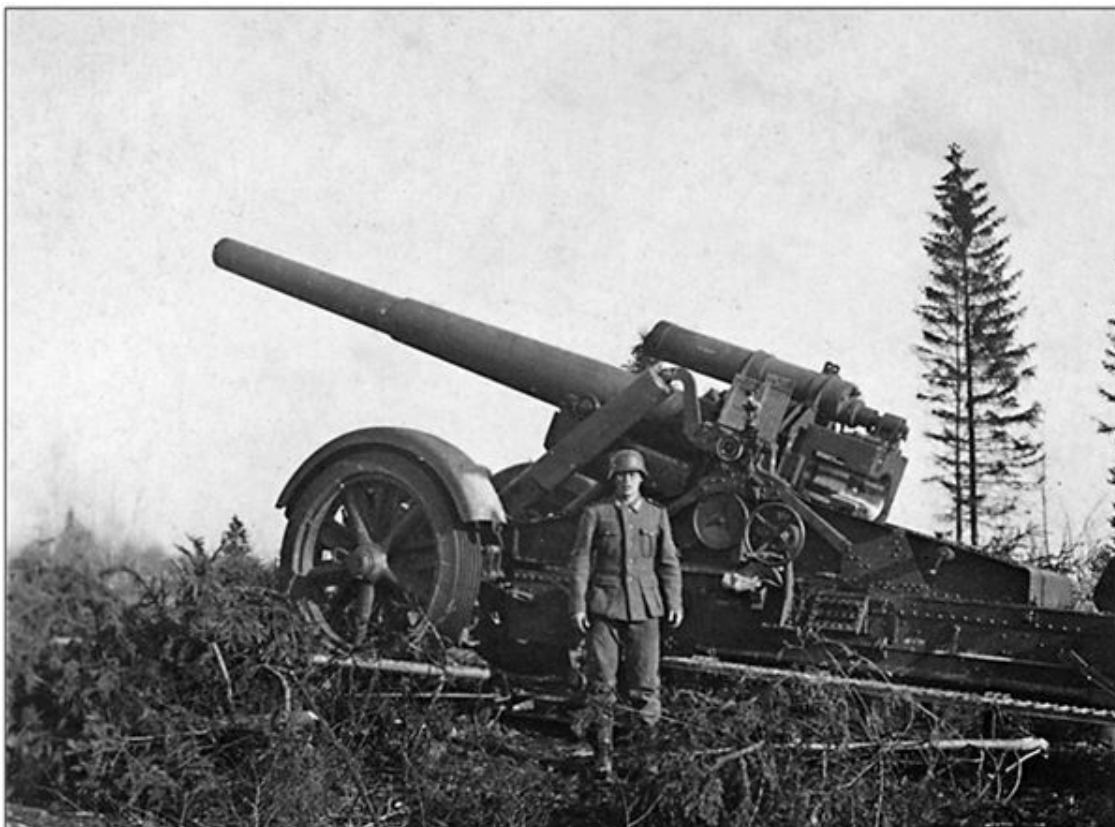
21-см мортира. На участке XXVI армейского корпуса противник заранее подготовил все возможное для действий масс артиллерии. Эти мортиры (или гаубицы) были одним из самых смертоносных орудий немецкой артиллерии

О том, что представляла собой немецкая оборона, стоит сказать особо. Вот какую характеристику советская разведка давала одному из самых мощных опорных пунктов в так называемой роще «Круглой», находившейся в месте, где Архангельский тракт пересекал р. Черную. Он располагался на возвышенном участке, с востока, юго-востока и севера был прикрыт болотистой и труднопроходимой местностью, в том числе поймой р. Черной. По западному берегу р. Черной тянулись проволочные заграждения, за которыми располагался снежно-ледяной вал с огневыми точками, за которым на расстоянии 100–250 м шла дерево-земляная стенка. Подступы были тщательно минированы, на танкоопасных участках противник установил надолбы. По фронту узел обороны в роще имел, по советским данным, 1,5 км в длину и 2,5 км в глубину. Таким образом, опорный пункт в роще «Круглой» представлял собой настоящий засов на двери в Синявино.