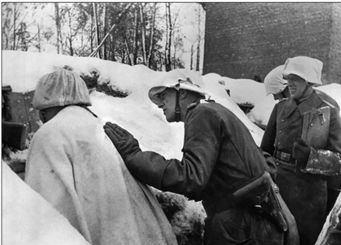
Командующий 18-й армией Георг фон Линдемани