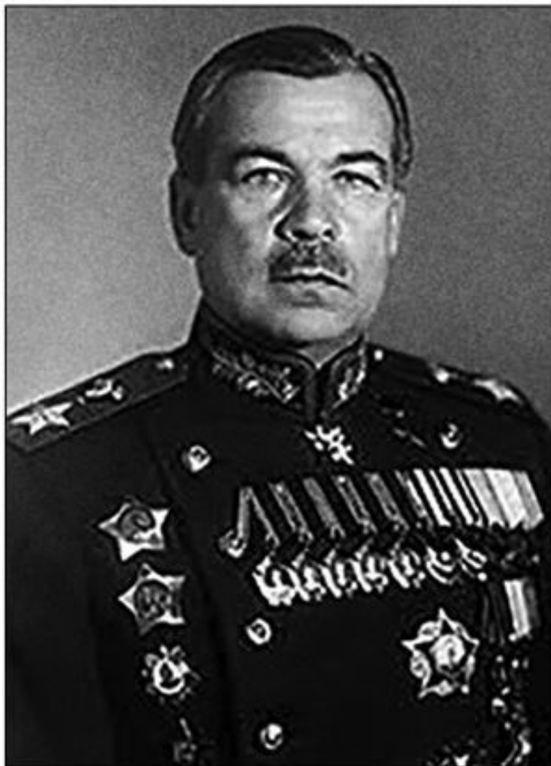
Командующий Ленинградским фронтом Л.А. Говоров

17 ноября последовало обращение ВС ЛФ в Ставку с просьбой о проведении этой операции. Позже в Ставку были направлены более конкретные предложения по ее проведению.