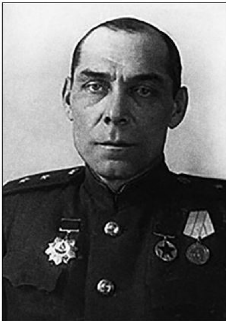
Командующий 67-й армией М.П. Духанов

136-я стрелковая дивизия должна была форсировать Неву, прорвать оборону противника у Марьино, уничтожить его и далее наносить главный удар, развивая наступление в направлении Рабочего поселка № 5. Дивизия обеспечивала ввод в бой 142-й и 123-й стрелковых бригад. На Шлиссельбург должна была наступать 86-я стрелковая дивизия Героя Советского Союза В.А. Трубочева.