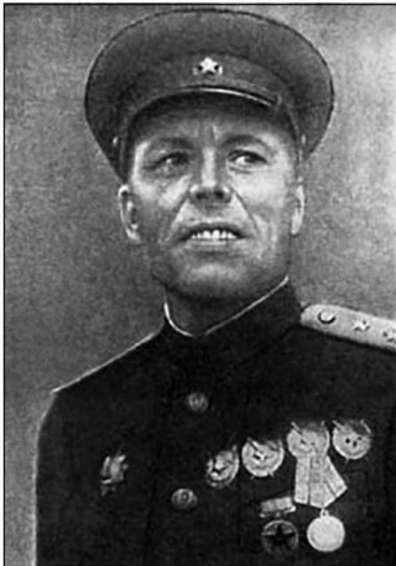
Командующий 2-й Ударной армией В.З. Романовский

Впервые за долгое время Волховский фронт был обеспечен действительно значительными силами. Только численность 2-й Ударной армии была доведена почти до 140 000 человек, 2100 орудий и минометов калибром от 76 мм и около 300 танков.