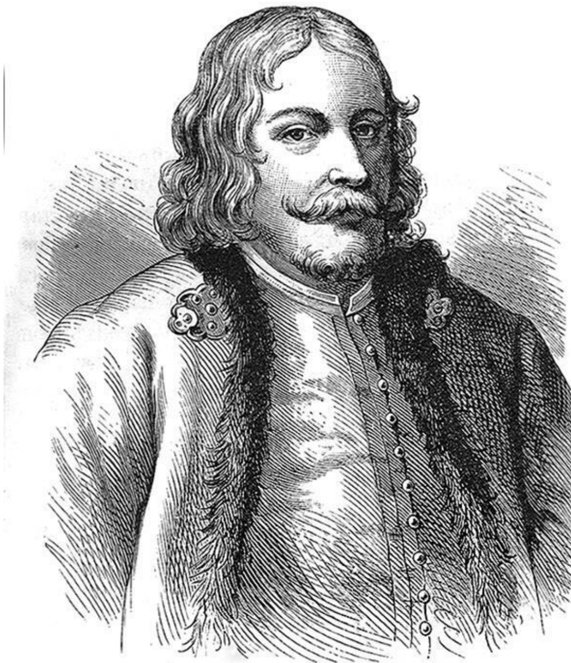
Князь В.В. Голицын

Противники Нарышкиных сгруппировались вокруг дочери Алексея Михайловича от первого брака и сводной сестры Петра царевны Софьи. Спровоцированный ими стрелецкий бунт привел к тому, что царская резиденция оказалась захвачена мятежниками, а наиболее видные сторонники Натальи Кирилловны, включая боярина Матвеева, убиты.