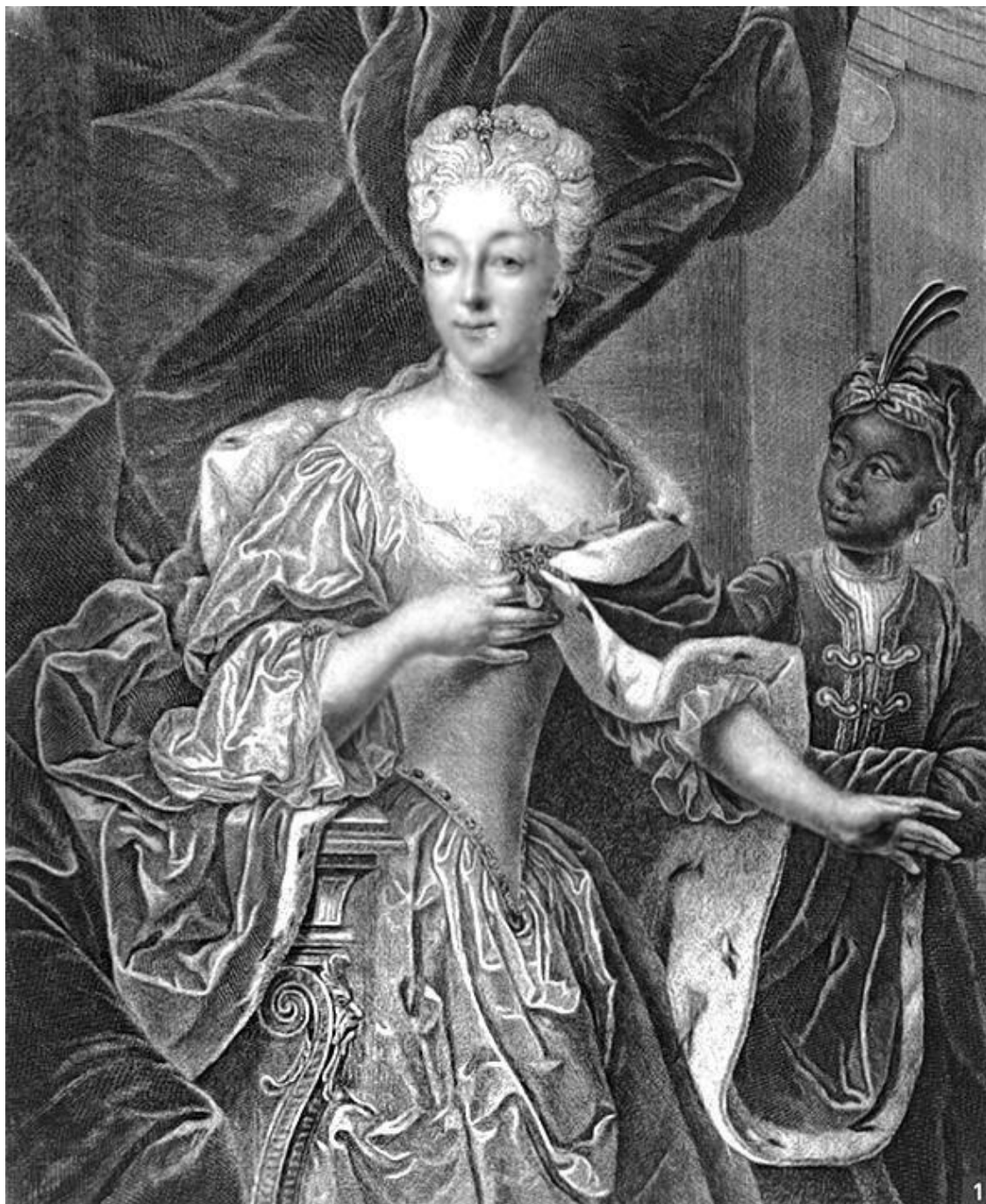
Принцесса Шарлотта Кристина София Брауншвейг-Вольфенбюттельская

утвердили 19 апреля 1711 года – через день после кончины императора Иосифа I, преемником которого и стал Карл VI – новый родственник российского государя.