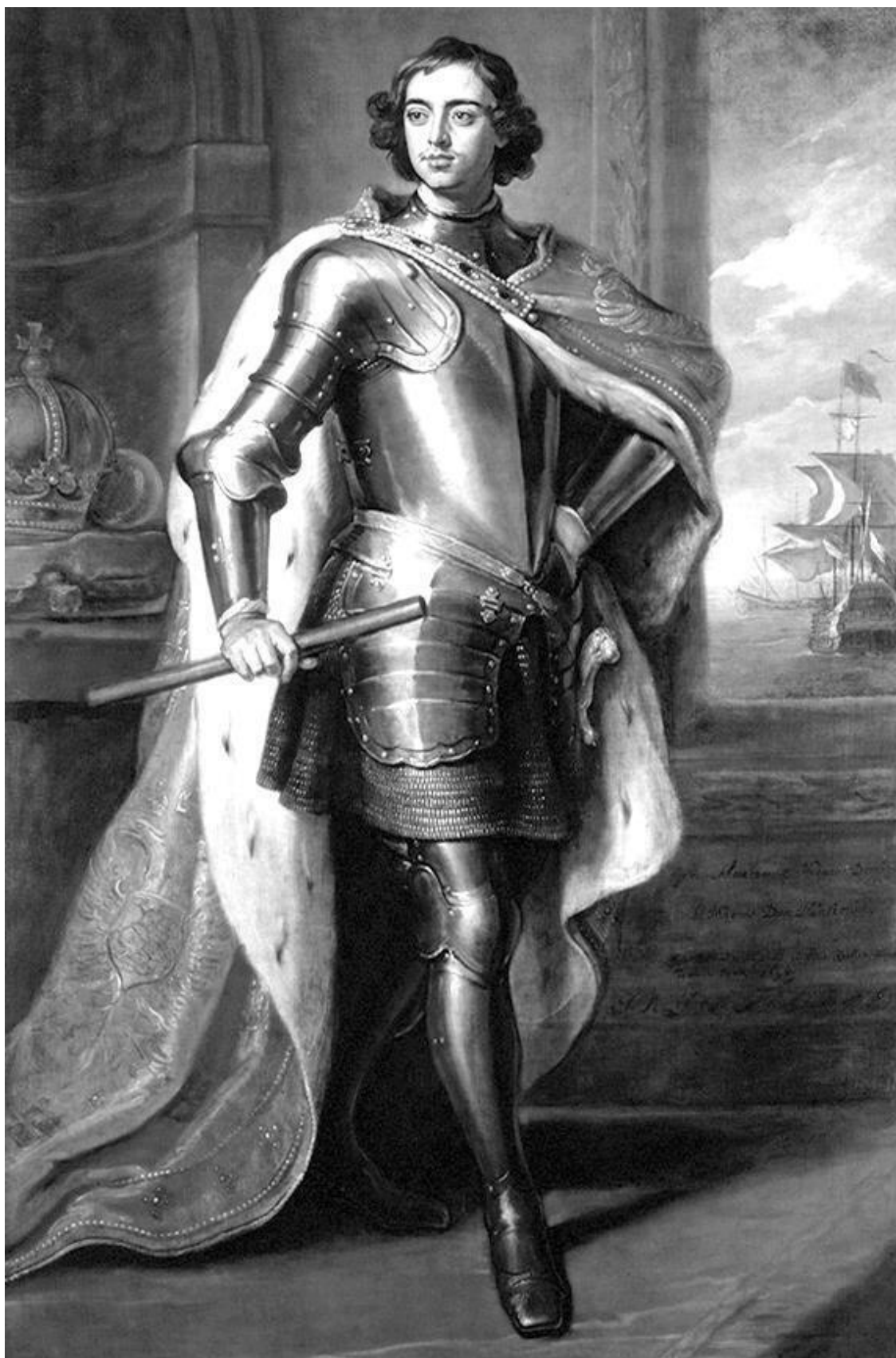
Петр I в юношеские годы

Детские и юношеские годы родившегося 30 мая 1672 года царевича Петра Алексеевича складывались таким образом, что, с одной стороны, он должен был испытывать неприязнь к