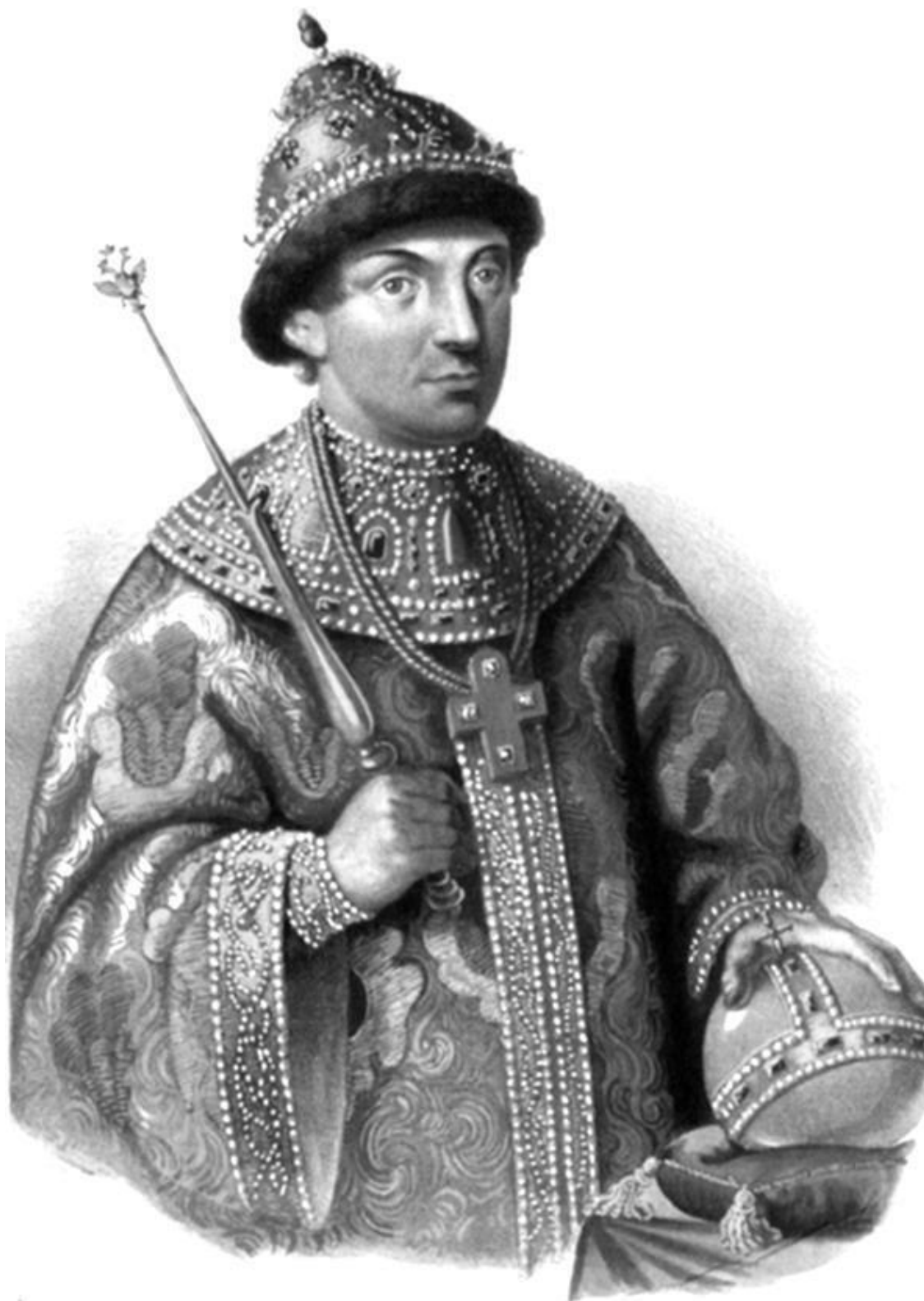
Царь Федор Алексеевич